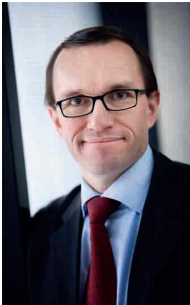
Utenriksminister Espen Barth Eide

– Ja, arbeidet for trosfrihet er meget viktig. Retten til å kunne velge og til å kunne praktisere en tro eller et livssyn er en viktig dimensjon i menneskers liv. Respekt for trosfrihet er nødvendig i et demokrati. Derfor legger vi stor vekt på dette i vår dialog med land som for eksempel