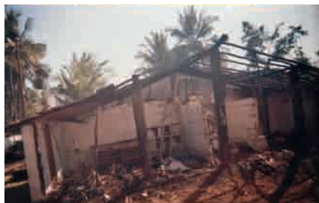
Pastor Gangadhars hus og kirke ble satt fyr på av hindunasjonalister julen 2008.