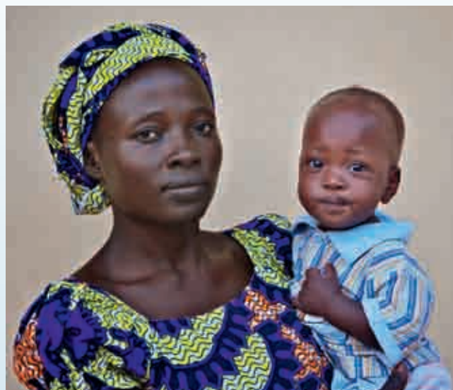
Denne nigerianske kvinnen ble nylig enke og alenemor etter at hennes pastormann ble drept i et angrep på en kirke i nordlige Nigeria.

Et godt eksempel på felleskirkelig samarbeid i Norge er fakkeltogene for forfulgte kristne, som i 2012 ble arrangert i Oslo, Bergen, Stavanger, Stord – og nytt av året – Kristian-