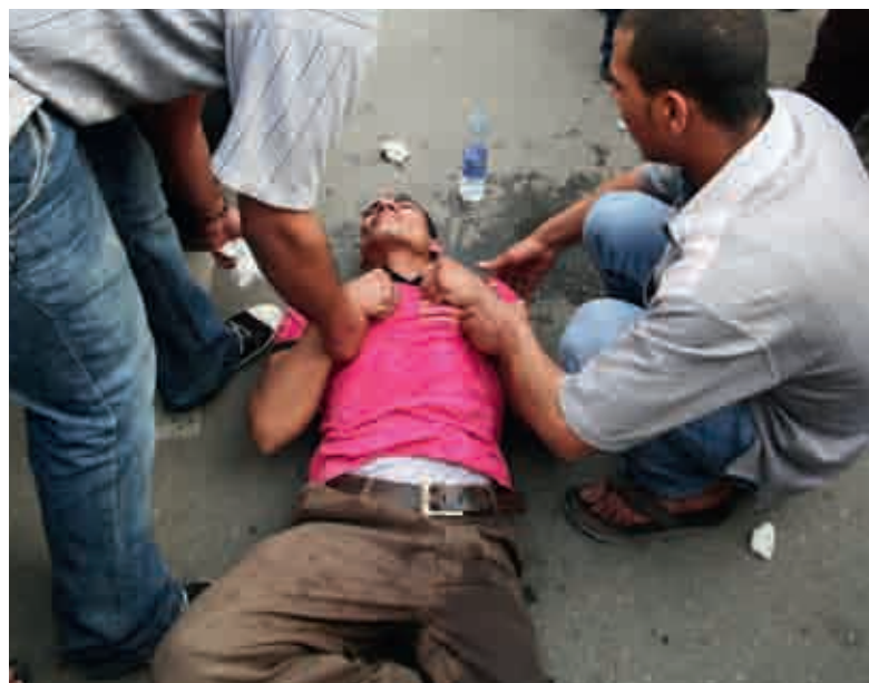
En skadet mann får hjelp utenfor St. Markus katedralen.

Oversatt og bearbeidet av Hilde Skaar Vollebæk