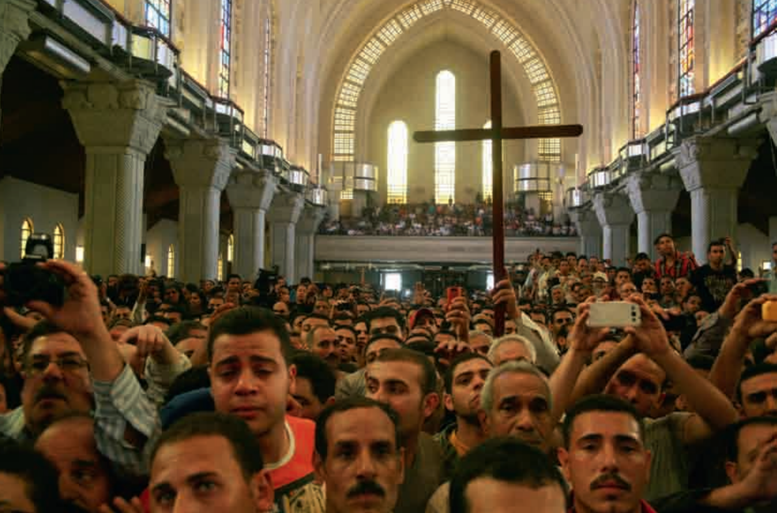
Fra St. Markus-katedralen før angrepet den 7. april.