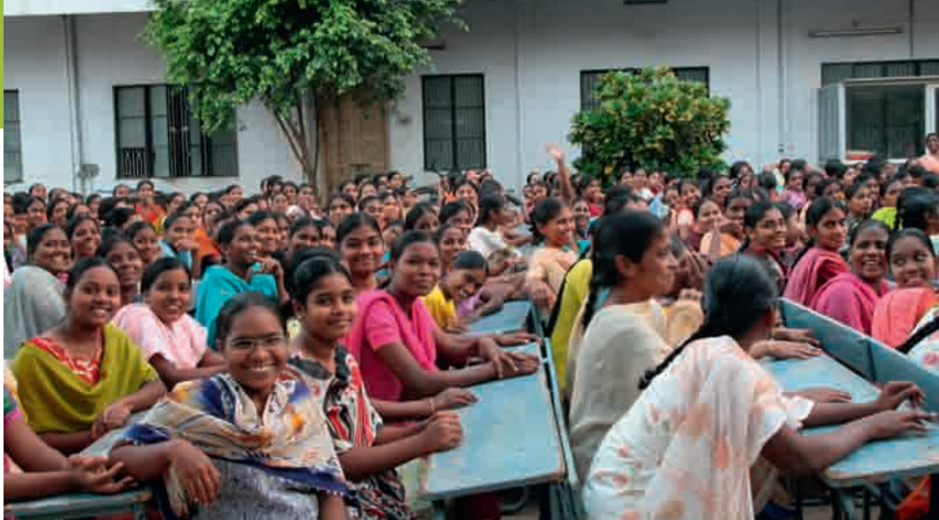
Indiske kvinner på menneskerettighetskurs i regi av AICC.

De er fattige og har ofte ikke noe annet sikkerhetsnett enn nettopp menigheten til å hjelpe dem.