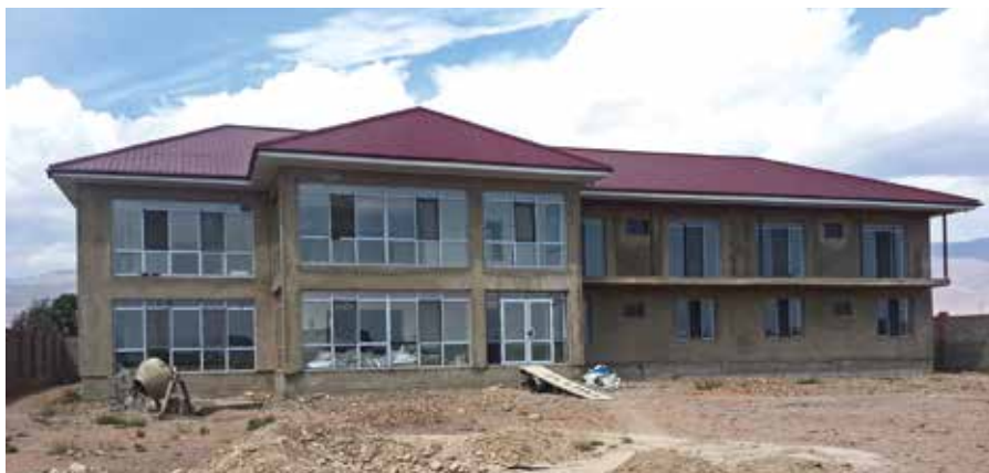
Familiesenteret ved Issyk-Kul er snart ferdig. Hjelp oss å slutføre arbeidet!

Men Guljan klarte å overbevise ham om kristendommens sannhet. Hun vant hans hjerte, og han tok imot Jesus.