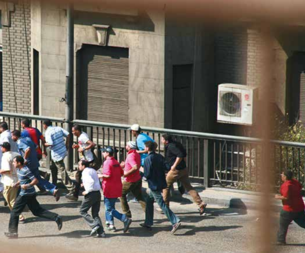
Etter Morsis avsettelse demonstrerte tilhengere av Det muslimske brorskapet voldsomt i en rekke byer i Egypt. Her jages de av sivilklede politimenn over en bro i Zamalek.

den med en fengselsstraff på seks måneder.