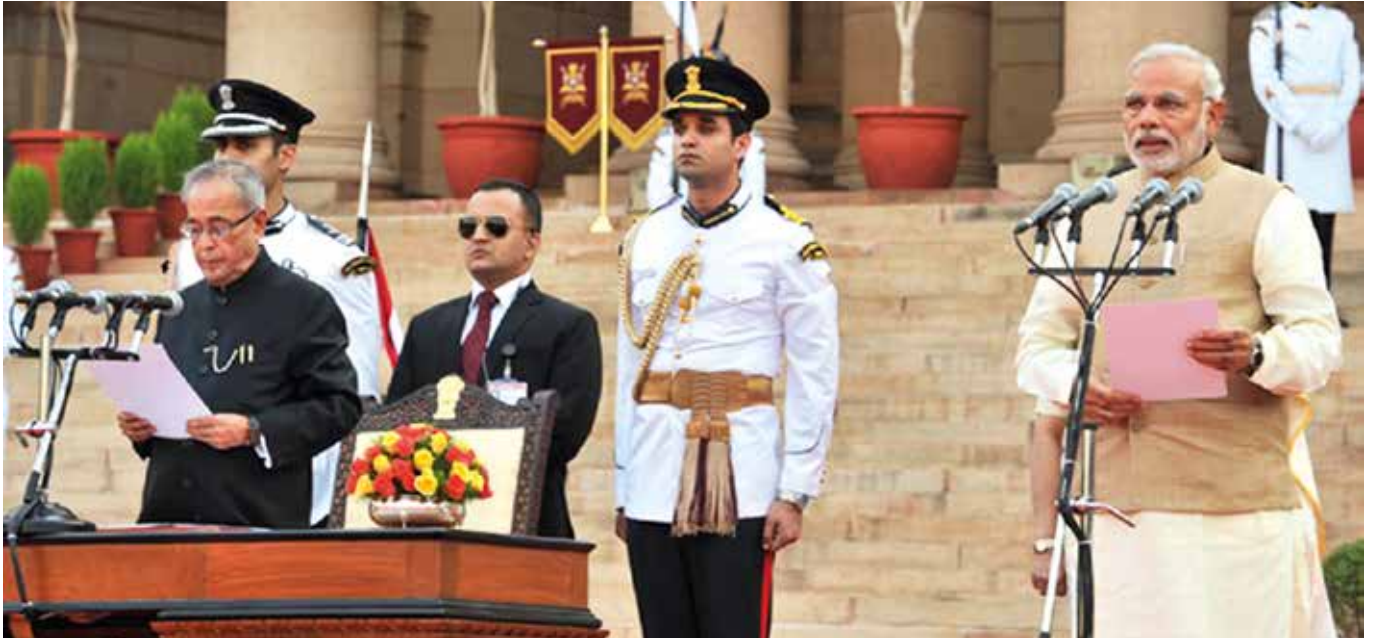
Narendra Modi tas i ed som Indias nye statsminister, den 26. mai 2014.

Etter valget i India er kristne grupper bekymret over økende antall angrep på minoriteter.