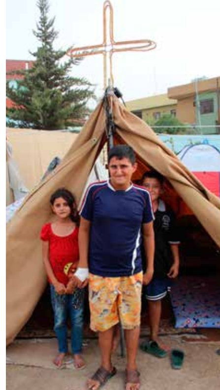
I denne teltleiren bor flyktninger fra den kristne byen Karakosh, kjent som den største kristne byen i Irak. IS har jaget nesten 50 000 mennesker fra byen.

40 mennesker på et rom og et tilhørende tak. De er likevel heldige som har mulighet til å varme seg i en leilighet når vinteren kommer. Det kan ikke flyktningene som bor i de mange teltleirene rundt omkring i Erbil. Snart kommer vinteren – og de lette teltene beskytter ikke mot kulde og regn. Her bor gjerne 20 personer tett i tett i et enkelt telt.