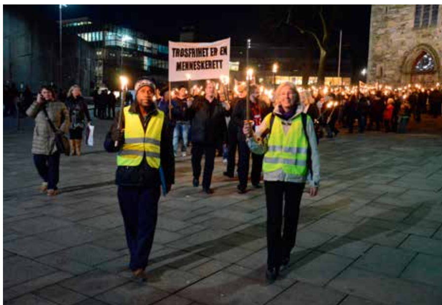
I år arrangerer Stefanusalliansen og Åpne dører fakkeltog for de forfulgte elleve steder i Norge.