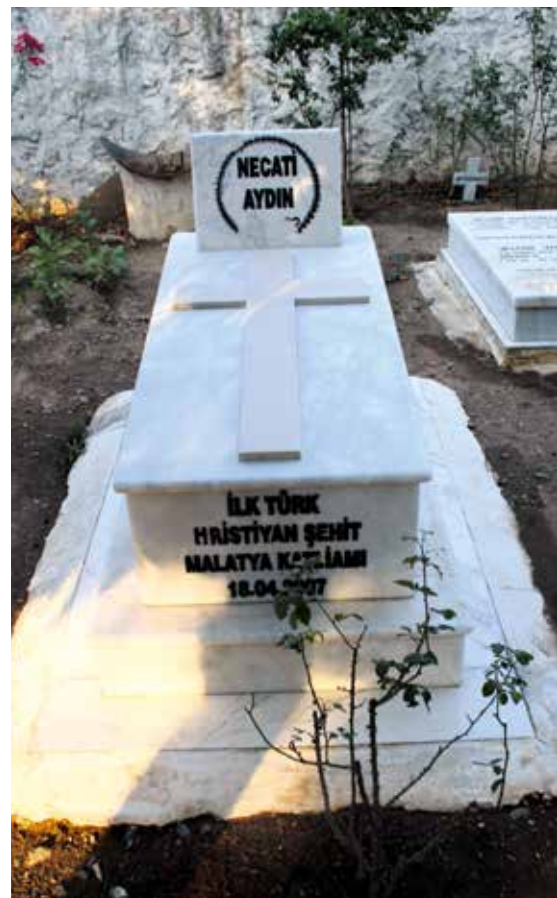
Necati Aydın og to andre kristne menn ble myrdet i Malatya i 2007.

Eiendommer og kulturskatter ble ødelagt og overtatt av overgriperne. Ifølge kilder var det det for hundre år siden bare i Tur Abdin, et område i det sørøstlige Tyrkia, omtrent 600 kristne landsbyer og cirka 800 000 syrisk-ortodokse kristne.