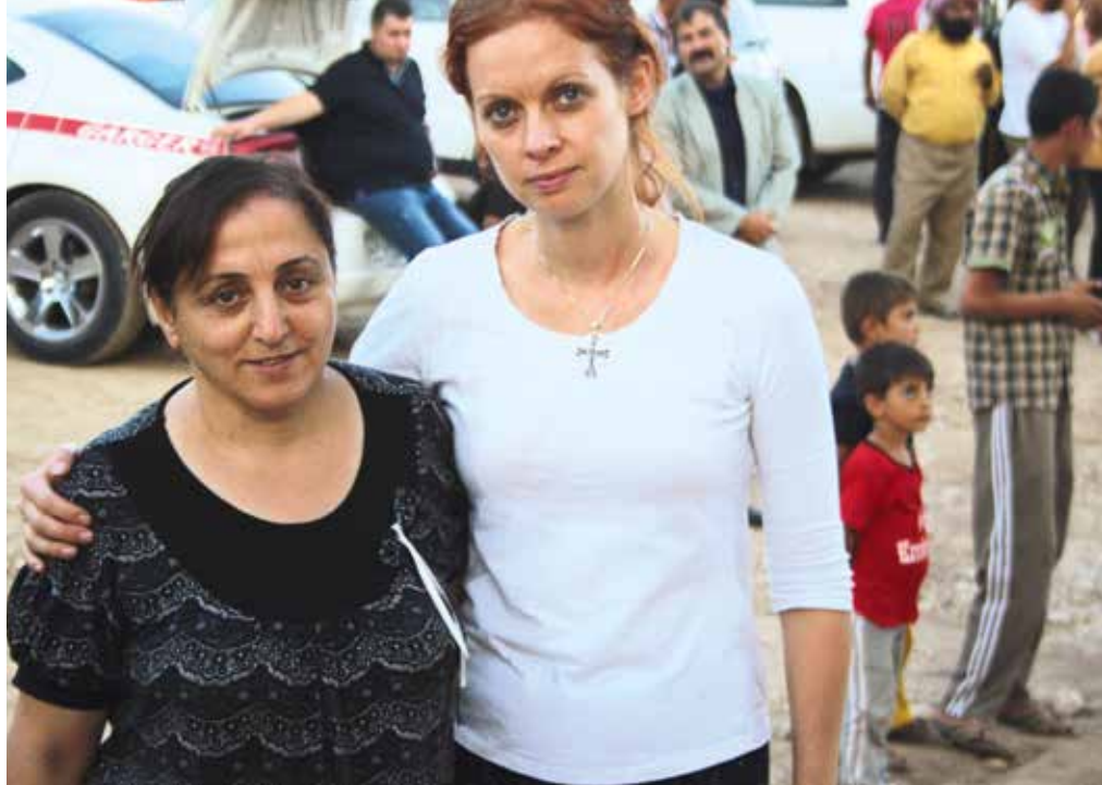
Suzan er en av 6 000 irakere som har flyktet til den lille kristne landsbyen Sinji, nær Dohok. Hun er universitetslærer fra Mosul.

– Nok er nok, sier også den unge kristne irakeren som senere i uka deler