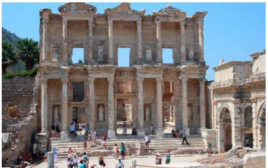
Kanskje besøkte Paulus biblioteket i Efesos. Byen var i hvert fall en av de første han misjonerte i.

Samtidig vokser protestantiske kirker fram. Særlig gjennom overnaturlige møter med Jesus og gjennom helbredelser, kommer tidligere muslimer til tro. Av frykt holder mange sin nye tro skjult, noe som gjør at omfanget av