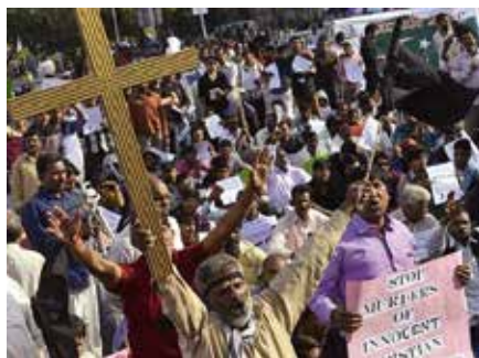
Pakistanere demonstrerer mot blasfemilover og drap på uskyldige kristne.

Med sine vage formuleringer gjør blasfemilovene det mulig for både myndigheter og samfunnskrefter å kneble dem som tenker og tror annerledes, uten respekt for rettssikkerhetsprinsipper. Som selvutnevnt vokter av den sanne tro, kan statsapparatet straffe politiske dissidenter så vel som de som har og uttrykker en tro som er annerledes enn det myndighetene ønsker å fremme. Religiøse minoriteter, ateister, konvertitter, politikere,