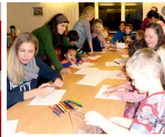
Alle er opptatt av å lage fine tegninger og brev.