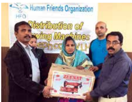
Stefanusalliansen støtter sykurs til kristne kvinner i Joseph Colony.

- Da forsto jeg at vi trengte en plattform for å hjelpe forfulgte kristne, og jeg startet HFO. - Hvordan er situasjonen for den kristne minoriteten i Pakistan i dag? - Dessverre er den blitt verre de siste årene. I dag opplever vi mer alvorlig forfølgelse enn noen gang i landets historie. De siste årene har vi sett flere voldelige mobbangrep. Mange kristne jenter blir kidnappet og tvunget til å konvertere til islam. - Hva tror du er årsaken til dette? - En årsak er mangel på utdanning og opplysning i folket. Det fører til religiøs intoleranse. I tillegg har krigene i Afghanistan og Irak ført til at kristne lider mer. Muslimske ekstremister tenker at USA og andre vestlige land som er involvert i disse krigene, er kristne nasjoner. De hevner seg på kristne i Pakistan, til tross for at de ikke har noe med krigene å gjøre. Unge lokale, muslimske menn blir med i ekstremistiske grupper som en reaksjon på krigene i