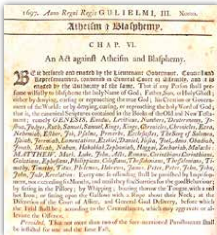
Bilde av en gammel lov mot ateisme og blasfemi fra USA. Mange vestlige land har også hatt blasfemilover, og noen har dem fortsatt.