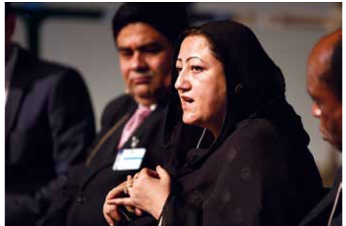
Parlamentarikere fra mange land, blant annet Pakistan, deltok på konferansen.