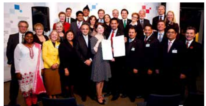
Deltagerne på IPP signerte Charter for Freedom of Religion or Belief på Nobels fredssenter.