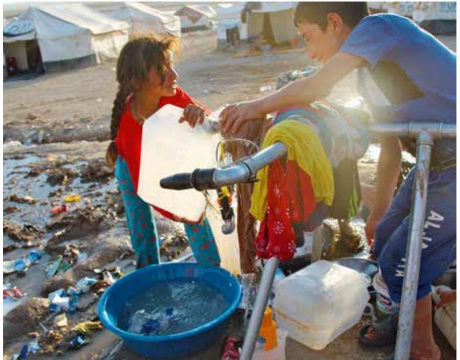
Hverdagsglimt fra et liv på flukt.

I Irak levde de fleste kristne i området rundt byen Mosul og i landsbyer på Ninivesletten. I juni i fjor inntok IS-krigere Mosul og landsbyene rundt, og både kristne og andre minoriteter måtte flykte. Mange har endt opp i midlertidige bosetninger i den kurdiskdominerte