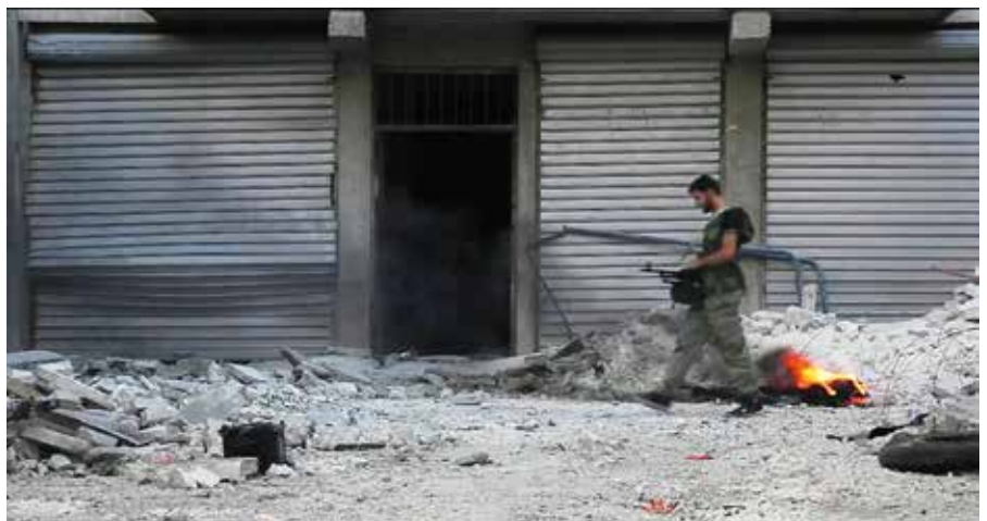
Et trist gatebilde fra Lilys hjemby Aleppo. På bildet ser vi en soldat fra De frie syriske styrker, som ble dannet av offiserer som hoppet av da al-Assads regjeringshær begynte med angrep mot Syrias sivilbefolkning.

– Det var en ny og helt annerledes opplevelse for meg. Jeg kunne til og med stille spørsmål om Gud og troen! Dette var bedre enn bare å akseptere trosdogmer uten å tenke selv. Og min