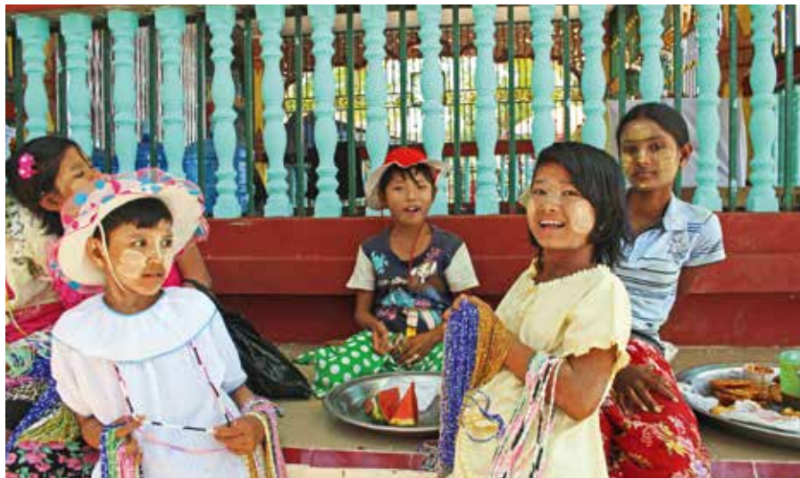
Myanmar er et mangfoldig land.

De fire nye lovene omtales som et sett lover som skal beskytte «rase og religion». I et land med 135 offisielle «raser» (se ramme) og et mangfold av religion og livssyn, sier det seg selv at å beskytte én rase og én religion er et farlig prosjekt. De fire lovene begrenser religiøs konvertering og tverreligiøse ekteskap. I tillegg legges det restriksjoner på antall barnefødsler per kvinne, og polygami forbyes. Hele lovpakken er problematisk, fordi den er skreddersydd for å begrense friheten og utbredelsen til etniske og religiøse minoriteter i landet – og da særlig rohingya-muslimene. De to førstnevnte