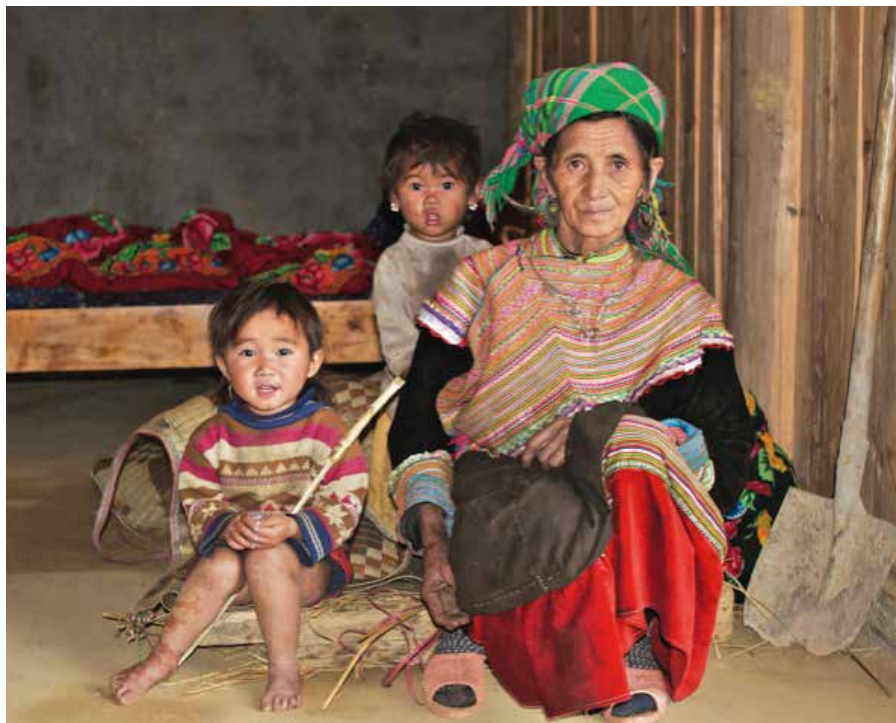
Representanter for hmong-folket i Vietnam. Blant denne etniske gruppen har evangeliet hatt enorm gjennomslagskraft i flere tiår.

Vietnam er lite kjent i Vesten. Amerikanernes rolle i Vietnamkrigen ser ut til å ha skapt en kollektiv skyldfølelse som har rammet Vestens kirker så vel som politikere. Få ønsker å ha noen direkte befattning med et av få gjenstående kommunistregimer i verden. Mens menneskerettighetsaktivister rapporterer om menneskerettighetsbrudd, ser myndighetene ut til å klare å begrense den internasjonale kritikken. Med sine drøyt 90 millioner innbyggere kan landet vise til en blomstrende økonomi og en voksende turistnæring.