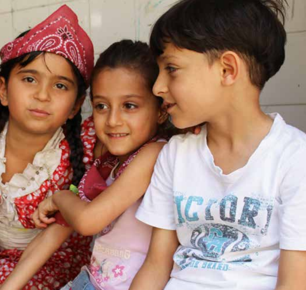
Syriske flyktningbarn som deltar på skoletilbudet som Stefanusalliansen støtter i Beirut; les mer på side 8.

venns mor viste meg ut fra Bibelen at det ikke var Gud som tok faren min. I oppveksten min hadde jeg oppfattet det slik at det er gode gjerninger som gjør at du kommer til himmelen. Nå lærte jeg at det er troen på Jesus som frelser, og jeg tok imot ham. Men det tok meg år å forstå at Jesus elsker meg, forteller hun.