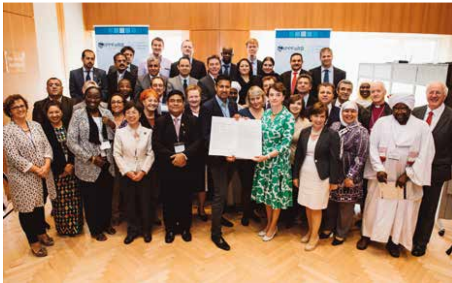
Parlamentarikere fra over 50 land deltok (ikke alle er med på bildet), og på talerstolen stod både ofre for forfølgelse og en representant for FNs generalsekretær.

– Vi håper at vi kan bidra til at religiøse minoriteter rundt omkring i verden får det bedre.