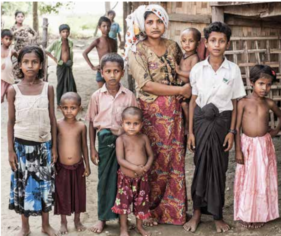
Faren i denne Rohingya-familien døde etter at han var blitt torturert av politiet i Myanmar. Årsaken var at han er muslim, mens de fleste i landet er buddhister.

Gud har skapt alle i sitt bilde og alle, uansett kjønn, rase, alder eller tro, har derfor et ukrenkelig menneskeverd. I diakoni og i nød- og utviklingshjelp for fattige og marginaliserte tar kirken menneskeverdet på alvor og forskjellsbehandler ikke på grunn av tro. Den sultende får mat – uavhengig om per-