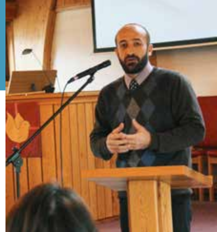
Forfulgte kristne er et viktig fokus for HLT, som i tillegg til informasjonsbesøk fra Stefanusalliansen har dette som fast bønnetema på nattverdsamlingene.

1. Jeg synes at måten han ble kristen på rørte ved meg. Han begynte å lese i Bibelen for å kunne argumentere mot kristendommen, men det ga han mange svar på store livsspørsmål. Det inspirerer også oss her hjemme til å lese mer i Bibelen.