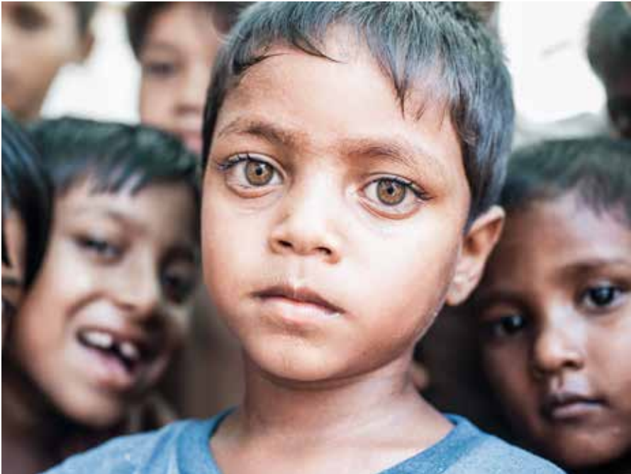
Rohingya-folket i Myanmar er muslimer, og de er en av gruppene i verden som opplever mest forfølgelse på grunn av sin tro. Bør vi som kristne også forsvare deres trosfrihet? spør artikkelforfatteren.

sonen er kristen, muslim eller buddhist. Det samme burde gjelde i arbeidet for menneskerettigheter og trosfrihet.