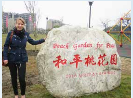
Konferansen ble avsluttet med at deltakerne plantet ferskentrær i en symbolsk «fredshage».

«APRFF har én viktig målsetting: Å mobilisere til felles og koordinert innsats for trosfrihetsarbeid i denne regionen. Vi er mange som jobber aktivt enten i eller opp mot denne regionen. Nå som mange av oss har truffet hver-