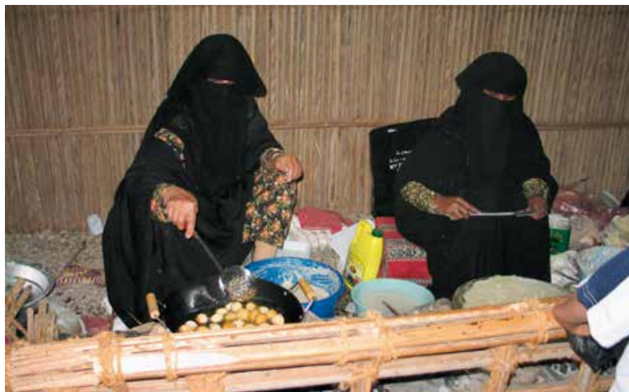
Det finnes kristne også på den arabiske halvøy, men de kan ikke være åpne om det.

oppdratt til. Pastoren i denne kirken fortalte meg at mange muslimer nå hadde kommet til tro på Jesus, uten at det gjorde noe inntrykk på meg. Jeg fikk med meg en kassett med vitnesbyrdet til en sjeik som var kommet til tro på evangeliet.