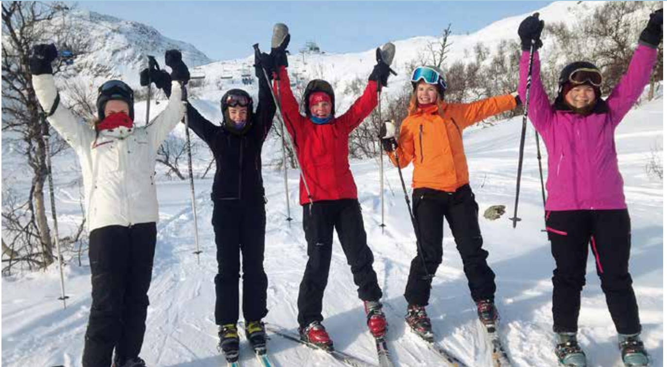
Stefanusalliansen jobber mange steder i verden, også i den norske fjellheimen.