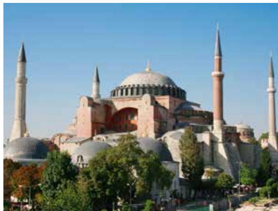
Hagia Sofia i Istanbul ble bygget som kirke på 500-tallet. 900 år senere ble den omgjort til moské. I 1934 ble helligdommen sekularisert og omgjort til museum.

Etter valget i november i fjor har regjeringspartiet Partiet for rettferdighet og fremskritt (AKP) rent flertall i parlamentet. President Recep Tayyip Erdoğan har lenge signalisert at han