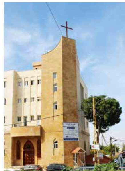
Resurrection Church ligger midt i Beirut.