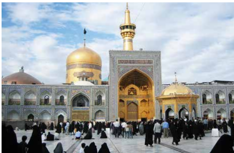
Islam er offisiell religion i Iran. Det iranske regimet prøver systematisk å begrense evangelisk kristendom, og PARS har en viktig rolle i å utdanne ledere til iranske huskirker.

– Iranske kirker i utlandet har en stor påvirkning på det som skjer i Iran. Hvis vi styrker kirkene utenfor Iran, så påvirker det også de som er inne i landet. Når