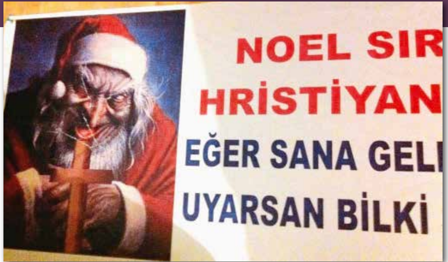
Denne plakaten har hengt i Istanbul i forbindelse med julen de to siste årene, og advarer folk mot å delta i kristen julefeiring.