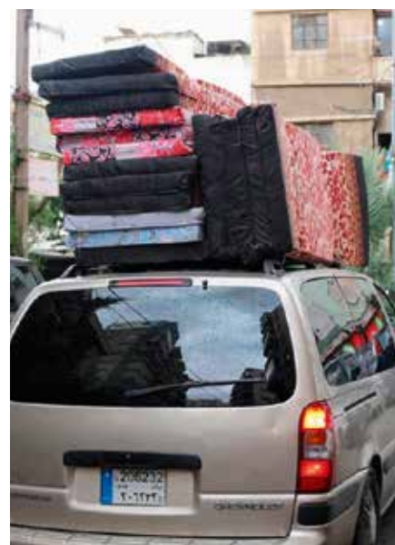
Her blir madrasser kjørt inn i flyktingområdene i Beirut.