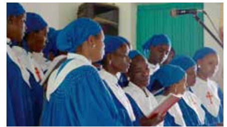
Trosfriheten er sterkt begrenset i flere områder i Etiopia. Her er et kor i Mekane Yesus-kirken.