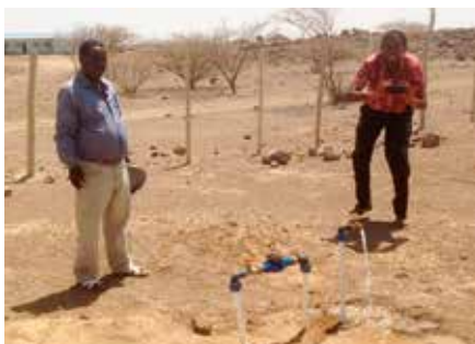
På denne tomta i Semera skal det bygges et administrasjonssenter/gjestehus/forsamlingslokale. Herfra planlegges målrettede evangeliske og diakonale tiltak blant Afar-befolkningen.

Hjelp oss å komme i gang med dette flotte prosjektet – din gave er viktig! Bruk vedlagte giro eller kontr. 3000 14 57922. Merk gaven «Nord-Etiopia».