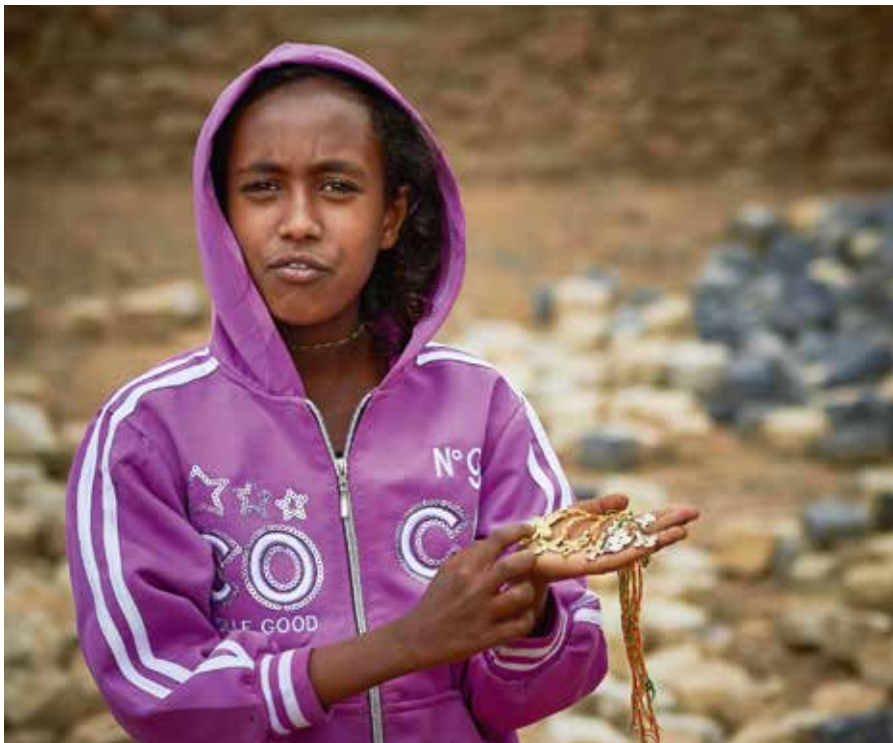
Det er mange kristne i Etiopia, men også islam er i sterk framvekst. Nå ønsker Mekane Yesus-kirken vår hjelp for å spre korsets budskap til den muslimske Afar-befolkningen. (Illustrasjonsbilde)