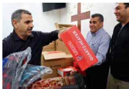
Gjennomsnittstemperaturen i Beirut er i de kaldeste vintermånedene ned mot 13 grader. Da er det kjekt for flyktingene å få varme pledd.

Livet som flyktning i Libanon er tøft. Mange av de viktige rettighetene blir ikke ivaretatt her, som for eksempel retten til å eie en bolig. Dette setter flyktingene i en vanskelig situasjon. Leieprisene i Beirut er så høye at flere familier må dele rom. Arbeidsledigheten har eksplodert og er vanskelig nok for en libaneser. Beirut består av syriske, irakiske og palestinske flyktninger,