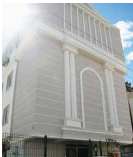
Det nye kirkebygget til Antalya Evangelical Church har kafé, åpen barnehage, menighetssal og kontorer.

fort bli mange. I etasjen under er det rom som etter hvert skal huse nabolagets eneste åpne barnehage, der foreldre kan komme med sine barn på dagtid for å leke i ly for sommervarmen. Området der kirken ligger huser mange barnefamilier, og menigheten ønsker å legge til rette for gode møteplasser med nabolaget. En stor takterrasse innbyr til sosiale aktiviteter. Ramazan forteller at veggene vil bli dekorert med bilder av