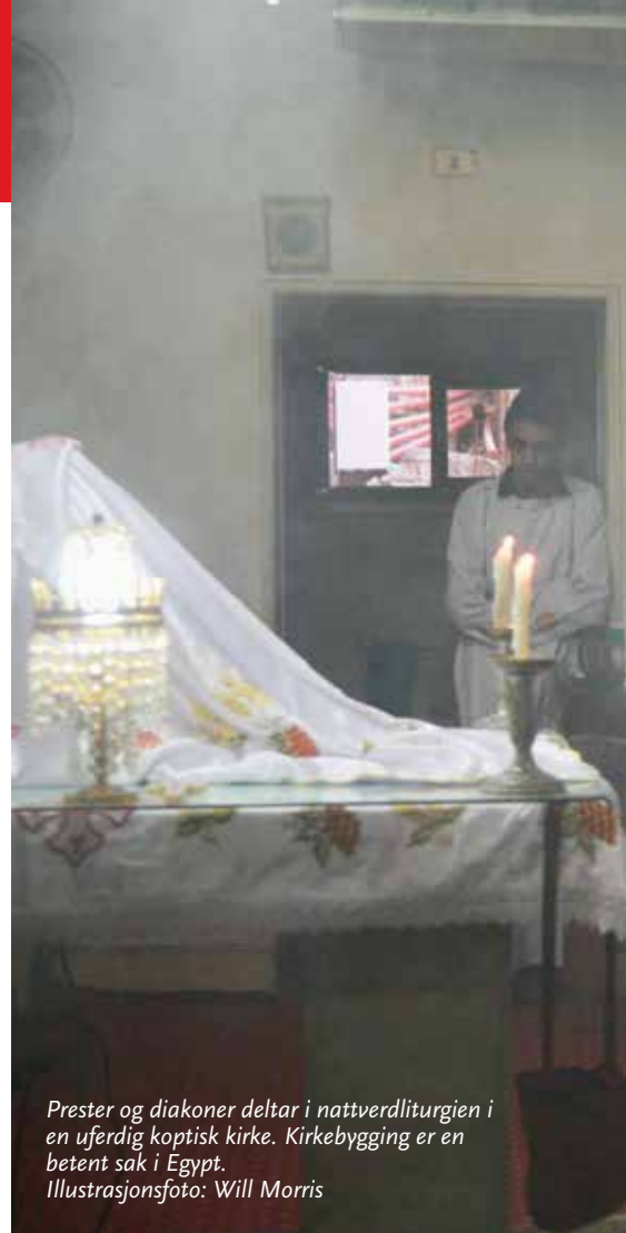
Prester og diakoner deltar i nattverdliturgien i en uferdig koptisk kirke. Kirkebygging er en betent sak i Egypt.

ke biskoper i Minya nektet å delta på flere forsoningsmøter før overgripere blir straffet, ifølge EIPR.