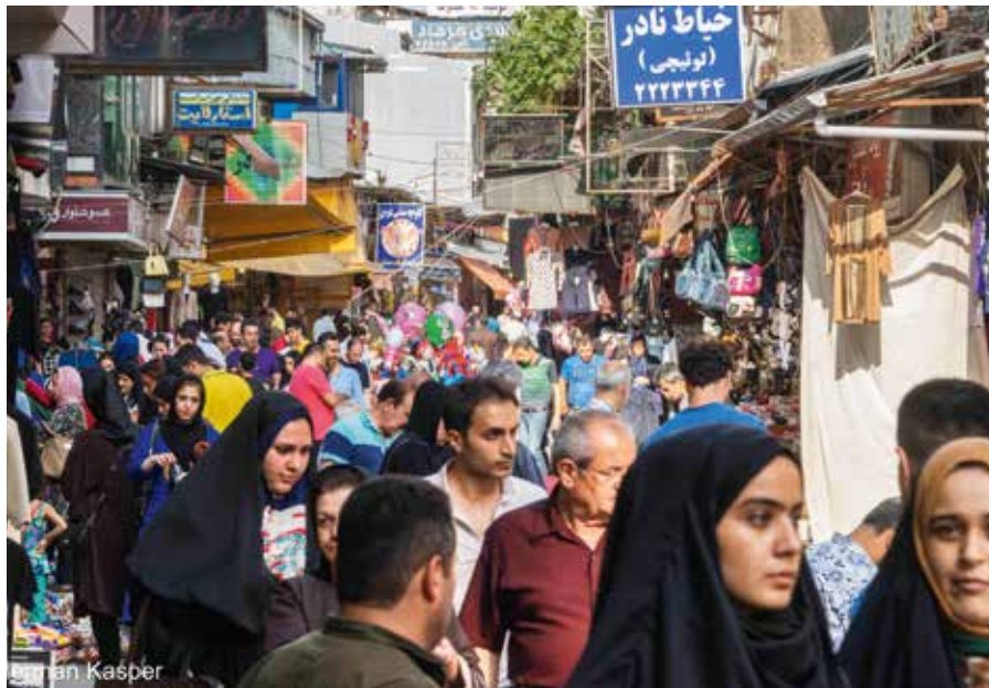
Ifølge vår partner PARS, som utdanner kristne ledere i Iran, er det minst én million iranere som har en dyp respekt og kjærlighet for Jesus. Men det er veldig vanskelig å være kristen i Iran, spesielt om man har konvertert fra islam.

snakket om tilgivelse, men det hadde ingen effekt. Før hun gikk, ga hun dem telefonnummeret sitt, så de kunne kontakte henne om de hadde noen juridiske spørsmål. Hun oppfordret dem også til å forstå hvor viktig det er å tilgi.