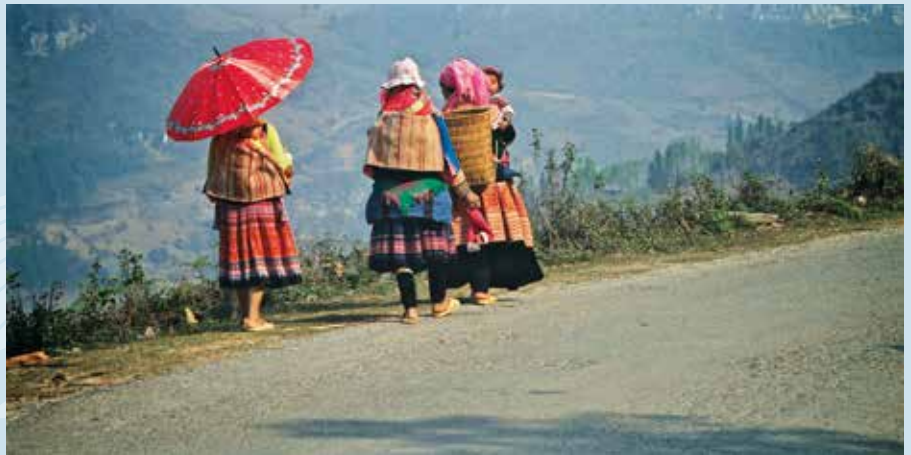
Bare i Vietnam finnes det visstnok over 300 000 kristne blant hmongfolket.

Selv snakket vi med en som ble døpt da han var 14 år gammel. Hans far hadde kommet til tro ved å høre på kristne radiosendinger. Slik lærte han også hvordan han skulle gå fram som en Jesu disippel. Han skjønte at de