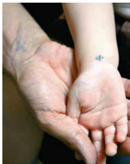
Mange koptiske kristne tatoverer et kors på underarmen.

På tross av en vedvarende spent situasjon, har politiske myndigheter vist liten vilje til å se angrepene på koptere som planlagte og systematiske. I stedet presenteres de som enkeltstående tilfeller av kriminalitet. Likevel utøver myndighetene press på ofrene til å delta i såkalte forsoningsmøter, der religiøse ledere, og ikke rettsapparatet, får myndighet til å inngå avtaler om kompensasjon. Ikke sjelden får ofrene beskjed om å flytte, da det er ofrenes nærvær som blir sett på som den utløsende faktoren bak angrepet. Det siste året har koptis-