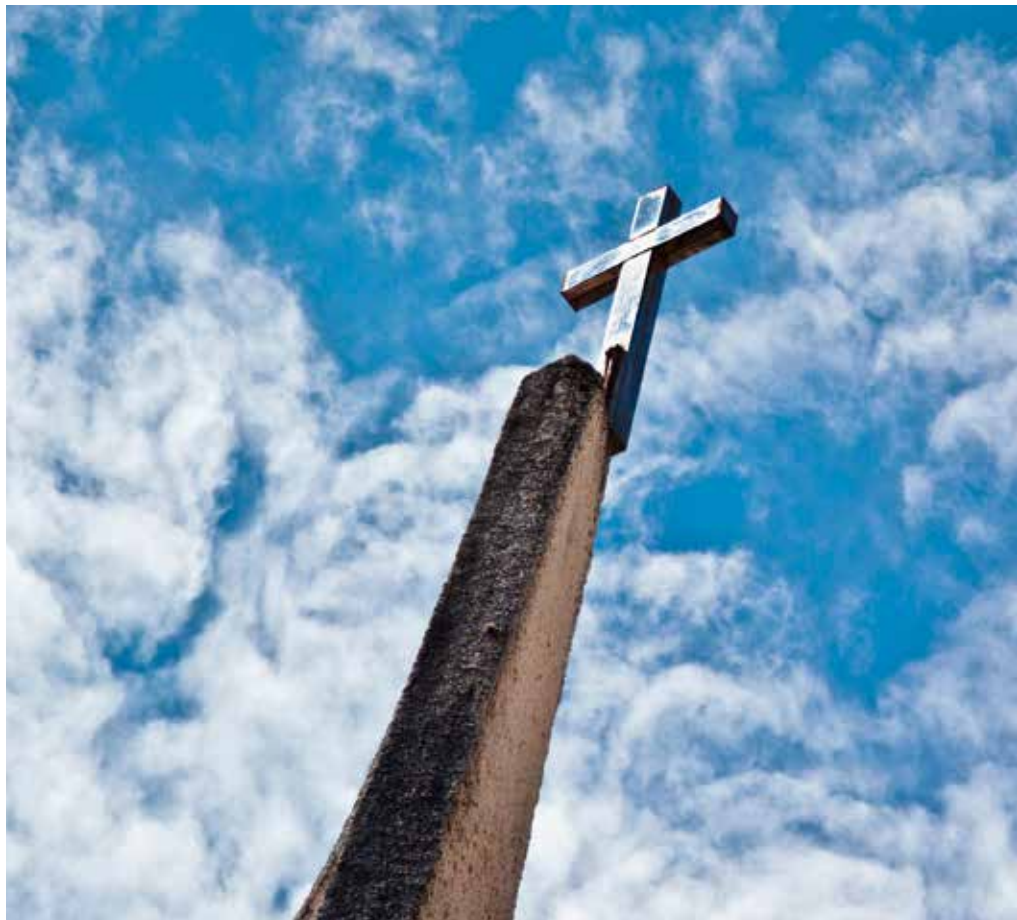
Det som skjedde på korset ble avgjørende for drapsmannens liv.