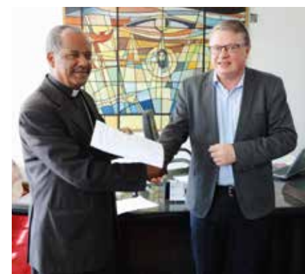
Stefanusalliansen inngår kontrakter med alle våre partnere i nye prosjekter. Illustrasjonsfoto fra Etiopia: Kai Tore Bakke

I alle nye prosjekter inngår vi kontrakter med våre partnere, der vi forankrer roller, plikter og rettigheter. Dette gjør vi for å skape en felles plattform og forståelse for vårt samarbeid. Bare slik kan vi senere ansvarliggjøre hverandre og sikre transparens. Nye maler fra UD gjør at avtaler heretter blir mer tilpasset det enkelte prosjekt. Disse nye malene gjør det lettere å snakke med partnere om korrupsjon uten at de blir mistenkeliggjort. Vi tar ikke opp korrupsjon fordi vi mistenker våre partnere, men fordi korrupsjon dessverre skjer i alle land. Samtaler og avtaler