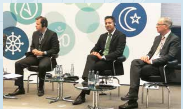
Abid Raja var blant deltakerne på IPP-konferansen i Berlin.