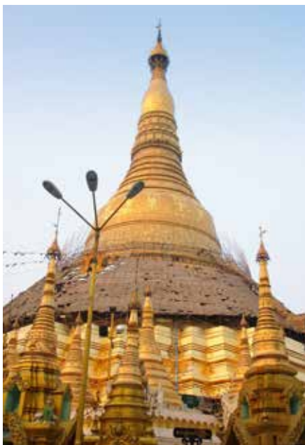
Myanmar er et land med en spennende historie.

Turen er et samarbeid mellom oss og Oslosenteret, og tidligere statsminister Kjell Magne Bondevik blir med på deler av den.