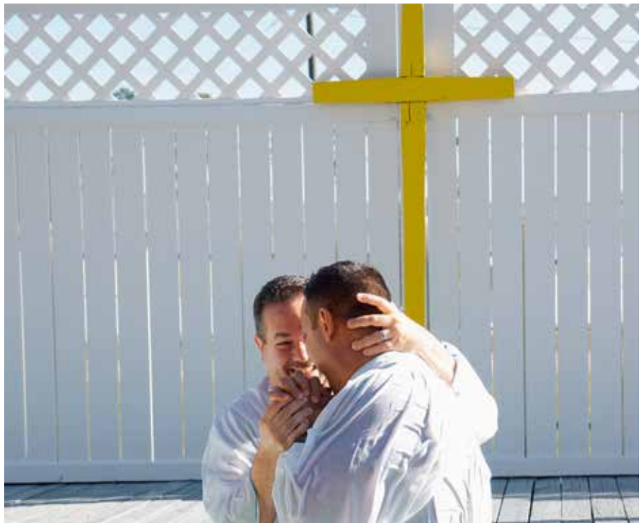
I mange land er det farlig å være åpen om at man døper seg eller har forlatt en tro til fordel for en annen. «Der det er farlig å skifte tro» er tema for årets fakkeltog og «Søndag for de forfulgte».

Konvertitter risikerer å få sine ekteskap annullert, å miste arveretten og å miste omsorgsretten for sine barn. De opplever ofte diskriminering innen utdanning, arbeidsliv, helsevesen, osv. I tillegg kommer diskriminering og trakassering fra det øvrige samfunnet, som familie, venner og naboer. I noen tilfeller tvinges konvertitten til rekonvertering – altså å gå tilbake til utgangspunktet. For noen konvertitter blir forfølgelsen så ille at de søker asyl i et annet land. Dessverre er det ikke uvanlig at mottakerlandet sår tvil om konverteringens ekthet og asylsøkerens egentlige tro. I noen tilfeller