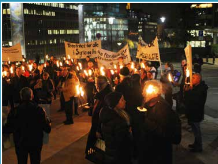
På fakkeltog.no kan du lese mer om årets fakkeltog. Her er et bilde fra fjorårets tog.

kan gjøre at vi hjelper hverandre til «ikke å falle i fristelse».