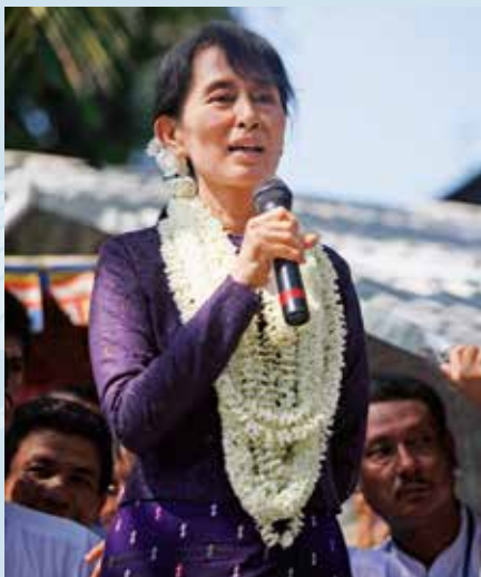
Aung San Suu Kyi har gjennomført en storstilt fredskonferanse i Myanmar.

NLD-regjeringen har tatt offentlig avstand fra den nasjonalist-buddhistiske Ma ba tha-bevegelsen, som kjemper for beskyttelsen av «rase og religion» i Myanmar, og som har bidratt til en økning av samfunnsfiendtlighet og hatefulle ytringer mot landets religiøse minoriteter, især rohingyamuslimene.