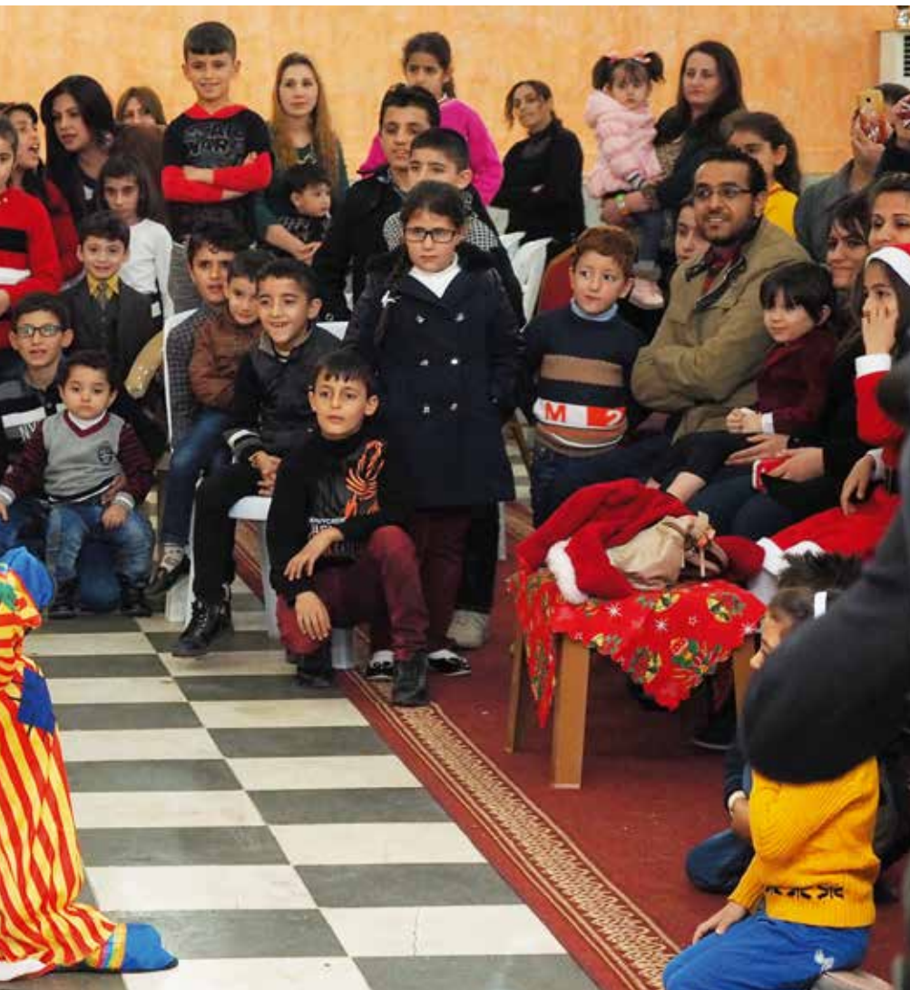
Klovner er ikke det vi i Norge vanligvis forbinder med jul, men de kan bidra til å lokke fram smil hos barn som ellers ikke har mye glede i hverdagen.

byen, og tok over husene, bilene og eie- dommene deres, forteller Maryam.