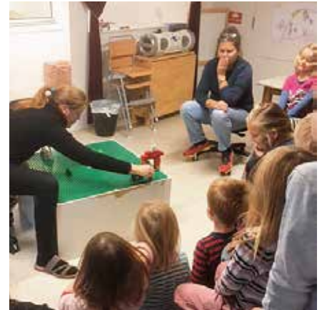
Det er en stor glede for oss i Stefanusalliansen å ha mange barnehager med på laget. Denne barnehagen har hatt stor glede av å høre om stefanusbarna i Egypt i høst.

Vi har tatt med oss stefanusbarnas motto «I can» inn i vår barnehagehverdag. For eksempel da vi var på tur på fjellet, og noen syntes det var vanskelig å komme seg opp. Da fikk vi tenke som stefanusbarna, og det hjalp. Jeg kan! Vi har laget en liten kunstutstilling i løpet av høsten, med tre forskjellige ting som foreldrene kunne kjøpe på stefanusdagen vår. Det var fint å tenke på at det vi laget og stilte ut, kunne bety liv og håp for et annet barn. Det er så godt å være med å hjelpe. For lyset er jo sterkere enn mørket. Kjærligheten overvinner hatet. Håpet er sterkere enn døden. Og vi i Bedehusbarnehagen i Blomsterdalen vil være med å håpe, ja kanskje til og med bære håp for noen som ikke kan håpe selv. Vi setter stor