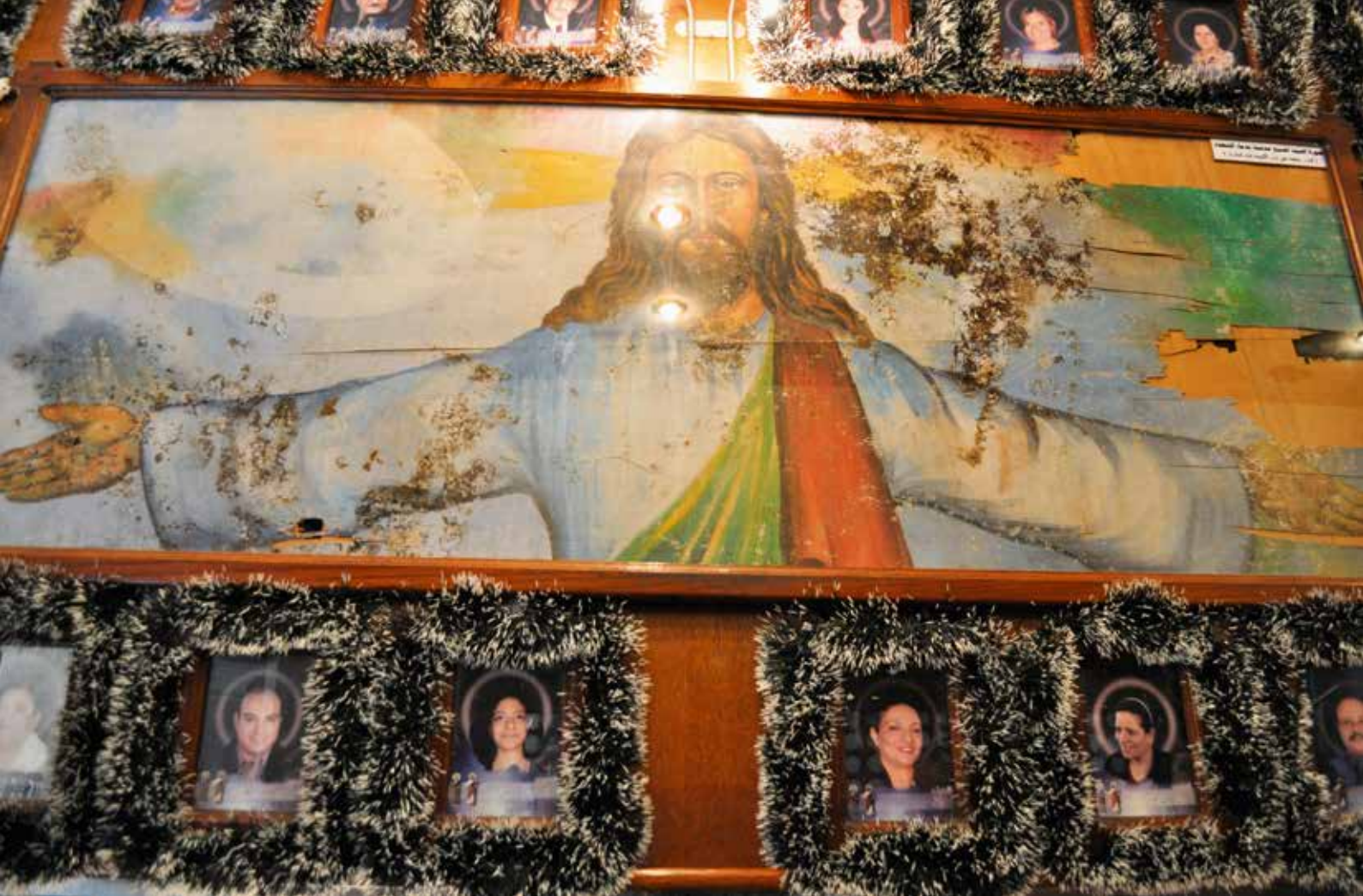
Man kan tydelig se blodet fra skadde og døde på dette bildet, som tidligere hang over inngangsporten til kirken. Bildet er i dag omkranset av bilder av de drepte i bombeangrepet.

– Selvfølgelig er det tungt, men vi kommer oss gjennom det. Min venn pleier å si at uten Gud hadde han enten tatt selvmord eller blitt gal.