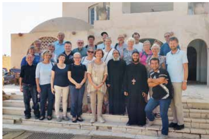
Vi har mye å lære av egyptiske kristne, skriver Erling Hillesund etter gruppeturen til Egypt.

(Skrevet av turleder og kateket i Landvik menighet, Erling Hillesund.)