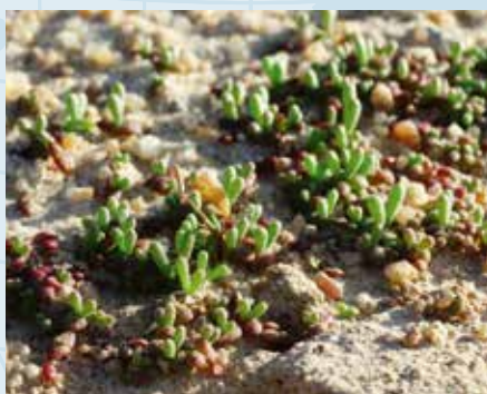
Vi etablerer nå et prosjekt i haugiansk ånd i Sahara, der et stykke ørken skal gjøres om til fruktbart land.

Forfulgte kristne har i dag det samme behovet for verdighet. I Øvre Egypt etablerer vi nå et prosjekt i haugiansk ånd.