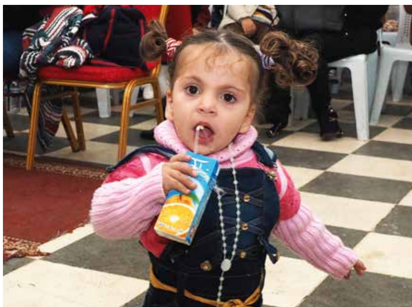
Alle barna får god mat og godteri, og selvsagt julegaver.