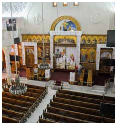
Al Qiddissin-kirken i Alexandria er et stort fellesskap, som blant annet driver to barnehager og et aldershjem. Her er hovedkirkesalen.

Over 4 000 av kirkens medlemmer var samlet til nyttårsaftensmesse for å be inn det nye året.