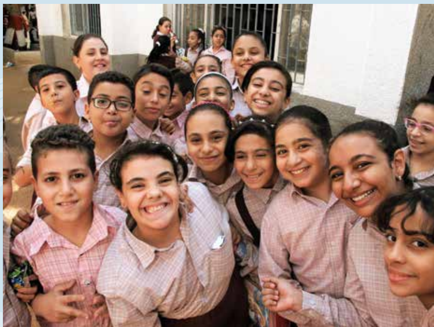
St. Mina skole i El Qussia i Egypt har i dag vel 1 000 elever. Skolen er en drøm som ble virkelighet, og det hele startet med bønn hver kveld.

rundt i skolebygningene. De to store byggene; datarom og bibliotek. Det er godt å kjenne på gleden hennes. Se stoltheten i øynene. Her får mange barn en ny sjans. Utdannelse er utro-