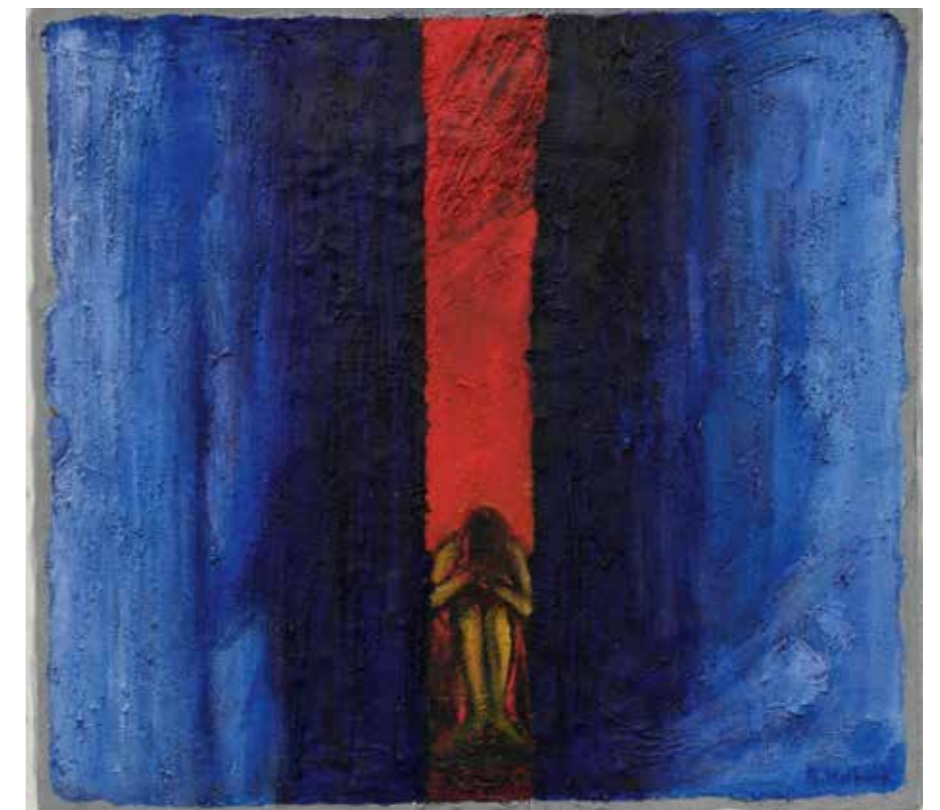
– Savnet av en «martyriets teologi» i vest er tydelig, skriver Peter Halldorf. (Maleri: Reidar Kolbrek)

En fordypet martyriets teologi er en av vår tids store utfordringer, både i formingen av en livsholdning bygget på evangeliet – og for kirkens enhet. De fleste kirker godkjenner hverandres dåp og hverandres martyrer. Det burde innebære at kirkens synlige enhet er innen rekkevidde. Bortom all splittelse finnes en enhet i Kristus, en enhet som en dag skal bli synlig. Martyrene er tegnet.