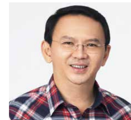
– Sett Akhok fri, appellerer FN til Indonesias regjering.