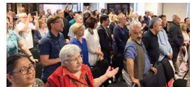
Det nye kirkebygget i Antalya var fullsatt under åpningen.

Det var tale av menighetens pastor, Ramazan. Han formidlet budskapet om Jesus som frelser, og han var tydelig på at Antalya Evangelical Church sin målsetting er å