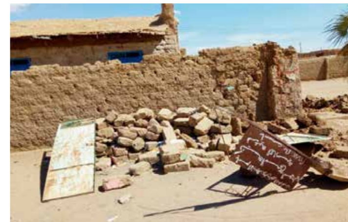
Den ødelagte kirken i Algardisia-distriktet i Khartoum hadde vært der siden 1983.