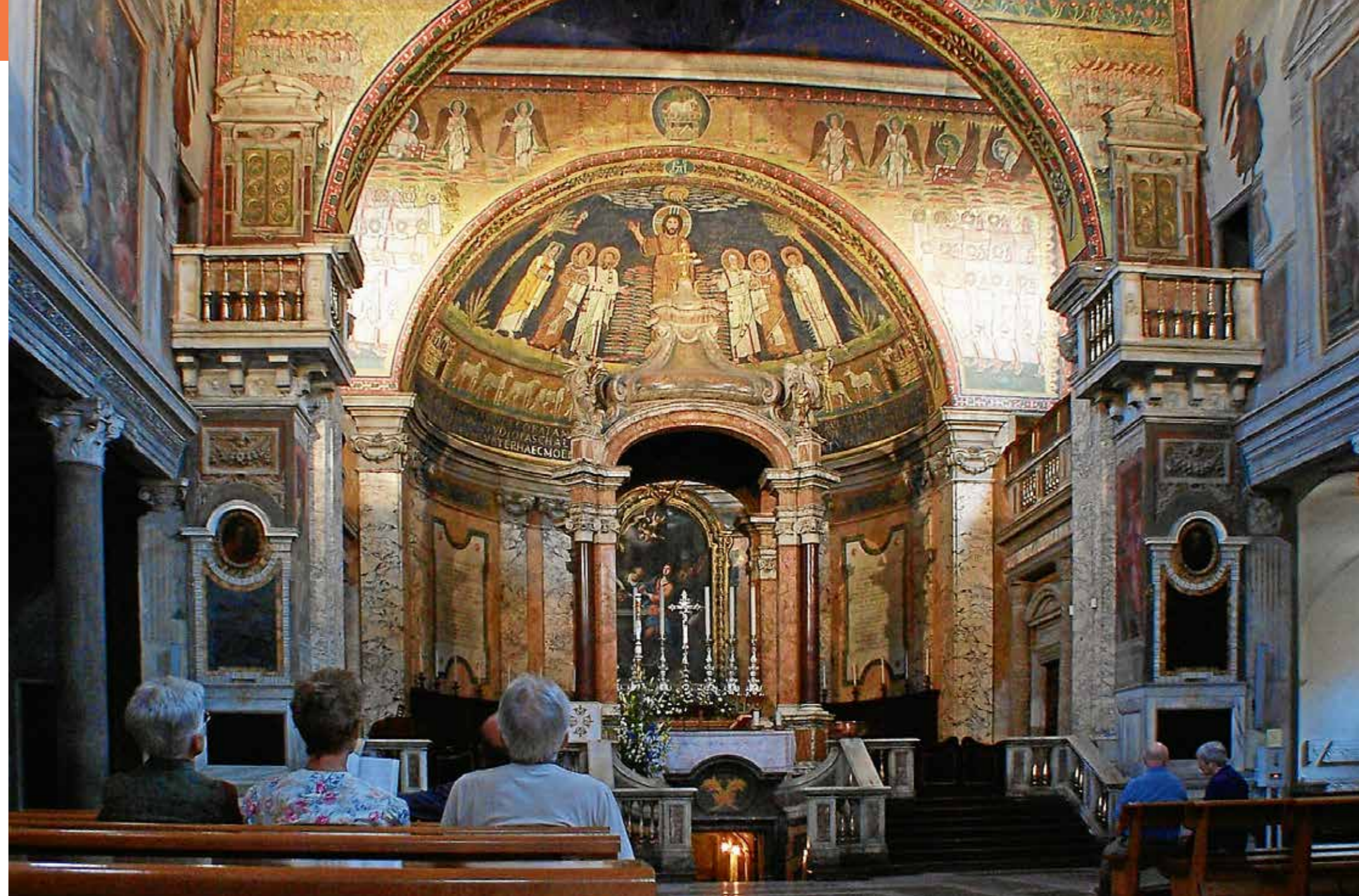
I basilikaen Santa Prassede i Roma er det et vell av veggmalier, noen av dem viser martyriet.

Historien om den kristne kirke er helt fra starten fortellingen om kirkens vitner. Ordet kommer fra det greske ordet martyrein : noen som ser noe og forteller det til andre; noen som har fått sine øyne åpnet og ikke kan tie