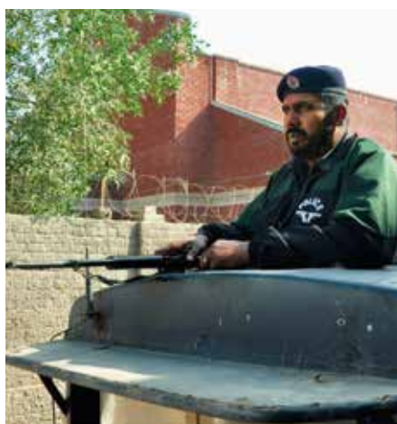
Pakistanske sikkerhetsstyrker bidrar i beskyttelsen av kirker i Youhanabad.

vold med vold. Likevel førte hendelsen til at myndigheter, media og politiet presenterte kristne som mordere og voldelige. Uskyldige ble hentet fra hjemmene sine og ble mishandlet i varetekt. Mer enn 130 ble arrestert. I frykt forlot nesten halvparten av husstandene i Youhanabad midlertidig