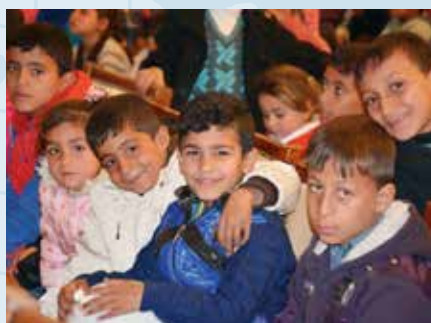
900 barn fikk glede av julefesten.