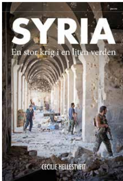
I boka Syria – En stor krig i en liten verden (Pax forlag) forklarar Cecilie Hellestveit kampen i og om Syria.

I Irak har talet på kristne gått ned frå 1,5 millionar i 2003 til 350.000 i 2012, før IS erklærte kalifatet, og ytterlegare ned etter det. – Dei kristne i Irak har klart seg under skiftande, harde regime. Men det som no skjer, ser ut til å ta knekken på den kristne minoriteten. Store skarar med kristne flykta først frå Irak til Syria. Men så opplevde dei at både sjiamuslimsk