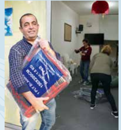
Varmeovnene og teppene var velkomne blant flyktningene i Beirut.