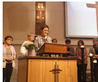
I år samlet Stefanusforeningen på Fitjar inn 67.000 kroner til arbeidet for trosfrihet.