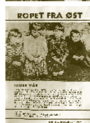
Ropet fra Øst – som bladet het fra 1971 til 2011, her er forside på utgave 3/1971.