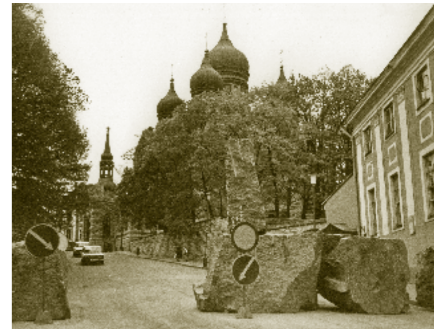
Jernteppet var ikke borte i Baltikum vinteren 1991. I gamlebyen i Tallinn var det satt opp barrikader mot sovjetiske stridsvogner som rullet skremmende rundt i gatene.