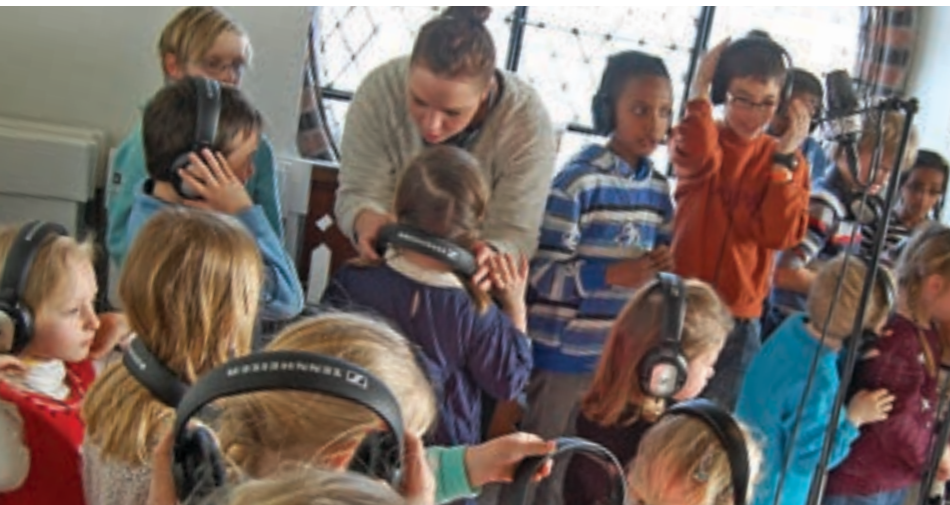
I tårnet i Skien kirke ble det spilt inn CD som sendes alle andreklassingene som sokner til Skien kirke.