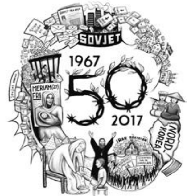
Tegning: Söllim Sæle

Sett sammen med dilemmaene og gråsonene kristne levde under bak Jernteppet, ble den norske debatten svart-hvitt. I intervjuer i Magasinet Stefanus tidligere i år