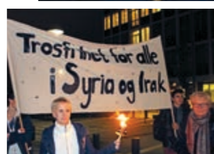
Fakkeltog i Oslo i november 2015.