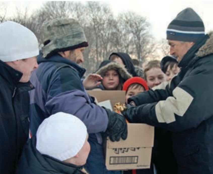
Artikkelforfatteren (til høyre) har holdt god kontakt med venner og en menighet i Estland. Her deltar han under matutdeling i regi av den lutherske Peetelimenigheten i Tallinn i 2015.

← bursdagsselskaper og skogturer. Menigheten hadde i 1991 mange unge familier – det var frukten av barnearbeidet gjennom de mørke årene.