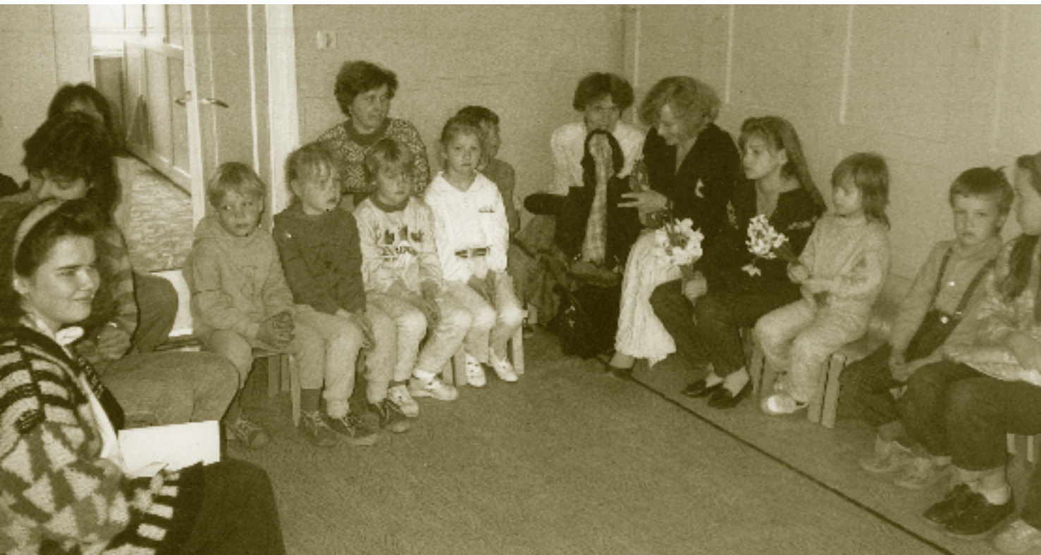
Da det ble lov å drive barnarbeid, eksploderte oppslutningen om søndagsskolen i baptistmenigheten i Viljandi. Her fra artikkelforfatterens besøk vinteren 1991.