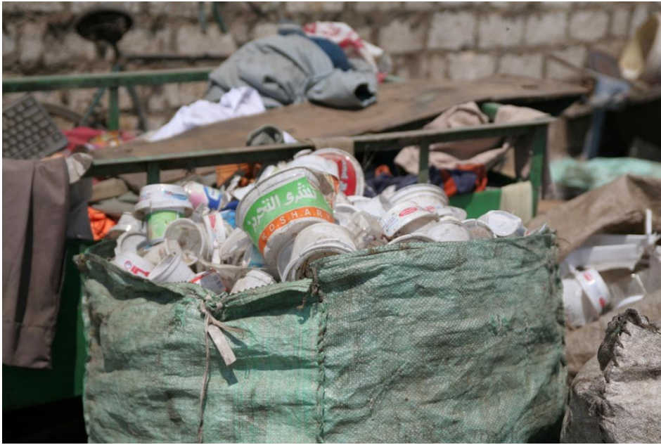
Bilde 12 Plast for seg,