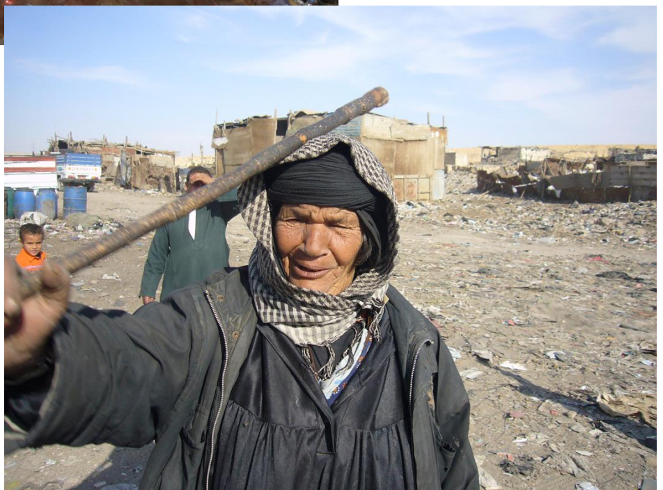
Bilde 14 Mange av dem vi møtte i byen så stygt på oss og ropte stygge ting til oss fordi vi arbeidet med å samle søppel.