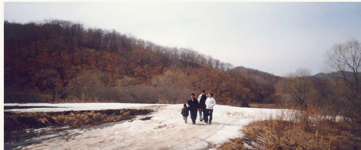
En gruppe nordkoreanske flyktninger i Kina som fikk hjelp til å komme seg i trygghet i et annet land. Ikke den samme gruppen som omtales i teksten.