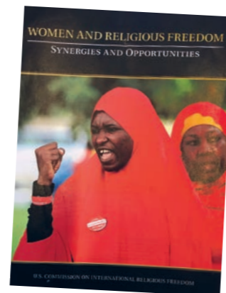
Rapporten om korleis trusfridom kan brukast til å forsvare kvinners rettar, vekte stor interesse.

– Trusfridommen vernar ikkje ein religion – tradisjonar, verdiar, identitetar eller dogme. Trusfridommen skal