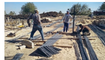
Endelig kan de bygge ny kirke.

I landsbyen Kom El-Loufy, 250 kilometer sør for Kairo, har arbeidet med å bygge ny kirke startet. Den forrige kirken ble stengt for 12 år siden. I juli 2016 ble fire koptiske hus satt fyr på fordi ekstreme muslimer mistenkte at det var planer om å gjøre dem om til kirker. Nå har kirken droppet anmeldelsen og fått en avtale med lokale muslimer som sikrer bygging av ny kirke. worldwatchmonitor.org, 29. desember og 9. januar