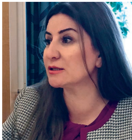
Vian Dakhil i Stortinget i mai.

– 6 900 kvinner og jenter ble kidnappet. Myndighetene hjalp oss å opprette et kontor som har bidratt til å betale ut omtrent 3 700 jenter. Men fremdeles er over 3 000 savnet. Vi vet ingenting. Kontoret hjelper oss