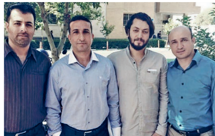
Disse fire konvertittene har nylig fått stadfestet lange fengselsstraffer.