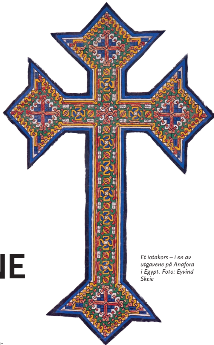
Et iotakorset – i en av utgavene på Anafora i Egypt.

Du kan laste ned vårt opplegg Mal og mediter fra våre nettsider www.stefanus.no Du finner det under For-menigheten/konfirmanter-og-ungdomsgrupper/