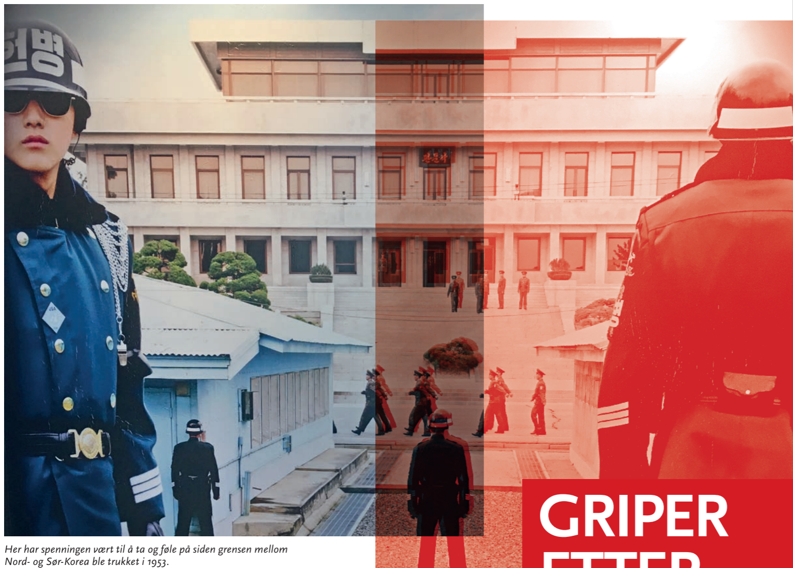
Her har spenningen vært til å ta og føle på siden grensen mellom Nord- og Sør-Korea ble trukket i 1953.