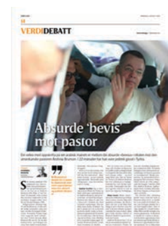
Andrew Brunson – i storpolitisk kamp.