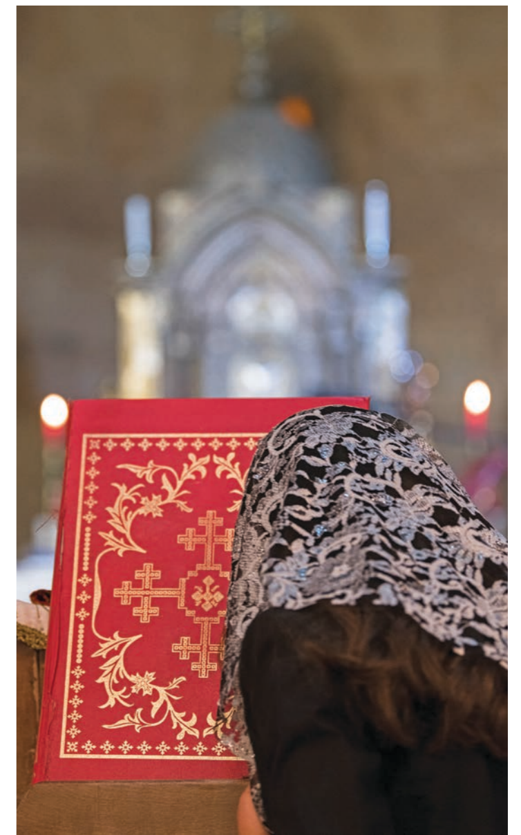
En syrisk-ortodoks kvinne i Mardin i Øst-Tyrkia kysser Bibelen første påskedag.

Utenpå var han den sterke presten, som måtte tro på vegne av folket sitt. Men på innsiden? En dag overhørte sønnen bønnene hans. Faren ba til sin Gud, og trodde at ingen hørte ham, men sønnen lyttet og skulle aldri glemme det han hørte: «Jesus, du ble korsfestet én gang, mens vi blir korsfestet igjen og igjen.»