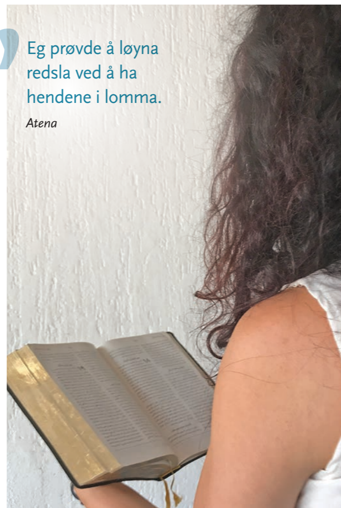
Atena ser det som Guds leiing at ho ikkje var der då politiet slo til.

» Eg kan ikkje forneakta trua på Kristus