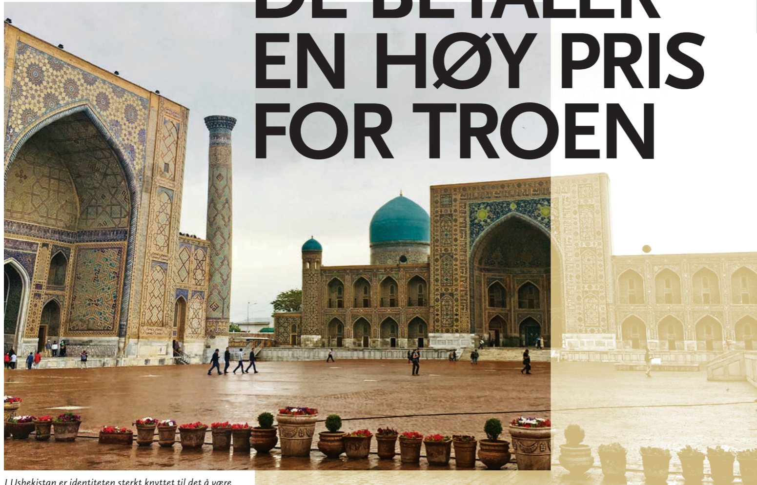
I Usbekistan er identiteten sterkt knyttet til det å være muslim. Rundt Registan-plassen i Samarkand ligger tre gamle og kjente koranskoler (madrassaer).

Kristne i Usbekistan opplever at bevæpnet politi stormer deres hjem på jakt etter forbudte bøker om tro.