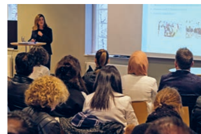
Det var fullt hus på HL-senteret under seminar om overgrepene mot jesidier.

Fredsprisen til Denis Mukwege og Nadia Murad skjerpet vår bevissthet om grusomme overgrep mot kvinner i krig og konflikt. Overgrepene mot jesidikvinner og kristne kvinner i Irak fikk bred plass i offentligheten, blant annet med seminar på HL-senteret i Oslo i forkant av utdelingen av Fredsprisen. Stefanusalliansen, Norsk Folkehjelp, Kirkens Nødhjelp og Human-Etisk Forbund stilte seg bak en serie krav om rettferdighet for jesidiene.