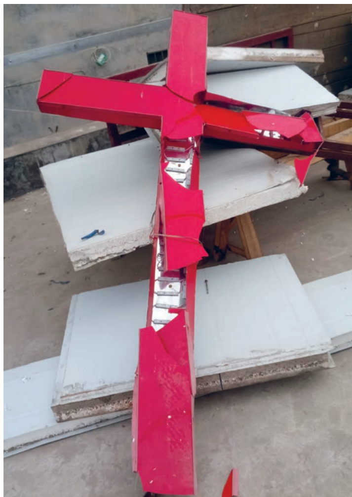
Kyrkja i landsbyen Jiabu har fått krossen riven ned.

Dette melder Bitter Winter. Det anerkjende magasinet for trusfridom og menneskerettar i Kina viser til kjelder i den aktuelle kyrkja.