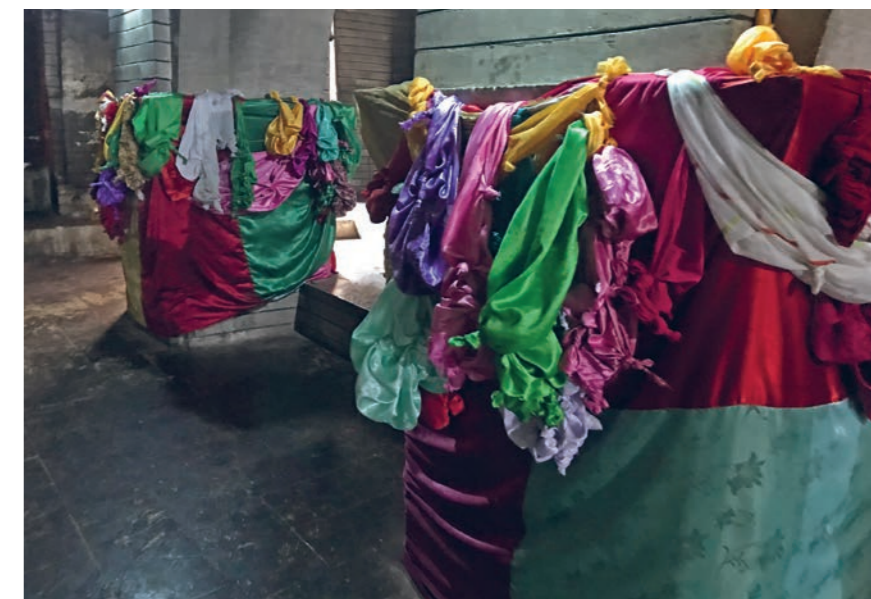
Fra helligdommen i Lalesh.

Men forsoning er ikke mulig uten rettferdighet. De ansvarlige for folkemordet på jesidiene og forfølgelsen av andre grupper må stilles til ansvar. Overgrep må dokumenteres, og de som fortsatt er savnet, må finnes. Her har verdenssamfunnet et ansvar for å bidra. Ellers lykkes IS med sitt mål: Å utrydde jesidiene som religiøs og kulturell gruppe.