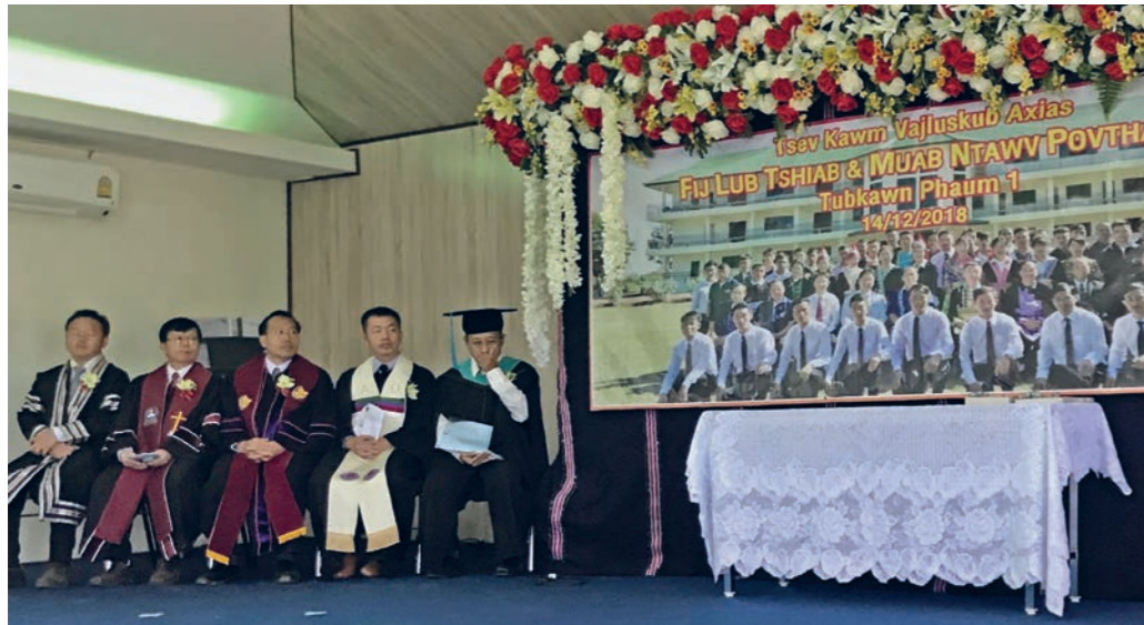
Hmong Ministry startet undervisning for tre år siden i provisoriske lokaler. Under åpningen av nybygget ble festen ekstra stor da det første kullet samtidig fikk sine vitnemål. Til venstre lærerne. Studentene er avbildet i det fremviste bildet.