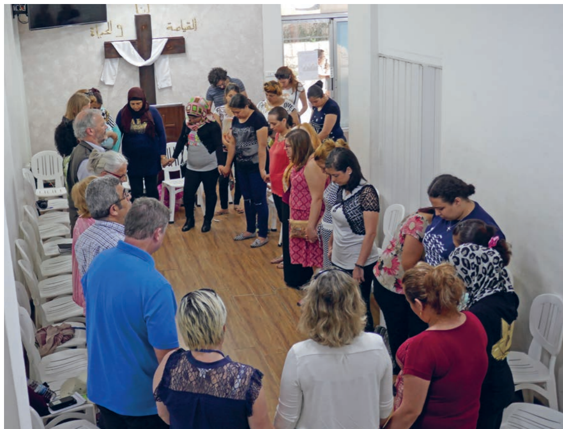
Flyktninger som har funnet kristen tro i Beirut, møtes til bibelgruppe i Resurrection Church Beirut.