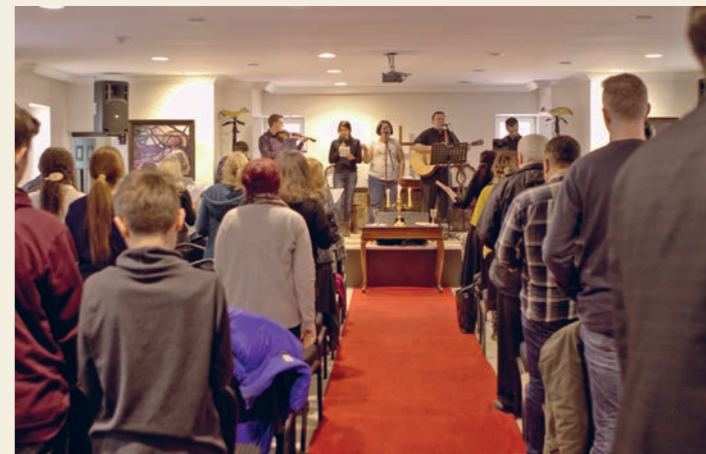
Gudstjeneste i den nye kirken i Antalya i Tyrkia, finansiert med gaver fra Stefanusalliansens støttespillere. Slike prosjekter dekkes ikke av UD-midler.

Samtidig er vi glade for å se at våre støttespillere rundt i Norge har forstått at UD-midlene slett ikke minsker behovet for innsamlende gaver, men bidrar til at vi