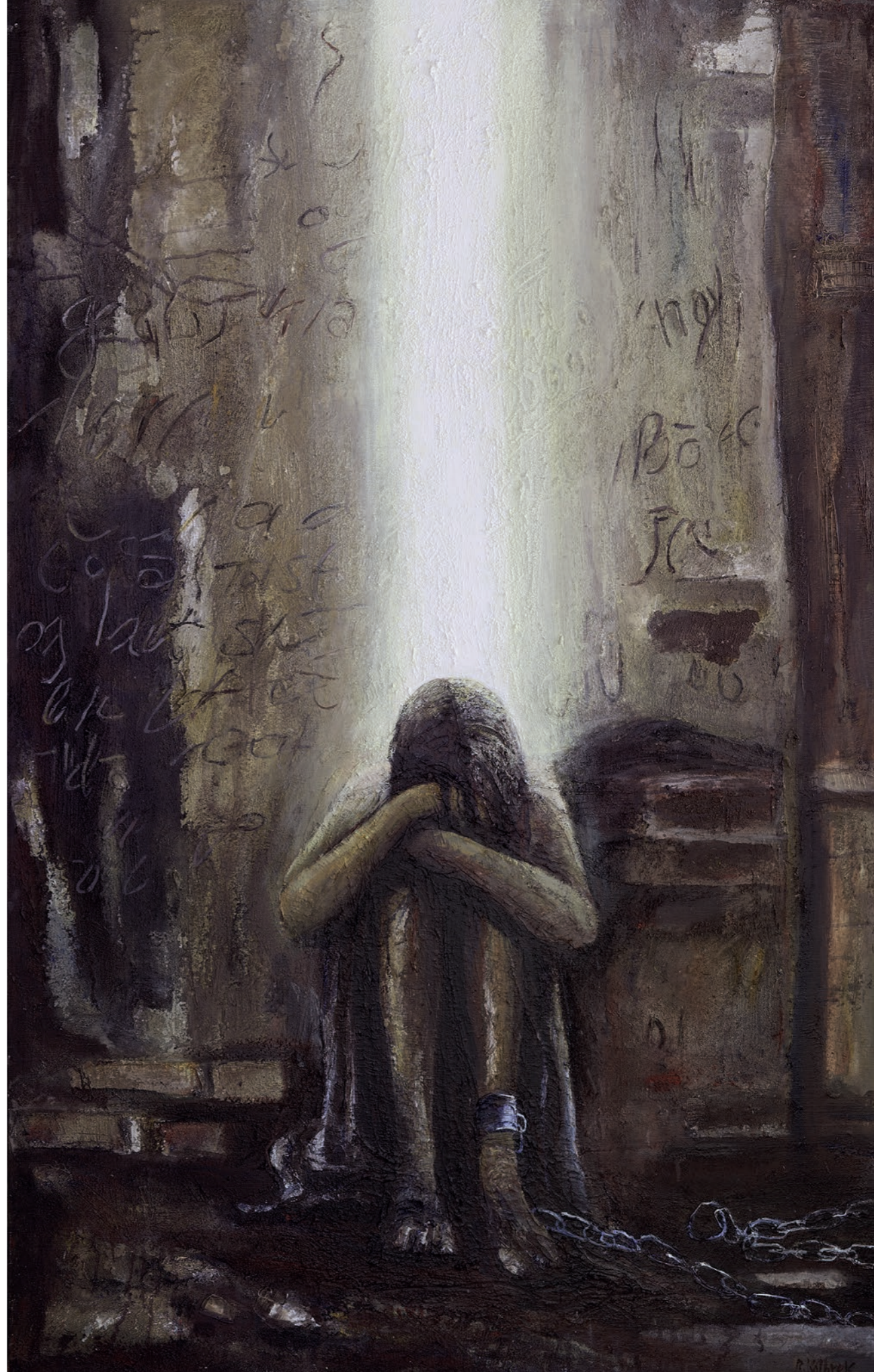
«Han har fridd oss ut av mørkets makt.» Maleri: Reidar Kolbrek.