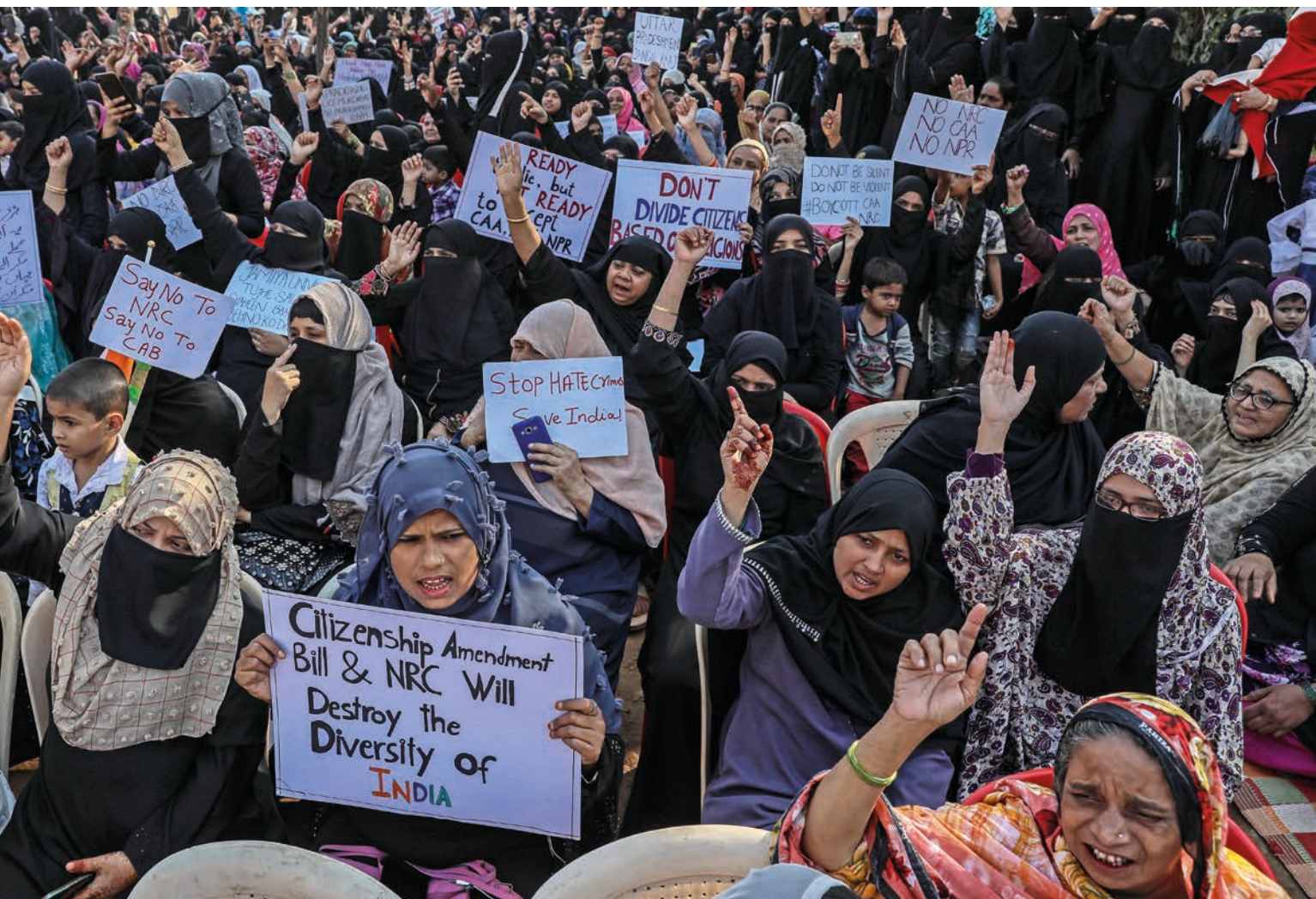
Indiske muslimer protesterer mot den nye statsborgerloven, i Mumbai, 18. januar. Loven truer det indiske mangfoldet, sier de.