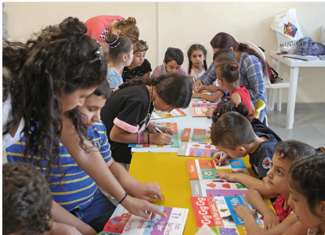
Baptistkyrkjelyden Resurrection Church Beirut starta tidleg aktivt hjelpearbeid for syriske flyktningar. Stefanusalliansen støttar eit prosjekt der barn får hjelp til å koma i gang med skulegang.

– Eg kan forstå frykta som kristne har. Men denne haldninga bryt med kristne verdier om å tena dei fattige og at menneskeverdet er for alle.