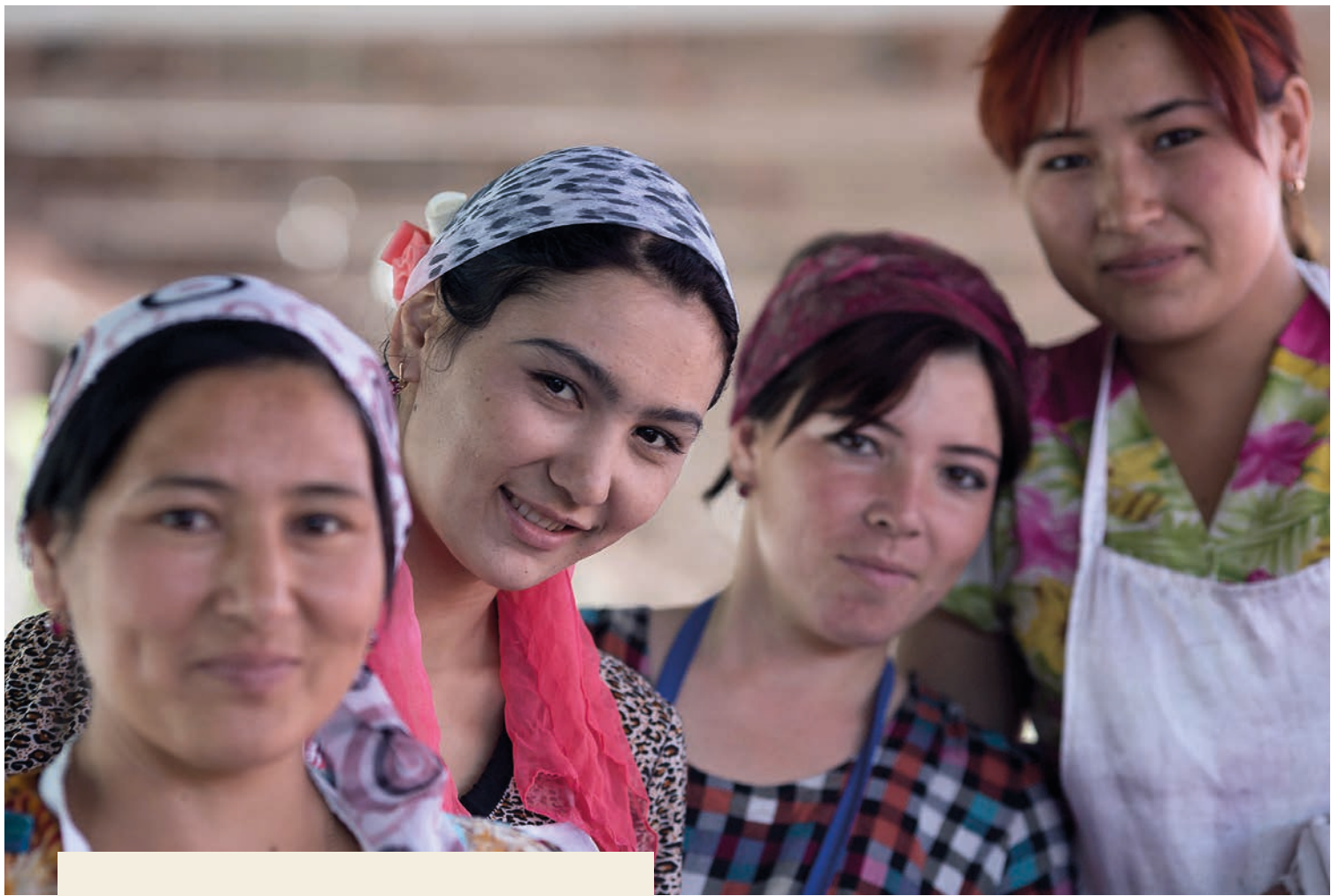
Illustrasjonsbilde: Kvinner fra Sentral-Asia. På grunn av sikkerheten kan vi ikke bruke navn* eller vise identiteten til intervjuobjektene. Creative commons.

«De som ønsker et enkelt liv i Sentral-Asia, må ikke gifte seg med en pastor.»