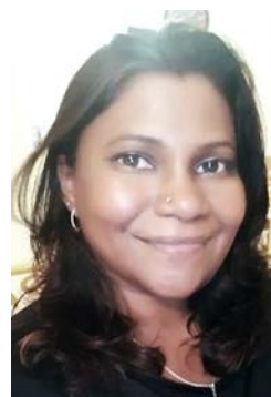
Kasthuri Patto, trakassert katolsk politiker.

Samtidig melder progressive muslimer og moderate krefter seg mer på. Religiøse og politiske ledere, akademikere og aktivister som ønsker pluralisme og likestilling, utfordrer konservativ islam. Kanskje lover dette godt for trosfriheten og Malaysia?