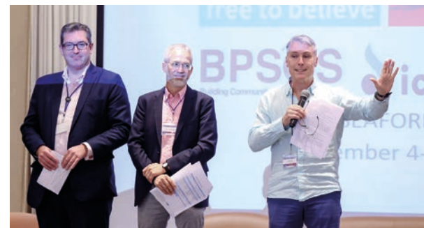
Generalsekretær Ed Brown (til høyre) på SEAFORB.

Sørøst-Asia huser et stort mangfold av etniske og religiøse grupper. I flere land er trosfrihetsutfordringene fremtredende. Vietnam forbyr religiøs virksomhet som ikke er forhåndsgodkjent av staten. Myanmar anklages for folkemord og diskriminering av muslimske og kristne grupper. I Malaysia og Indonesia er islamistiske grupper på fremmarsj.