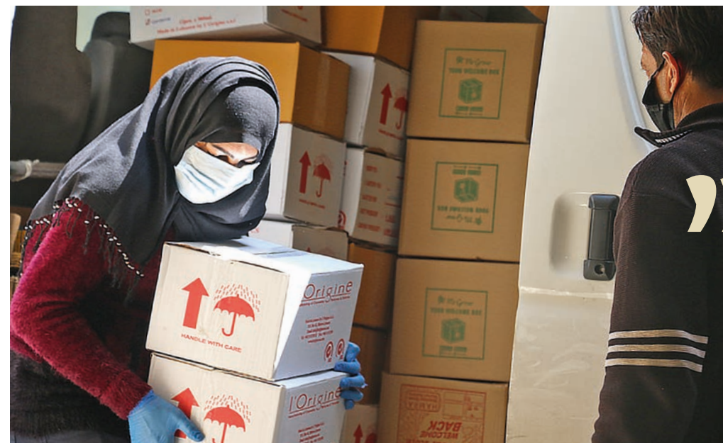
Meraths hjelpere deler ut mat og smittevern.

Følg utviklingen i Iran på våre nettsider: www.stefanus.no