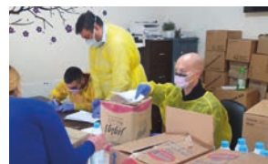
Matutdeling til flyktninger fra Resurrection Church Beirut

Men mens kirken er stengt har menigheten holdt helseklinikken for flyktninger åpen, og fortsatt med matutdelingen til syriske og irakiske flyktninger. Stefanusalliansen støtter menighetens skoleprosjekt for flyktningbarn fra Syria og Irak. Skoletilbudet er for tiden stengt på grunn av koronakrisen. Men lærerne forsøker å følge opp barn direkte og digitalt.