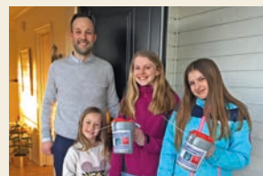
Konfirmanter har gått med bøsse tidligere år, her fra 2018.