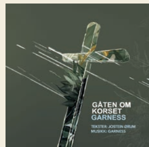
Albumcoveret til «Gåten om korset»

I mellomtiden kan du lytte til hele «Gåten om korset» på Spotify, Apple Music og Tidal. I tillegg finner du videoer med flere av sangene, samt refleksjoner fra Jostein Ørum, på våre nettsider: www.stefanus.no