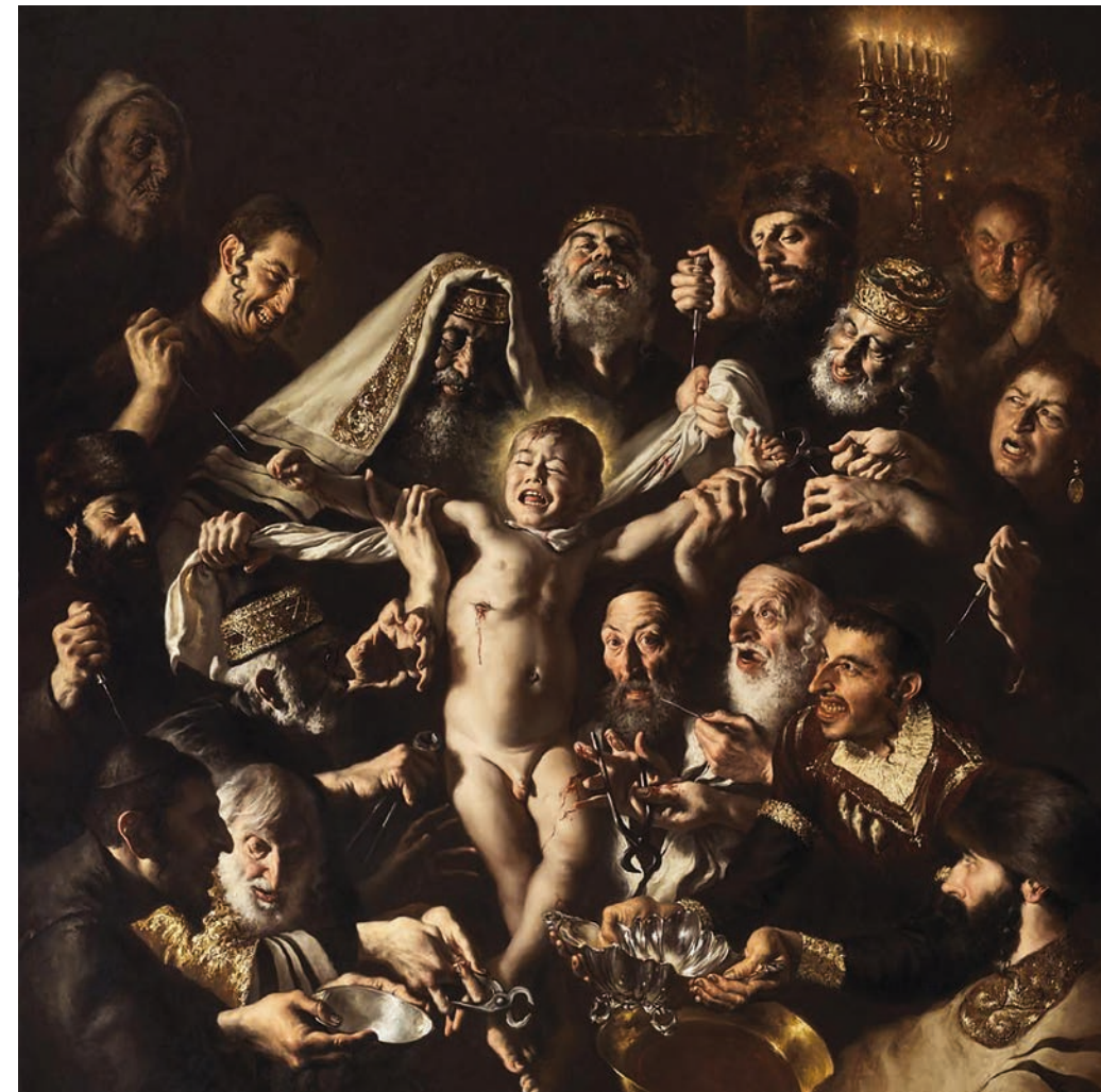
Giovanni Gasparros nymalte bilde av flirende jøder som med blodstenkte fingre kveler en gutt mens de tapper blod, vekker avsky – og glede.

Kommentarene på sosiale medier viser både avsky og glede over Gasparro sitt bilde. En i kommentarfeltet