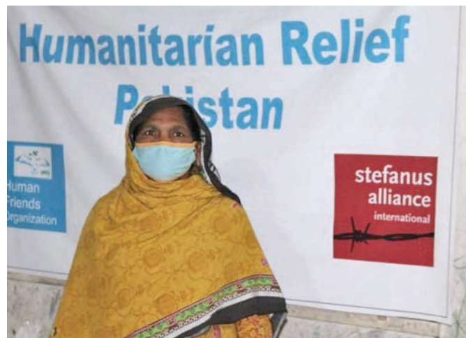
250 familiar har fått utdelt mat for en måned gjennom påsken, 200 av dei med midlar frå Stefanusalliansen.

familiane trygge og friske. Mathjelp må ikkje nektast på grunn av tru. Vi ber den pakistanske regjeringa syta for at mat blir delt likt med hinduar, kristne og menneske frå andre religionar, heiter det frå USCIRF.