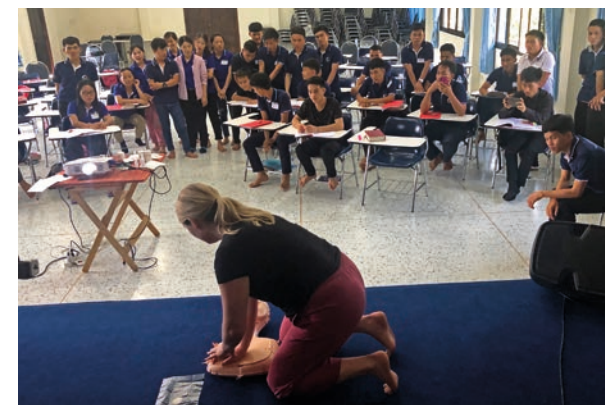
En lydhør klasse fulgte undervisningen til de norske sykepleierne.

– Før dere kom, kunne vi ingenting om dette. Nå føler vi at vi vet litt mer om hva som skjer i ulike situasjoner. Dette kan vi ta med oss videre til landsbyene våre, sa de.