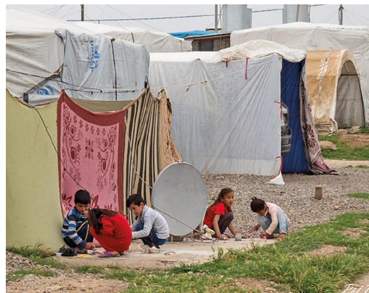
Tusenvis av jesidiar bur i flyktningleirar i Nord-Irak. Framtida til jesidiane og dei kristne i Irak er endå meir uviss på grunn av koronakrisa.

Økonomisk er det full krise. 90 prosent av Iraks inntekter er frå oljen – og oljeprisen har falle som ein stein. I eit halvt år har landet streva med å få på plass ei ny regjering. Det er usikkert kva som kjem etter at ei ny regjering er på plass.