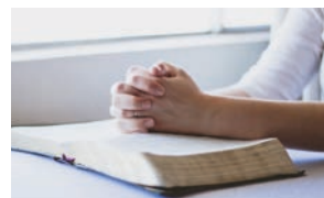
Nå er det bønnetimer på nettet i Kairo.

– Vi står sammen med dere og med kirken over hele verden i vissheten om at Herrens ære vil dekke jorden akkurat som vannene dekker havet. La Herren velsigne deg og holde deg trygg, heter det fra Kasr El Dobra.