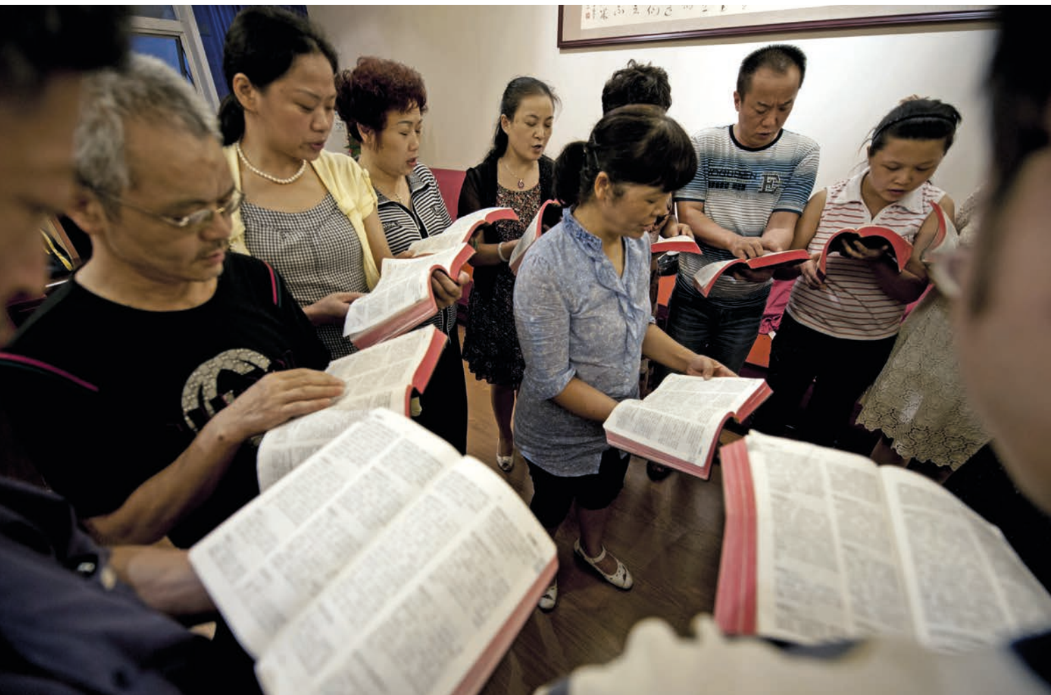
Kinesiske kristne set svært stor pris på Bibelen.

– Kristne i og utanfor Kina må saman visa korleis vi held fast på sanninga og fortel sanninga.