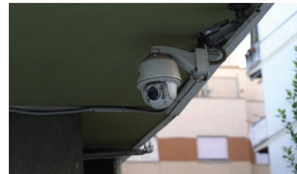
Overvåking i kinesisk kirke.