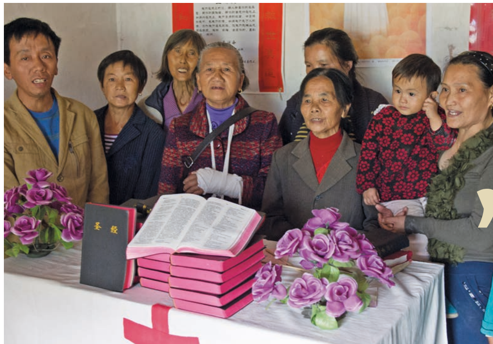
Kinesiske kristne kaster seg over Bibelen.

Noen eksperter mener å observere at regjeringen er mest fokusert på provinser med et stort antall kristne.