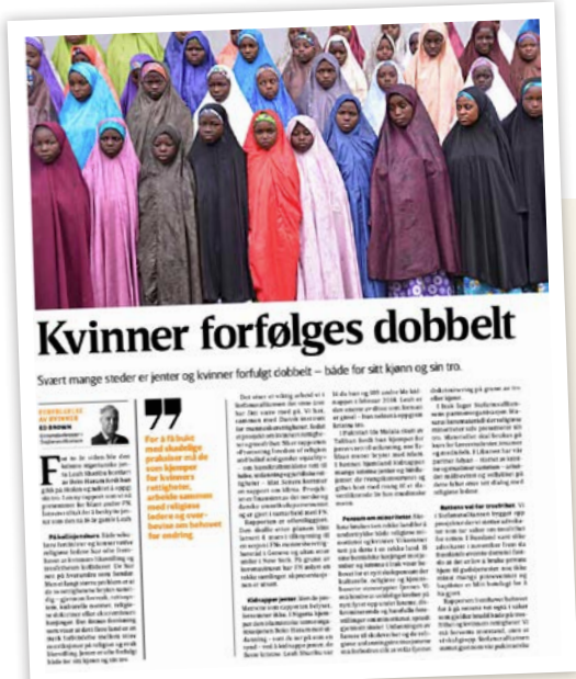
Kronikk om kvinner og trosfrihet i Vårt Land mars 2020.

Et dusin kronikker og innlegg var fra midten av mars og til utgangen av april publisert i kristne dagsaviser, organisasjonsblad, nasjonale aviser og regionaviser. Synligheten øker også forhåpentligvis engasjementet hos våre støttespillere. Samlet har Stefanusalliansen fått publisert nær 30 tekster i ulike medier de fire første månedene i 2020.