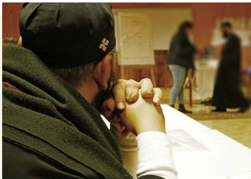
En ortodoks prest fra en menighet i Egypt er med på drømmen om trosfrihet. Fra workshop i januar 2020.

” Det er ventelister for å være med på kurset.