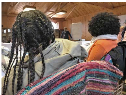
Kirkefolk fra helt ulike bakgrunn i Egypt snakket seg sammen i drømmen om trosfrihet.

Tidlig i 2020 inngikk vi, etter tett kontakt i 2019, avtale med den libanesiske organisasjonen Adyan som har prosjekter for mangfold og borgerrettigheter i flere land i Midt-østen. Organisasjonen er startet av en maronittisk prest og en kvinnelig muslimsk teolog. Kursmateriellet fra vår nettbaserte plattform skal være oversatt til arabisk i løpet av 2020 til bruk i Midtøsten.