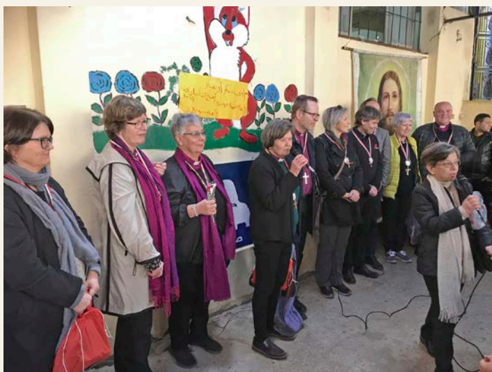
Bispemøtet i Den norske kirke hos Stefanusbarna i Kairo.