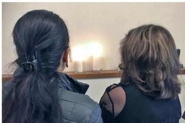
To av deltakerne på kvinnekonferansen i Sentral-Asia i 2019.

Gjennom et samarbeid med Dansk Institutt for Menneskerettigheter og med finansiering fra norsk og dansk UD, har vi i 2019 arrangert globale ekspertkonsultasjoner om kjønn, trosfrihet og fire av FNs bærekraftsmål: Helse, utdanning, klima og rettshjelp. En rapport med innspill gis til FNs spesialrapportør for trosfrihet, andre FN-organer, nasjonalstater, EU og ulike organisasjoner. Et eget møte med presentasjon av rapporten i forbindelse med en sesjon i FNs menneskerettighetsråd i Genève i mars 2020, ble avlyst på grunn av koronatrusselen. Stefanusalliansen vil arbeide