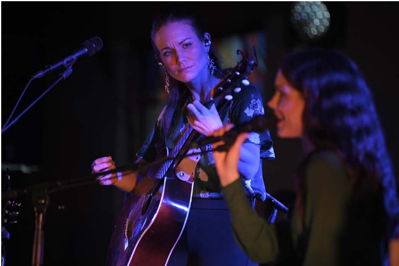
Duoen Garness fremførte «Gåten om korset» – med tekster av prest og forfatter Jostein Ørum.