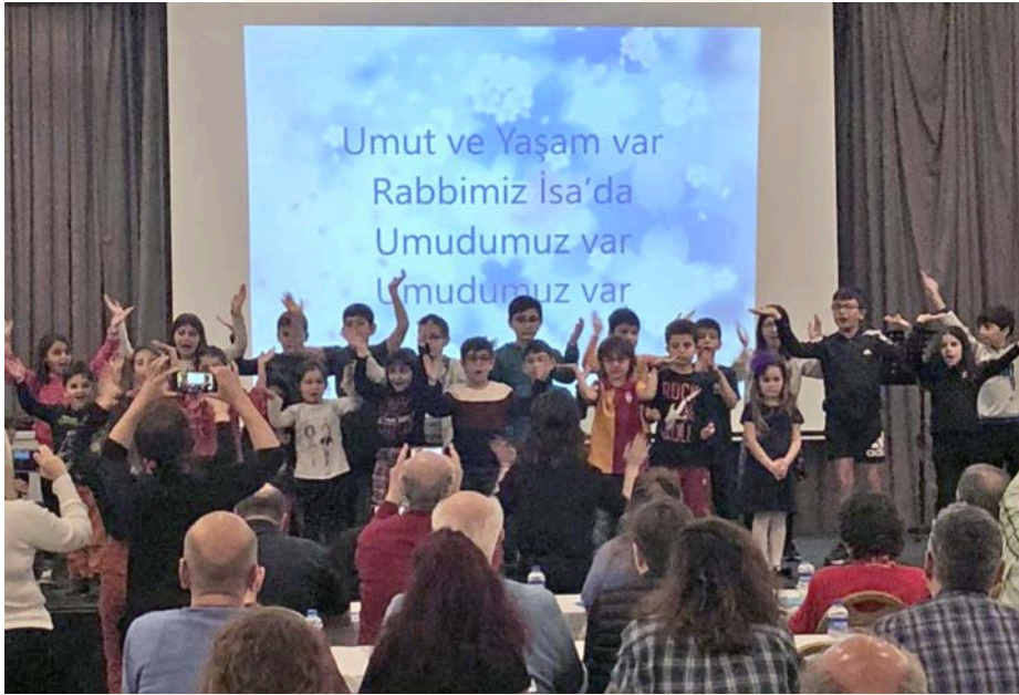
Den protestantiske alliansen samler pastorer og deres familier til sin årlige konferanse.