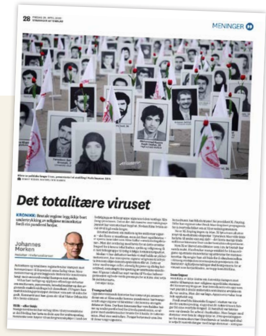
Kronikk i Stavanger Aftenblad april 2020.