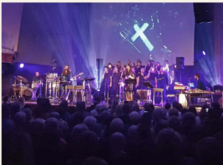
«Gåten om korset» fikk overveldende respons.