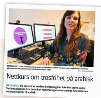
Vårt Land 9.3.2020

Det er også gjennomført fysiske kurs i trosfrihet i flere land, blant annet et opplegg med flere workshops over et drøyt år for en gruppe ortodokse, katolske og protestantiske prester, pastorer og medierepresentanter i Egypt. Avtalen med partneren videreføres for å støtte kursdeltakerne når de skal følge opp kurset med lokale og konkrete initiativ for å fremme trosfrihet i sine sammenhenger. Vi støtter også partneren med noe midler for å bygge opp administrativ kapasitet.