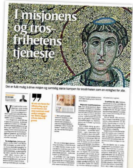
Stefanusalliansens kronikk om misjon og trosfrihet i Vårt Land 18. juni 2019.

Vårt årelange arbeid for å fremme trosfrihet som sak overfor ulike miljøer, politiske partier på Stortinget og embetsverket i Utenriksdepartementet har gitt oss bredt nettverk. Men det er behov for å fornye arbeidet opp mot politiske partier både i dagens regjering og partiene som nå sitter i opposisjon. I 2019 gjennomførte vi kurs i politisk påvirkning med ekstern kursholder. Det arbeides fra starten av 2020 blant annet med innspill til partiers arbeid med valgprogram.