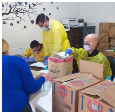
Da vår samarbeidsmenighet Resurrection Church Beirut (RCB) måtte stenge kirken, holdt de matutdelingen og helseklinikken åpen.

Vi arbeidet i 2019 med ny IT-plattform og ny IT-leverandør. Da koronakrisen kom, var vi teknologisk rustet for hjemmekontor med videomøter ved at vi allerede hadde gått over til Office 365 som blant annet inneholder Teams. I kontakt med partnere ute har vi lenge aktivt brukt andre digitale kommunikasjonsplattformer, og bruken øker.