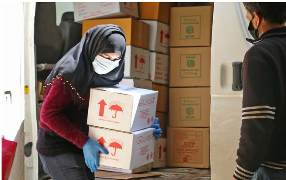
Den libanesiske organisasjonen Merath deler ut mat og hjelpemidler for å hindre smitte.

Som kristne er vi kalt til enhet i Kristus, på tvers av grenser. Det må vi framheve ekstra tydelig i en tid hvor grenser er blitt stengt og det er lett å tenke at vi har mer enn nok med oss selv. I denne tiden kjenner mennesker globalt på uro for fremtiden. Vi er ikke unntatt. Da må vi sterkt holde opp fellesskapet med dem som lever i uro for fremtiden helt uavhengig av en pandemi. Vi har mye å lære av dem.