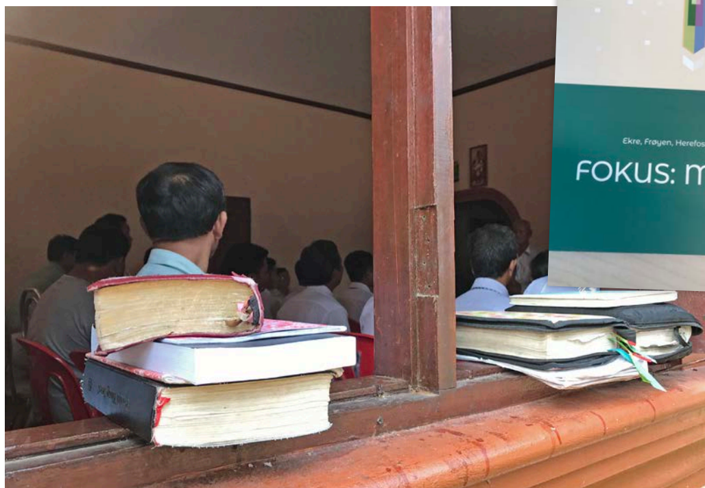
Bibelskole i Laos.

” Han fortalte om sine til sammen syv år i fengsel