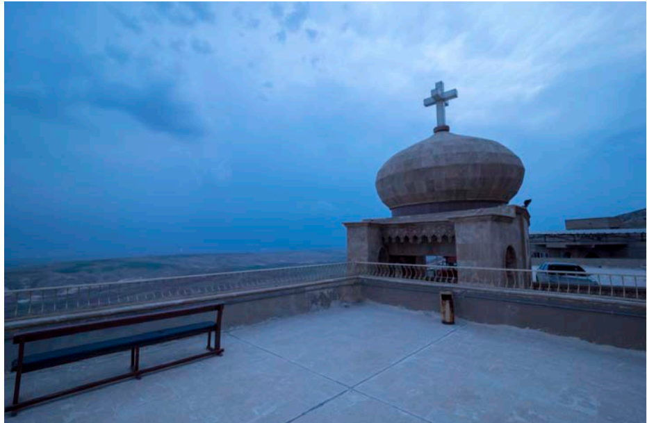
Klosteret Mar Mattai i Nord-Irak har stått der siden 300-tallet.

Trosfriheten er under press i store og folkerike land. Samtidig politiseres kampen for trosfriheten av flere vestlige land, noe som kan sette kampen i miskreditt.