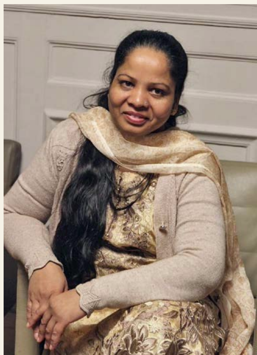
Asia Bibi endelig fri i Pakistan.