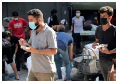
Frivillige fra Merath distribuerer mathjelp.