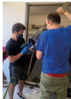
Frivillige fra Resurrection Church reparerer et hjem.