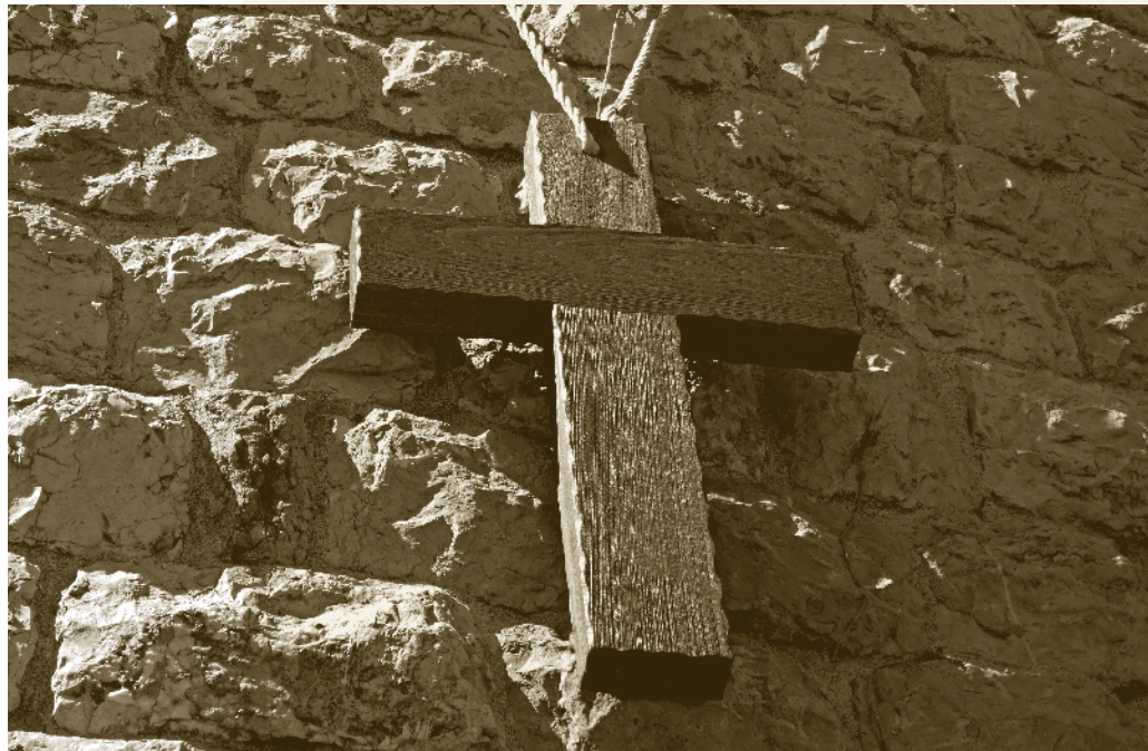
Et kors på en maronittisk kirke i landsbyen Harissa nord for Beirut i Libanon.