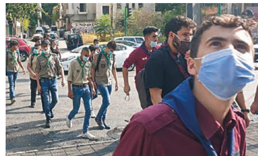
Unge fra et Adyan-prosjekt på ryddejobb.

Hjelpeorganisasjonen Merath som arbeider gjennom lokale kirker både i Libanon og Syria, har delt ut flere tusen varme måltider til hjemløse i Beirut. De har sørget for vann, matpakker, madrasser og laken, hygieneartikler og vernemasker. De gir 200 familier en kupong tilsvarende cirka 1000 kroner som kan brukes til å kjøpe det de trenger.