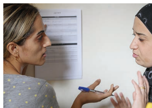
En krigsflyktning fra Syria (t.h.) får hjelp av Resurrection Church Beirut (RCB) med et skjema.