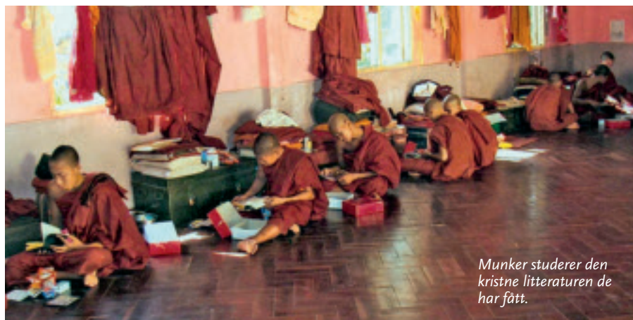
Munker studerer den kristne litteraturen de har fått.

Organisasjonen besøker også andre fengsler, og deler blant annet ut julegaver til de innsatte. I fjor delte de ut 40 000 slike «kjærlighetsgaver», som blant annet består av Johannesevangeliet og en kristen bok, håndklær, kaffe og melkepulver. Stefanusalliansen har via en stor gave fra en støttespiller bidratt