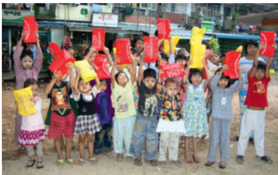
CFM deler ut «kjærlighetsgaver» til barn på barnehjem og til andre svakere stilte grupper i samfunnet.