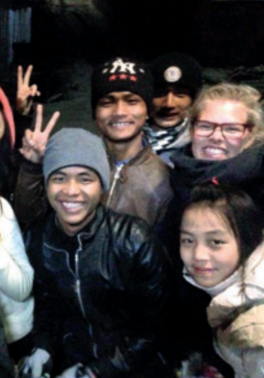
Gode vennskap på kryss av nasjonalitet, kultur og språk.

Myanmar. Dette syntes vi var vanskelig å skjønne. Det virket ikke som om elevene og lærerne på skolen ble forfulgt for sin tro. Men det forsto vi etter hvert at de ble. For eksempel fikk vi høre at myndighetene ønsket å rive ned det fine korset på «Prayer Mountain», som mange av ungdommene stolt viste oss når vi var der. De fortalte oss at flere kors hadde blitt revet de siste årene og blitt erstattet med buddhistiske pagoder. Tvangsflytting av kirker og andre bygg, landkonfiskering og tvangsarbeid for staten, er vanlig i Chin. Vi fikk høre om de mange billige internatskolene i landet med navn Na Ta La, som garanterer alle som er buddhister eller som