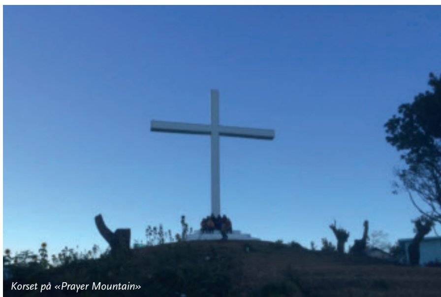
Korset på «Prayer Mountain»

Gjennom å få en mangfoldig universitetsutdanning på plass, ønsker man også å løfte delstatens næringsliv, arbeidsmuligheter og infrastruktur. Dette er et stort og dristig prosjekt, og vi ønsker å være med!