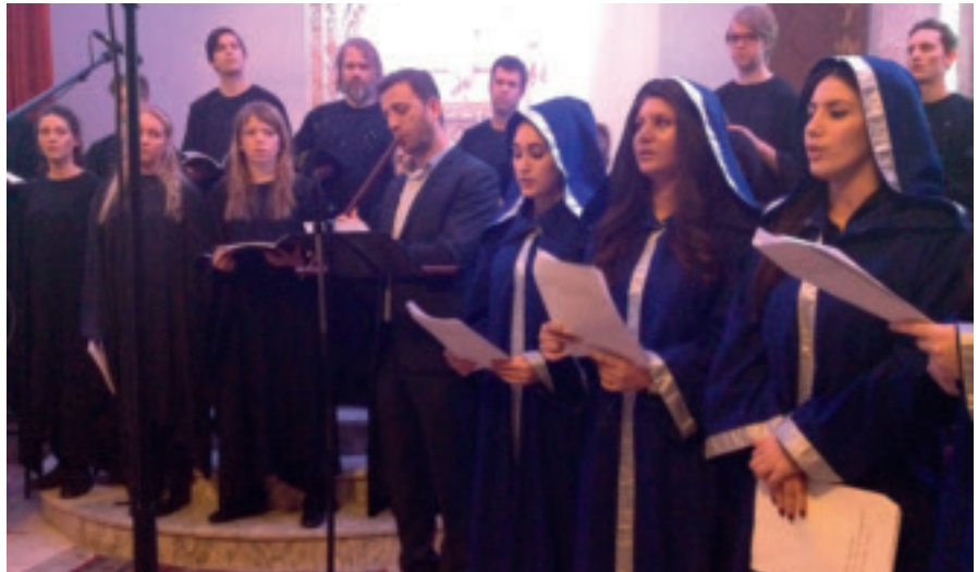
Jakobsliturgien, verdens eldste liturgi i kontinuerlig tradisjon, er i ferd med å forsvinne som aktiv praksis. Den synges på Jesu eget språk; arameisk, og den lever fortsatt i noen få miljøer i Syria, Tyrkia og Libanon. Og i Sverige; der en stor gruppe syriander har bosatt seg.

- Vårt mål er ikke å hate noen eller søke