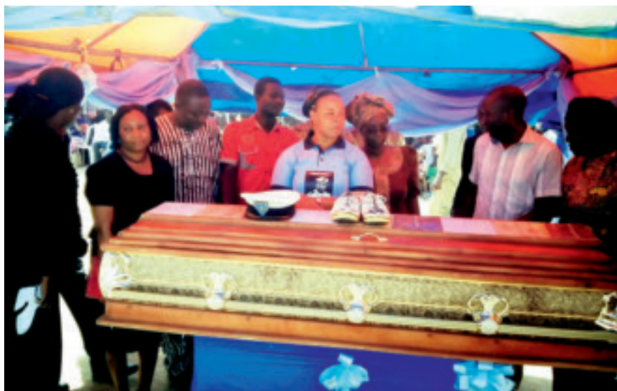
Pastor Adahs begravelse: Familie og venner tok farvel med sin umistelige far, ektemann og venn.

kampanjen i sosiale medier, er fremdeles mange av jentene i fangenskap.