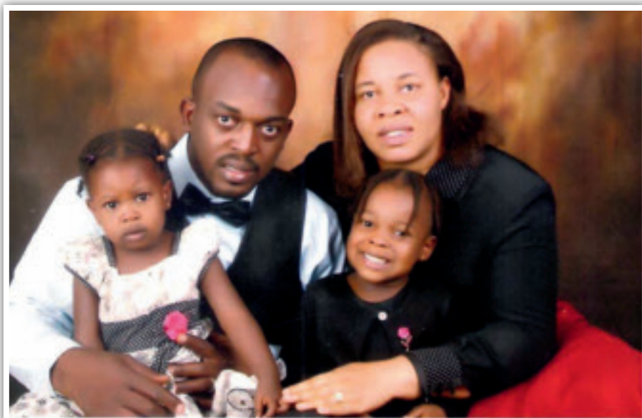
Pastor Adah etterlot seg kone og to barn.