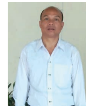
Pastor A Dao er satt fri.