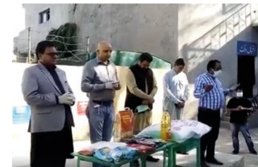
Kristne i Pakistan i minst en by ble nektet mathjelp under pandemien. I Lahore sørget Human Friends Organization for mathjelp.