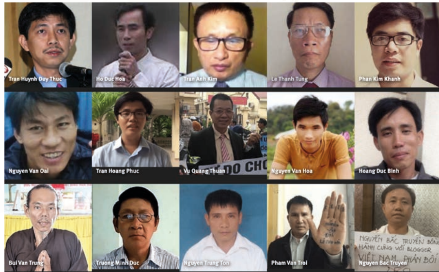
Over 250 samvittighetsfanger sitter i fengsel i Vietnam.

Troende som ikke er godkjent av den vietnamesiske staten, blir utsatt for press til å gi opp troen, trakassering, vold og tvangsforsvinning.