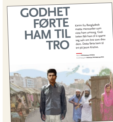
Mange tusen tror på Jesus som frelser i Bangladesh, selv om de kulturelt fremstår som muslimer. Faksimile fra Magasinet 5-2020.

– Da bøyde mannen hodet og gråt: «Søster, jeg har handlet galt, jeg har syndet mot deg, min kone og Allah. Nå forstår jeg hva sann kjærlighet er. Jeg tar imot Isa Masih som min frelser.»