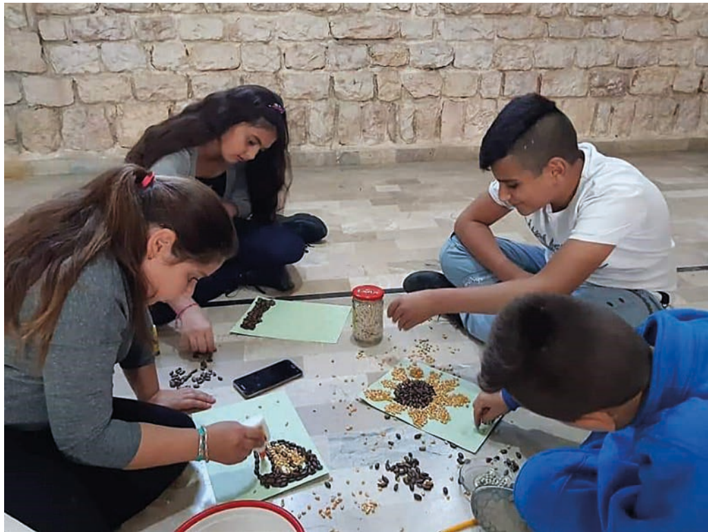
Syriske barn treng nokon som gjev dei håp.