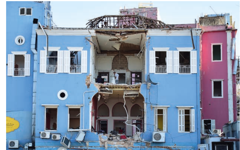
Eksplosjonen i Beirut 4. august skapte eit krater i byen og eit krater i heimane.

– Gud kallar oss til å stola fullt og fast på han. Det er vanskeleg, og det kan bli endå vanskelegare. Men Jesus gjev oss to grunnar til ikkje å vera urolege. Vi skal ikkje vera som heidningane som spring etter det materielle. Og vi har Gud som veit alt som skjer og som veit kva vi treng før vi ber han. Dersom vi hadde fått sjå Guds film for morgondagen, ville vi sjå Han stå rundt oss, midt i stormen, og vi ville finna kvile, sa Kashouh.