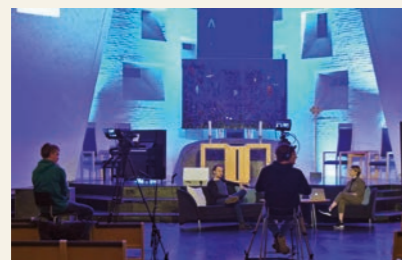
Ungdommene i Nærbø kirke med digital sending og basar.