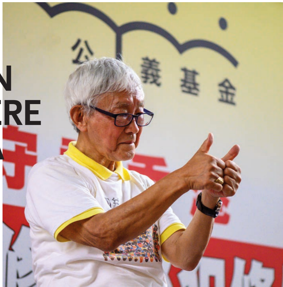
Tidligere kardinal Joseph Zen protesterer mot Kinas forsterkede grep og frykter for trosfriheten også i Hongkong.

Undergrunnskirken har levd med arrestasjoner, forfølgelse og vold i årevis. For å bedre situasjonen