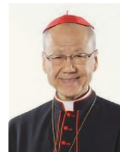
Kardinal John Hong Ton frykter ikke for trosfriheten i Hongkong.