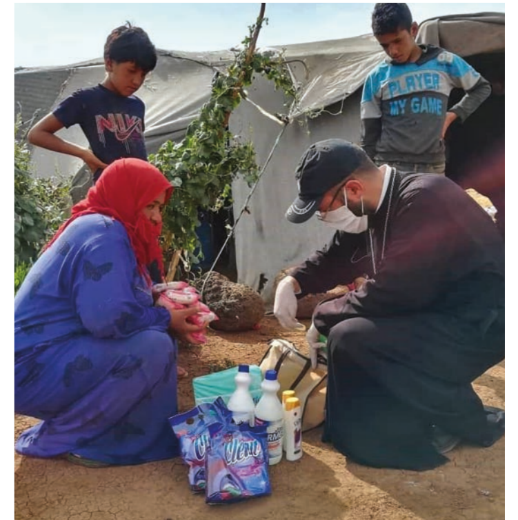
4165 familier fikk pakker med viktige hjelpemidler mot smitte.

Matvareprisen hadde i fjor høst steget med over 230 prosent siden året før og med 91 prosent siden mars 2020. I juni regnet Verdens matvareprogram at