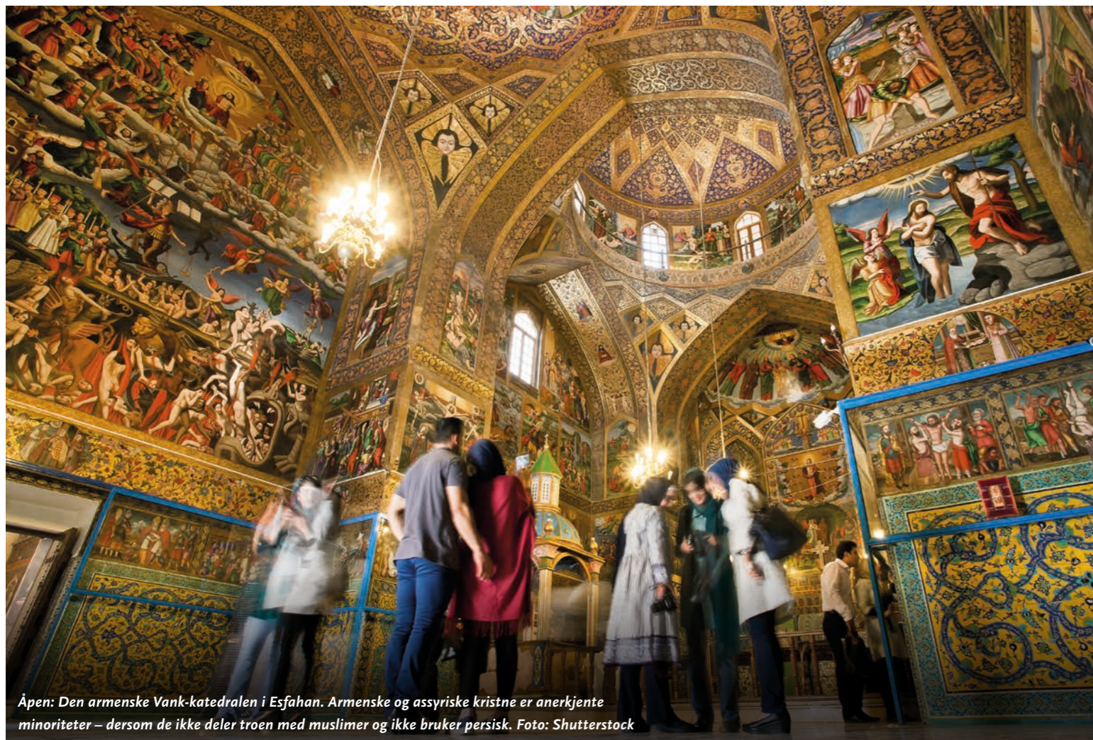
Åpen: Den armenske Vank-katedralen i Esfahan. Armenske og assyriske kristne er anerkjente minoriteter – dersom de ikke deler troen med muslimer og ikke bruker persisk.

Slike lykkønskninger stammer fra Ayatollah Ruhollah Khomeini, som før han kom tilbake til Iran for å grunnlegge en islamsk republikk i