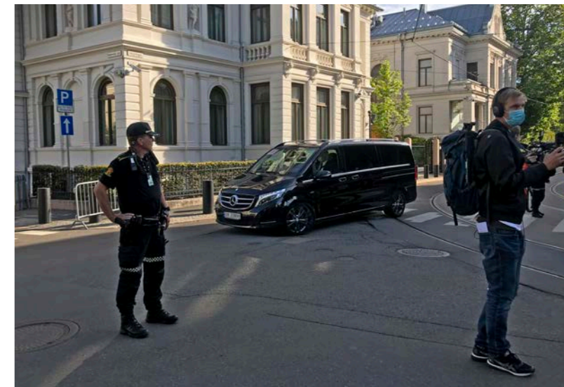
Kinas utenriksminister under besøk i Norge 27. august 2020.

■ Den amerikanske kommisjonen for internasjonal trosfrihet (USCIRF) vil ha undersøkt om Kinas politikk for fødselskontroll blant uigurene kan oppfylle kriteriene for folkemord.