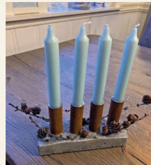
Lysestaken ble laget til inntekt for Stefanusbarna.

Barna fikk tingene med seg hjem sammen med en oppfordring om å gi et bidrag til Stefanusbarna – etter eget ønske. Barnehagen fikk inn 6320 kroner.