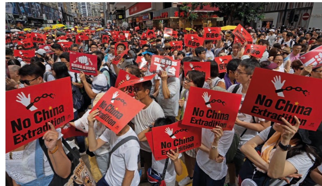
Store demonstrasjoner i Hongkong i juni 2019, mot at folk kan utleveres til Kina.