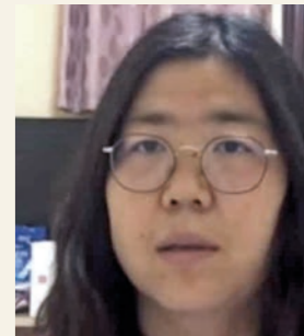
Zhang Zhan.

Zhang Zhan som er dømt til fire års fengsel fordi Kina mener at pandemi-rapportene hennes skapte strid og problemer, møter frykten med kristen tro.