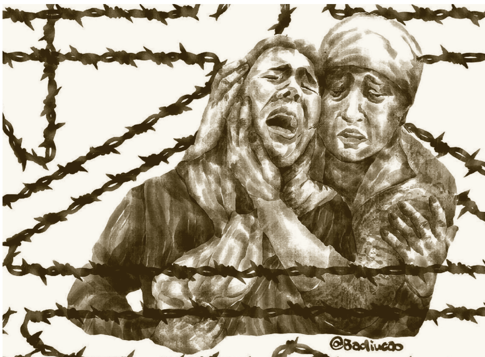
Badiucão er en kinesisk kunster med base i Australia. Illustrasjonen av undertrykkelsen av uigurer er laget for den kristne menneskerettighetsorganisasjonen CSW. Brukt med tillatelse.

Da hun ble beordret til å undervise innesperrede uigurer i kinesisk, ble Qalbinur Sidik (51) vitne til en brutal kampanje for å få uigurkvinner til å slutte å føde barn. Hun ble selv offer.