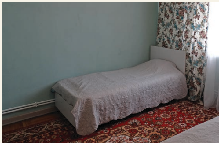
På Josefs hus er det hvile.