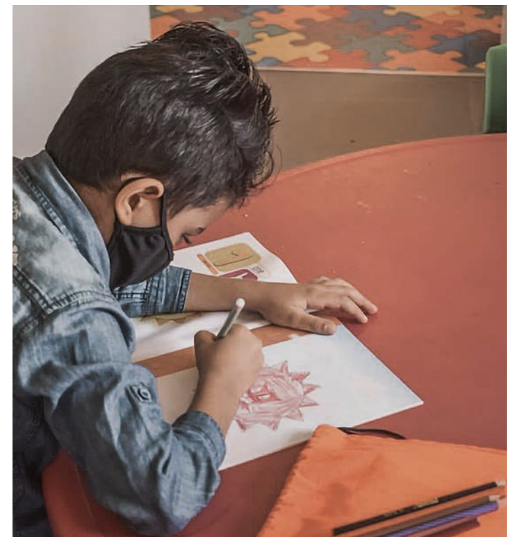
De kjemper for å bevare håpet.

– Jeg har ikke noe valg. Jeg må skaffe familien min et levebrød, selv om det betyr å få covid-19 selv. ■