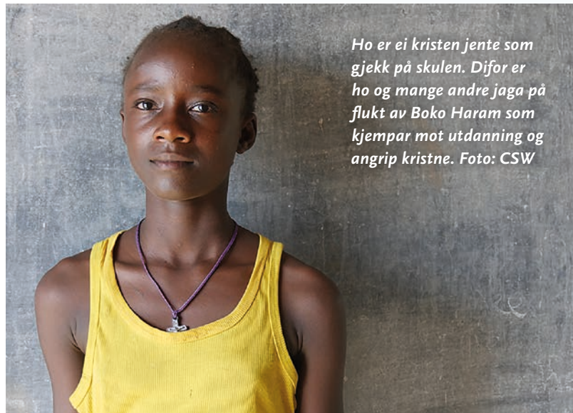
Ho er ei kristen jente som gjekk på skulen. Difor er ho og mange andre jaga på flukt av Boko Haram som kjempar mot utdanning og angrip kristne.

– Men vi er sjokkerte når vestlege land som står for fundamentale rettar, snur ryggen til valden og talibaniseringa i Nigeria. Kvifor seier ingen noko om kristne