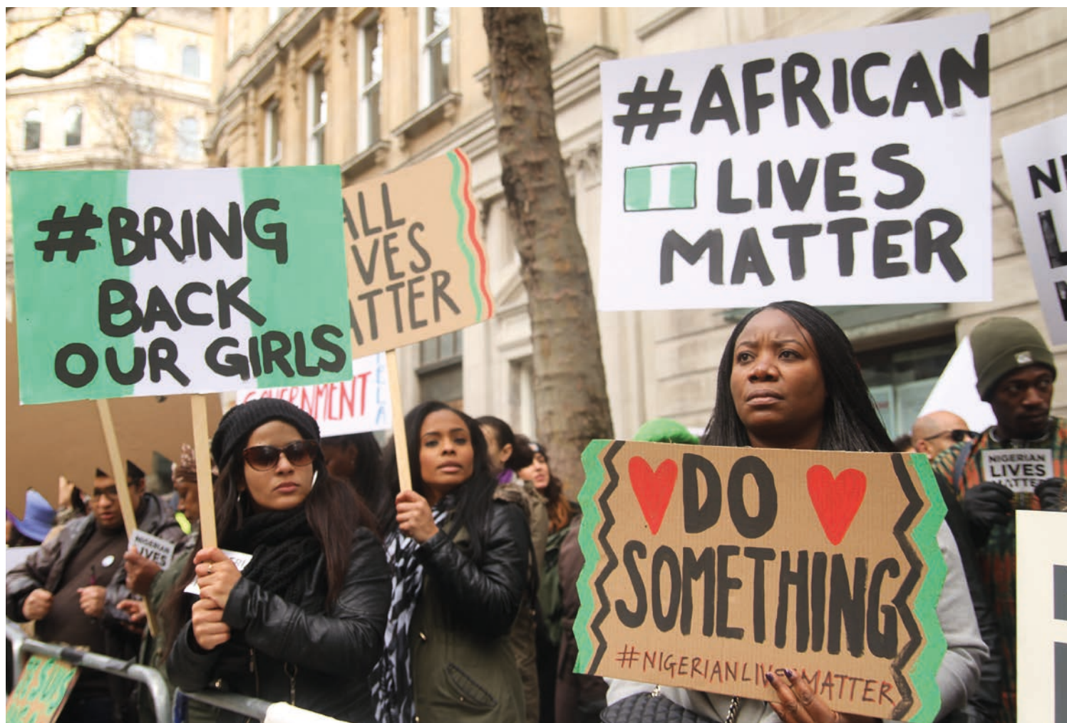
Demonstrasjon i London for dei kristne Chibok-jentene som vart kidnappa av Boko Haram i 2014.