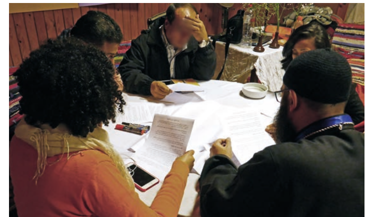
I Egypt fikk en gruppe kirkeledere kurs i trosfrihet, her et gruppearbeid. De fleste kurs går digitalt.

UD-avtalen går ut til sommeren. Stefanusalliansen søker ny avtale. ■