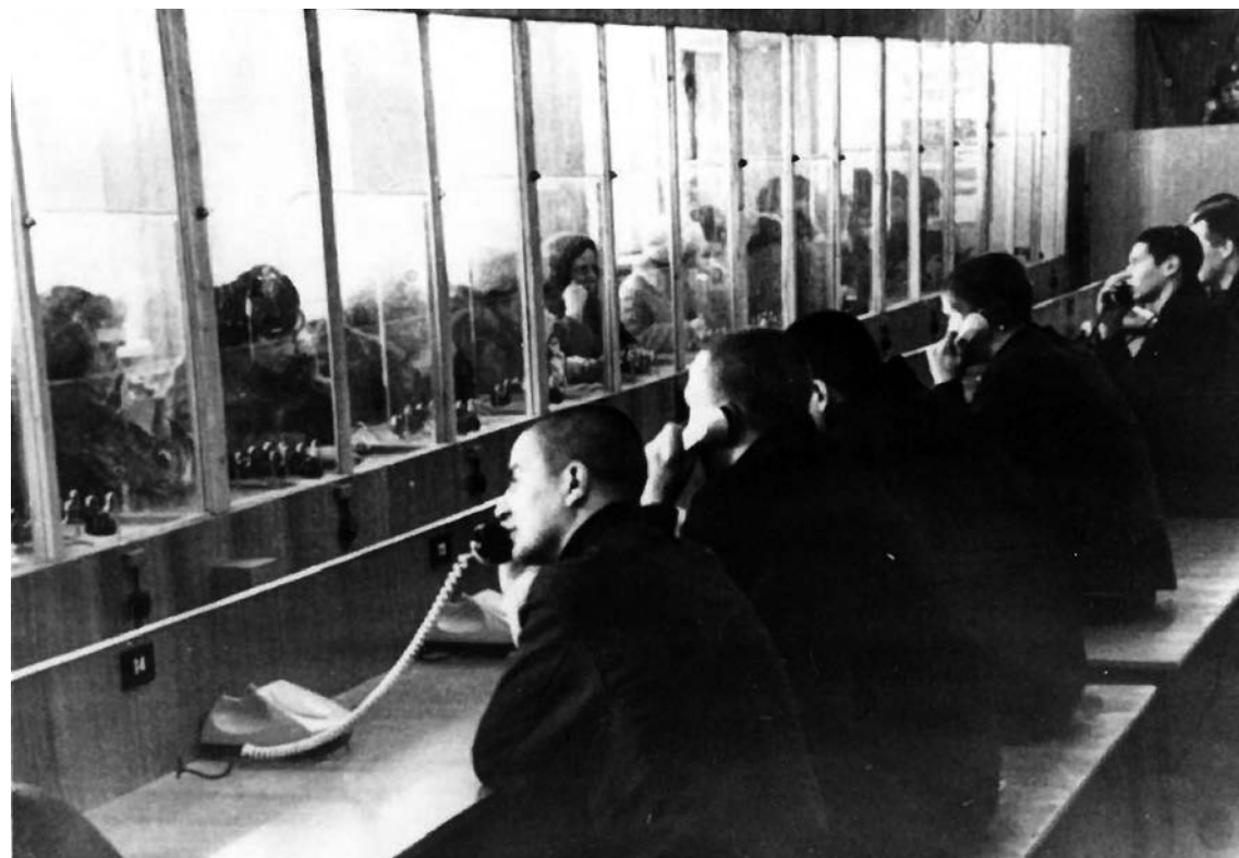
Fanger i Sovjetunionen får besøk.