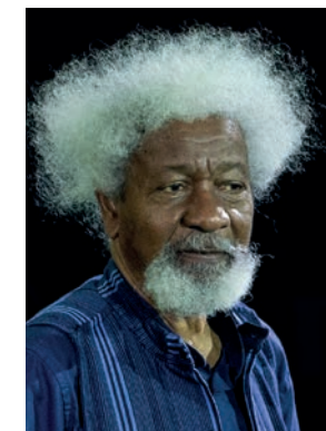
Nobelprisvinnar Wole Soyinka.