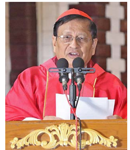
Kardinal Bo med sterk appell.

Etniske minoriteter har kjempet mot militæret for større innflytelse over egne landområder. I over seksti år har mange kjent hærens brutalitet på kroppen. Militærets brutale fremferd etter kuppet har gjort at den bamar-buddhistiske majoriteten har fått øynene opp for minoritetenes lidelser. Og mange unge vil heller dø i kamp for demokratiet, enn å leve under et militærdiktatur.