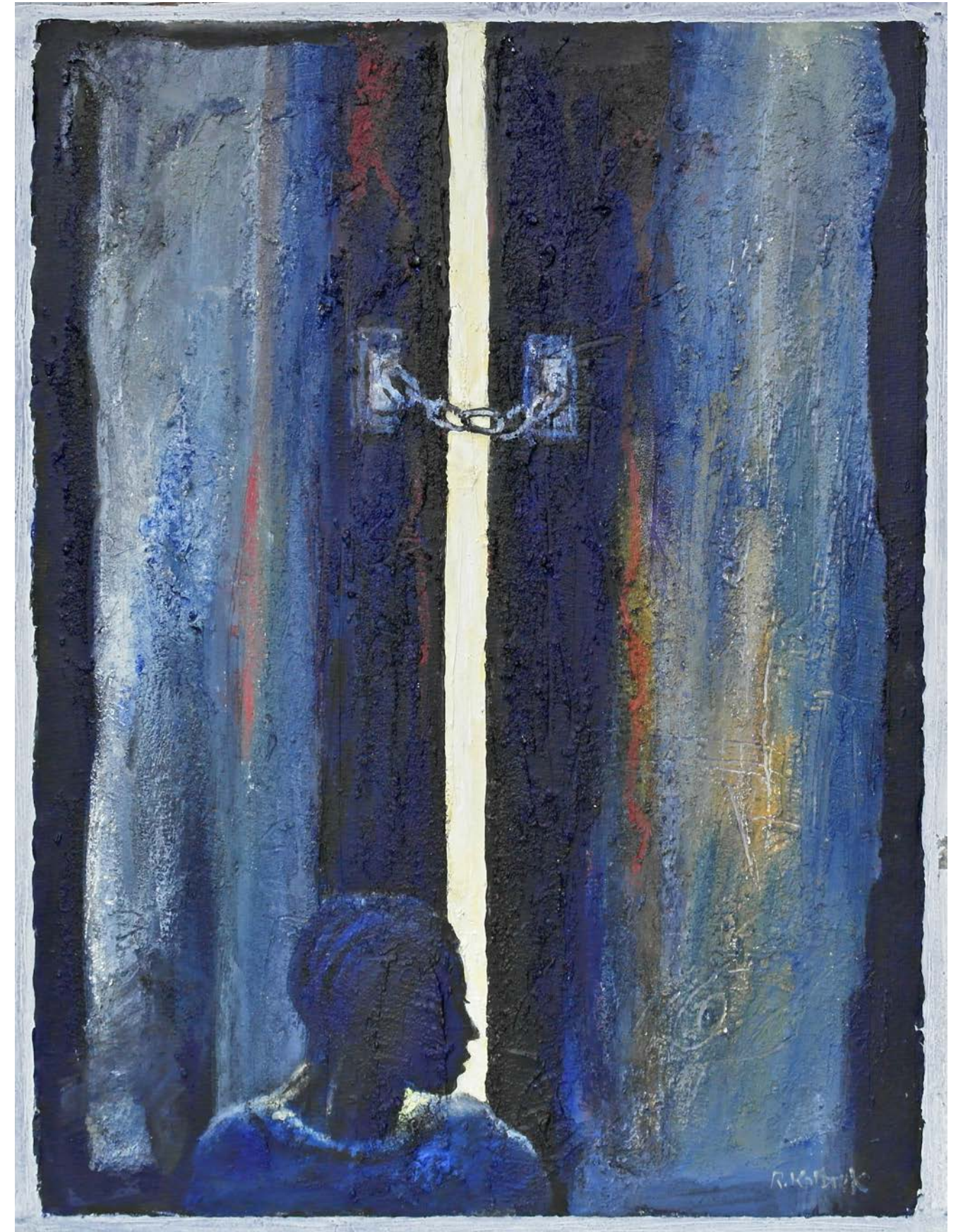
Maleri av kunsteren Reidar Kolbrek.