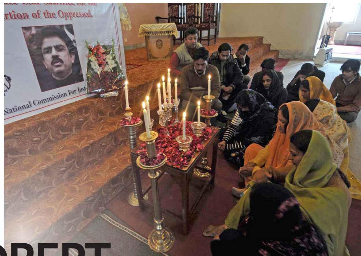
Kvinner fra et kristent nabolag i Rawalpindi i Pakistan tenner lys i bønn foran et bilde av den drepte Shahbaz Bhatti, 5. mars 2011.