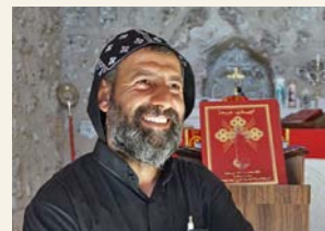
Fader Aho i Mor Yakub-klosteret.