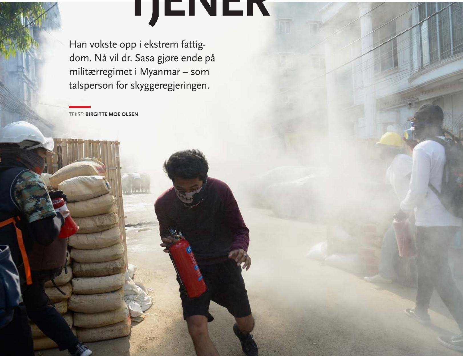
Hæren i Myanmar slår ned protester i den største byen Yangon.

■ Natt til 1. februar ble internett og telefonforbindelser kuttet i hovedstaden Naypyidaw. Politiet banket på dørene til folkevalgte politikere i tidlige morgentimer og fraktet dem til arresten uten stor motstand. Militærkuppet var ett av flere i Myanmar's brokete historie.