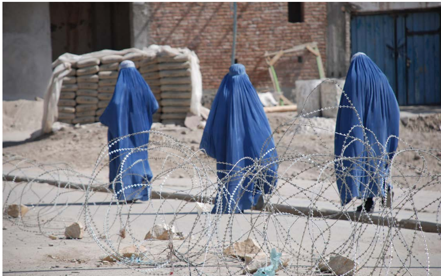
Blir dette lagnaden? Burka og piggråd?