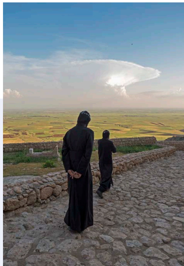
To munkar ved et kloster sørøst i Tyrkia. Dette var for hundre år siden et kristent kjerneområde, men nå er det bare et par tusen kristne igjen.

Uten å være redd for konsekvensene kan jeg skrive disse ordene om Gud. Uten frykt for å bli stoppet av myndighetene kunne jeg sette meg i bilen og kjøre hit med sønnen min. Uten bekymring kan jeg være her, omgitt av folk jeg ikke kjenner, og vite at de godt kan få vite at jeg er prest,