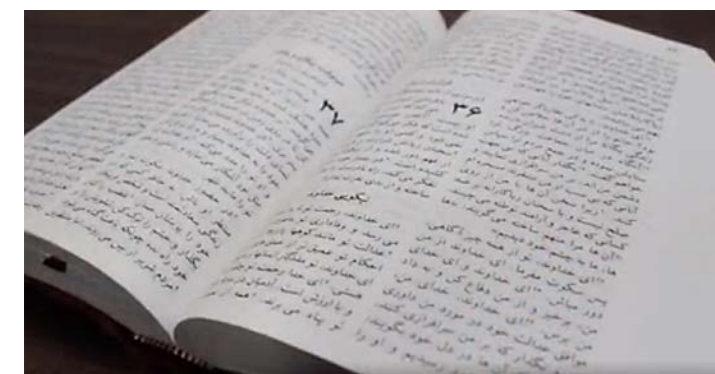
Bibelen slår rot i Afghanistan..