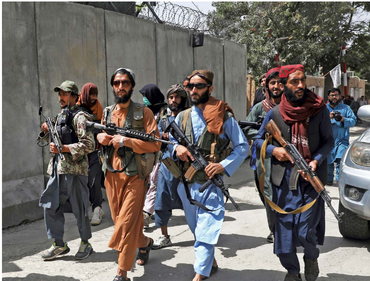
Taliban-krigarar marsjerer i gatene i Kabul.