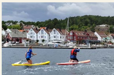
Lillesand menighets ildsjeler padler for Egypt.

■ Menigheten synes det er gøy å prøve nye måter å informere og få inn penger til misjonsprosjektet på.