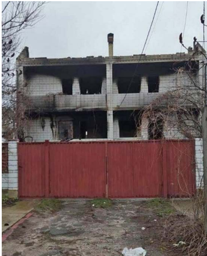
Huset i Butsjja står utbrent tilbake etter møtet med den russiske krigsmaskina.