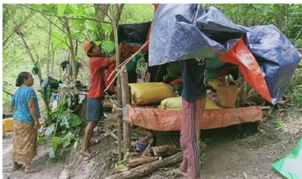
Mennesker som er drevet ut i jungelen, får hjelp i krise.