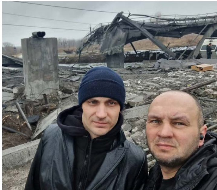
To menn frå kyrkja i Kyiv hjalp Armine over Irpin-elva. Brua var knust, og betongrestane låg i elveløpet.