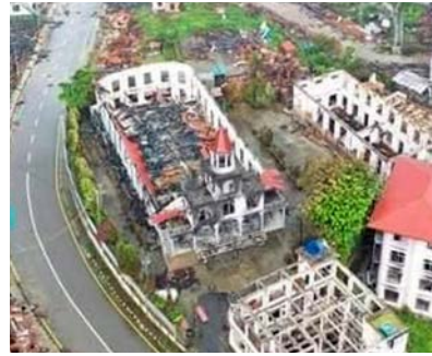
Slik såg Thant Lang Baptist Church ut. På bildet til høgre er kyrkja brent ned.

– Alle 10 000 som budde der, har for lengst flykta. Men juntaen held fram med å brenna for å visa dominans.