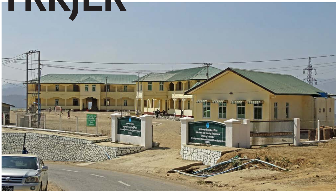
«Na Ta La-skulen» i Hakha er blitt brukt til å lokka eller pressa fattige chin-barn til å bli buddhistar.

■ – Juntaen øydelegg bevisst bygg som er viktige for eit folk, seier «pastor Tur» til Magasinet Stefanus.