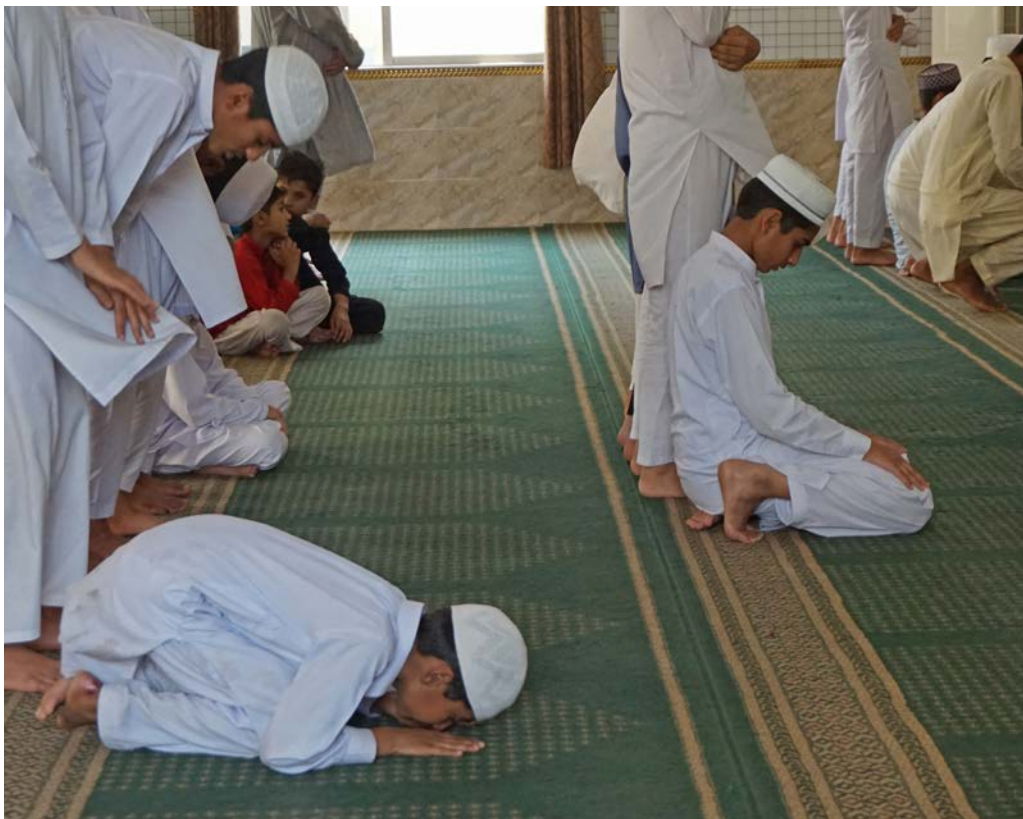
På koranskolen Jamia Ume Ashraf Jamal lærer barna å forsvare og spre islam.