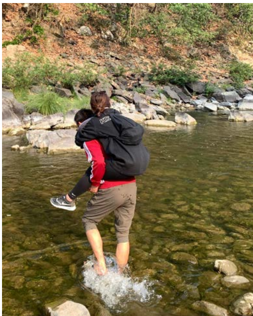
Bors venn som så vidt unngikk arrestasjon, bar henne over elva som skiller Myanmar fra India.

obligatorisk undervisningsspråk. Det har vært forbudt å snakke minoritetsspråk i offentlig skole.