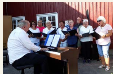
Simonstad-koret stilte opp under Lillesand menighets sommerbasar.

Venner og støttespillere sponset sine utvalgte helter som deltok i konkurransen, og det ga resultater. Misjonsutvalget sørget for kaffe, brus, boller og muffins, og delte ut informasjon. En iherdig konferansier bidro ekstra til god stemning.