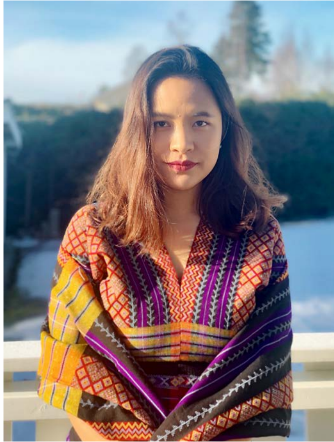
Fra Norge hjelper Bor barn fra sitt eget folk med skolegang.