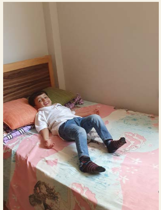
Gutt på barnehjem viser stolt fram sin egen seng.

TEKST OG FOTO: CHRISTINE GRIPSGÅRD LUNGA