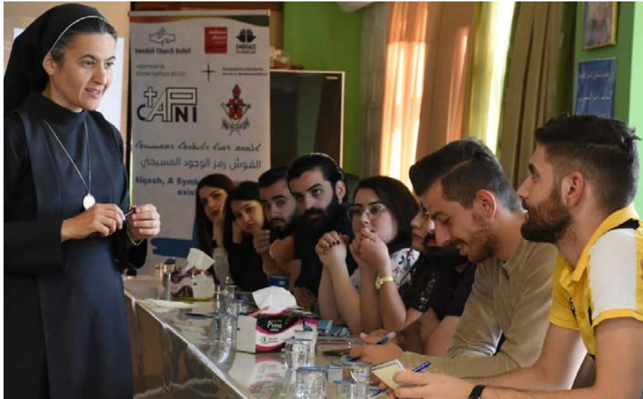
CAPNI gir unge kristne kunnskap og nytt håp.

” Vi ser håp når vi får et barn til å smile.