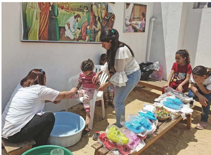
I Kairos «søppelby» gjør fotvask at barna blir sett og elsket – og at de får en viktig helsesjekk.

Å vaske barns føtter er dessuten en viktig helsesjekk. Det er lett for barna å trække på sprøytespisser, eller andre ting som ikke er bra. Med fotvasken blir de også