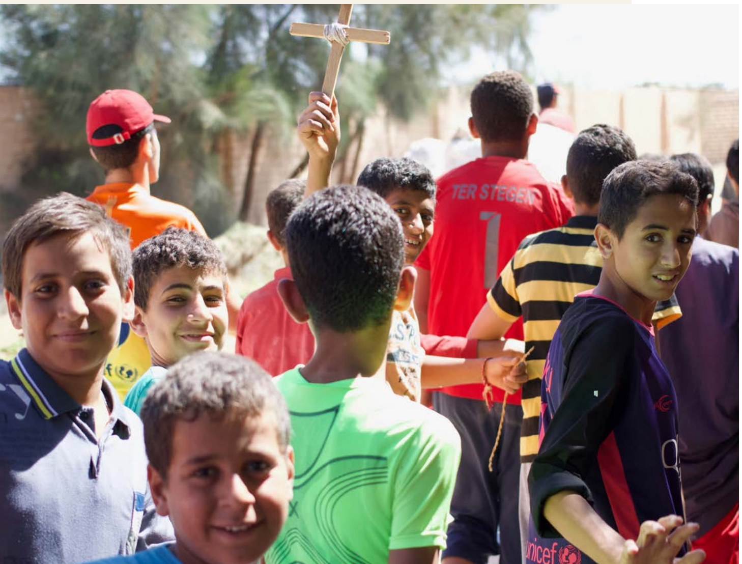
På Anafora i Egypt viser de koptiske guttene gjerne frem sitt kors. De fattige guttene kommer fra bispedømmet til biskop Thomas sør i Egypt.