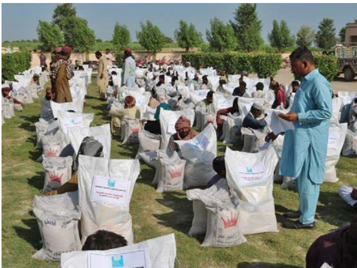
Mange flomrammede familier mottar hjelp fra HFO.