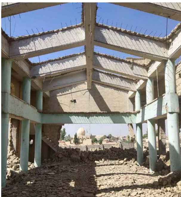
Jomfru Maria-kirken i Mosul er gjort til ruiner.