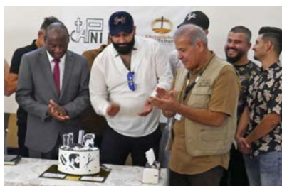
12 unge menn skal starte som frisører i ulike landsbyer.