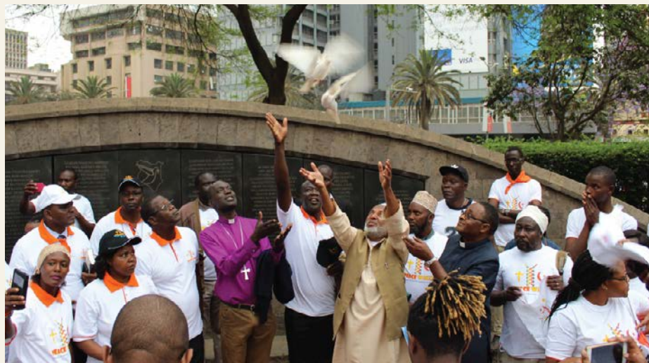
PROCMURA markerer den internasjonale fredsdagen i Nairobi i Kenya i 2018.