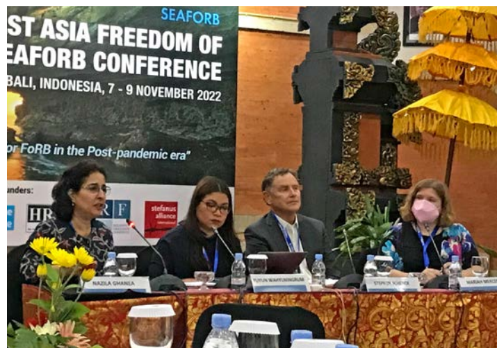
Sentrale folk på SEAFORB, som Nazila Ghanea, FNs spesialrapportør for trosfrihet (t.v.).