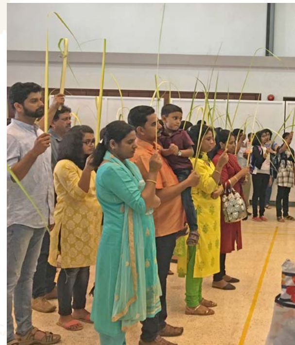
Påskefeiring i den katolske kirken i Sohar i Oman.

Fattige gir sin lille skjerv i kirken når de kan. Middelklassen gir etter evne. De aller rikeste gir store donasjoner: Utenlandske bedriftsledere har kanskje selv tjent på at immigrantarbeidere har svake rettigheter og elendig lønn, påpeker Thorbjørnsrud.