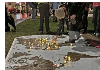
I Oslo fikk deltagere tenne lys på verdenskartet for mennesker som flykter på grunn av sin tro.

– Ingen skal stå alene i forfølgelse. Ingen skal være glemt når de er på flukt for sin tro, selv om mediene er lite opptatt av det som i dag samler oss, sa hun. ■