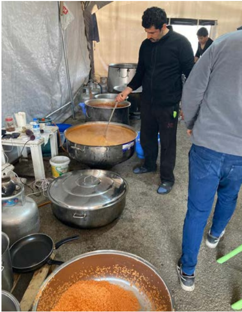
Frivillige fra Antalya-kirken har sammen med andre kirke- lige frivillige delt ut mat til opp til 3000 i Antakya.