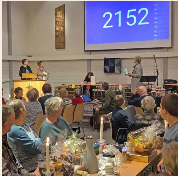
Den årlige basaren på Fitjar bedehus, med digital trekning og vinnernummer på storskjerm, skaper stort engasjement.