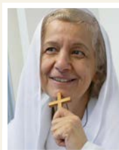
TEKST: MAMA MAGGIE, VED EYVIND SKEIE

Hvis noen vil ta korset opp og følge ham, så må de be om å kunne forstå hva Jesu navn betyr, for ved Jesu navn blir vi frelst og kalt til tjeneste for ham.