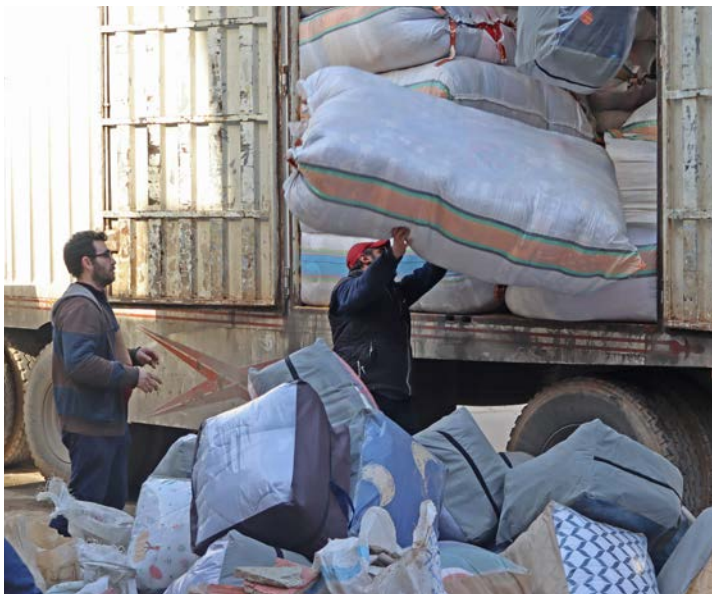
Ein lastebil full av vinterutstyr kjem med første hjelpesending til Aleppo nord i Syria.

” Måtte dei lokale kyrkjene i Syria gje eit glimt av håp i ein desperat situasjon.