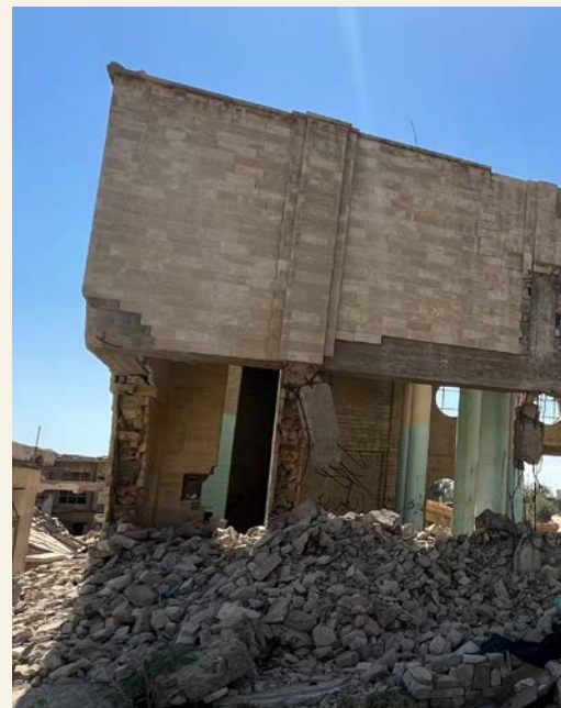
Kyrkja bygt til Jomfru Marias ære i Mosul, blei øydelagt under IS.

– Jeg ønsker å holde håpet levende for kristne her i Irak. Vi må holde håpet levende i oss selv i møte med livets presserende vanskeligheter. ■