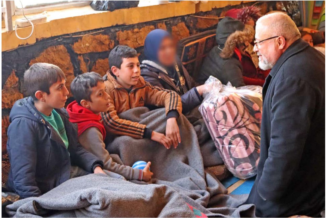
Ein syrisk prest hjelper barn som har overlevd jordskjelva nordvest i Syria.