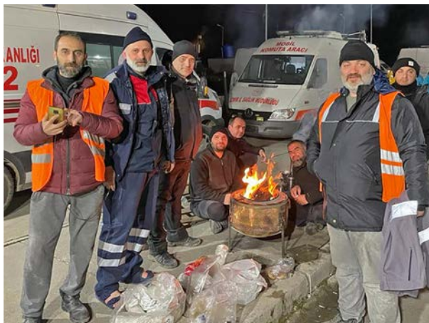
Et team fra First Hope Association varmer seg rundt et bål i jordskjelv-området i Antakya.

for den hjelpen og omsorgen han fikk av kirker. Jeg glemmer ikke mannen.