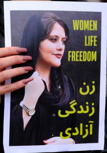
Mahsa Aminis død i varetekt hos det iranske moralpolitiet utløyste store demonstrasjonar over heile Iran.