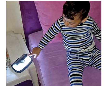
En gutt i Libanon gleder seg over solcellelampen.

– Jeg har også delt lampen med mine romkamerater. Pris Herren og takk!