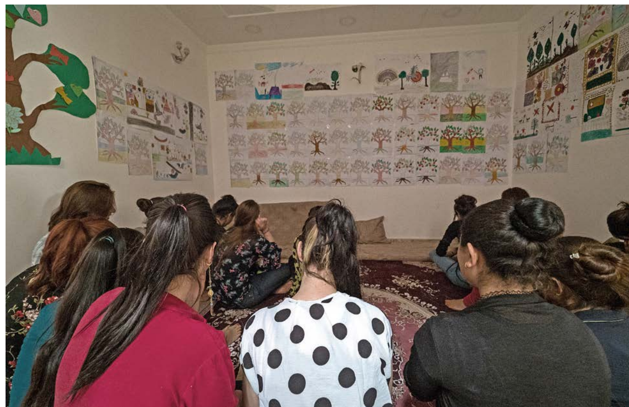
Nokre av jesidi-kvinnene som vart sette fri frå slaveri under IS, har fått hjelp på Hope Center i Duhok i Nord-Irak.