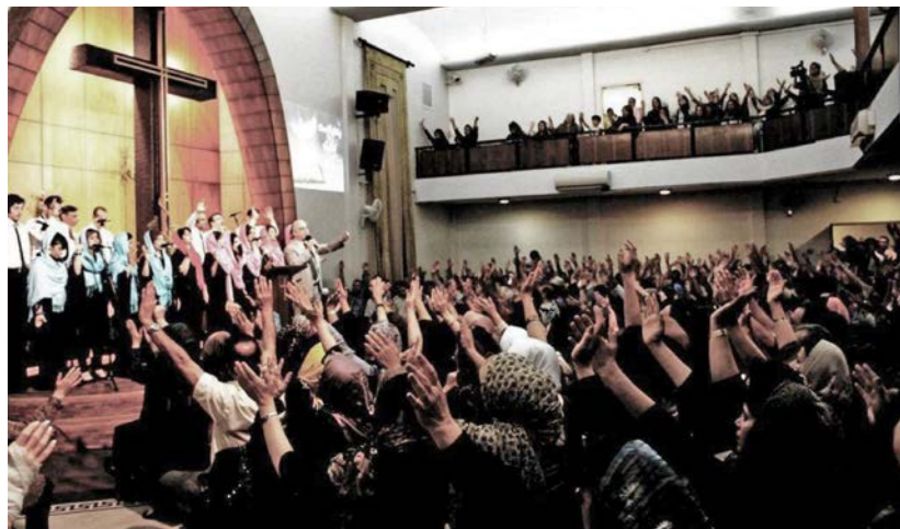
Kirken Assemblies of God Teheran ble stengt av iranske myndigheter i 2013 fordi flere og flere konvertitter møttes til gudstjeneste.