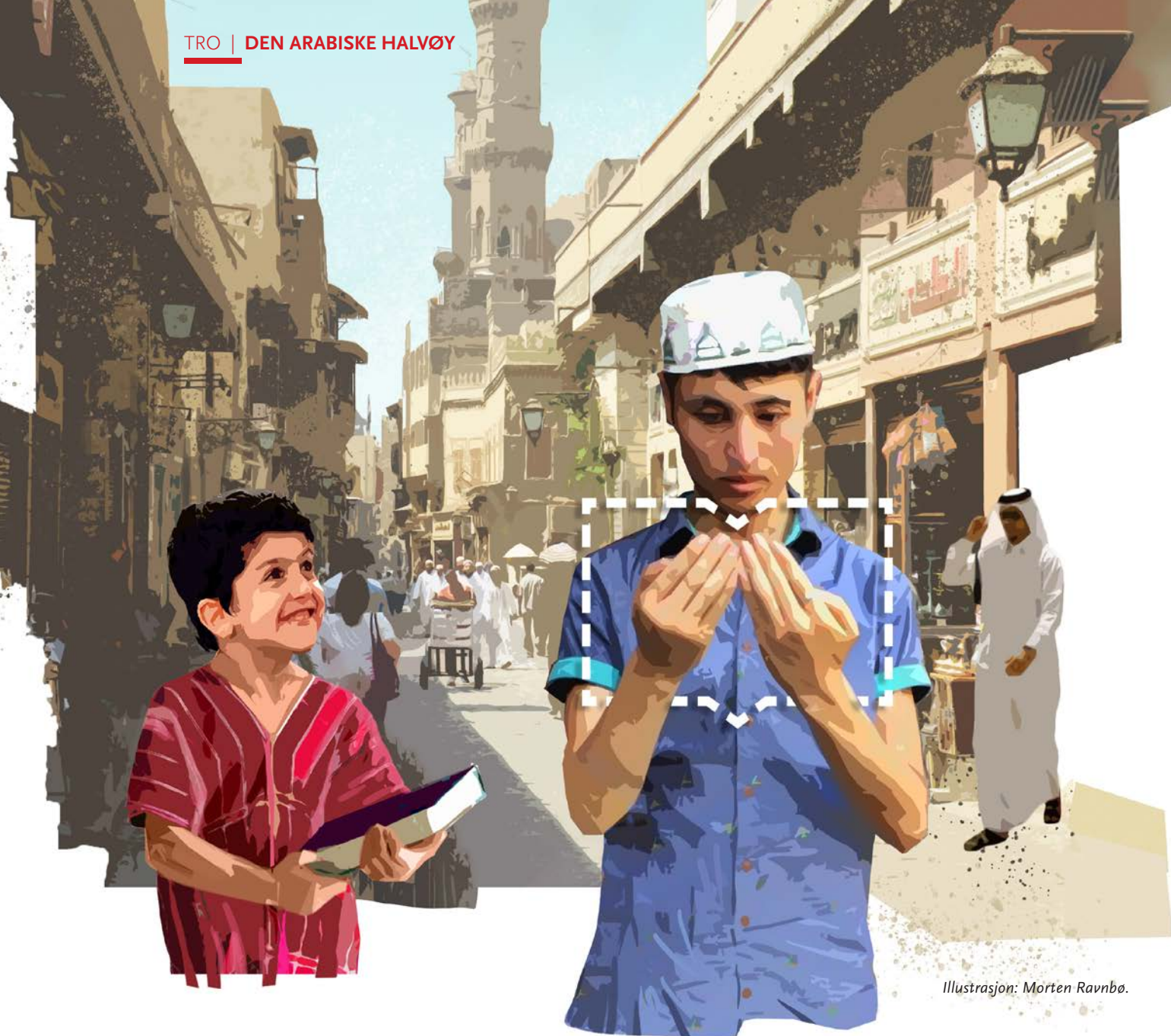
Illustrasjon: Morten Ravnbo.