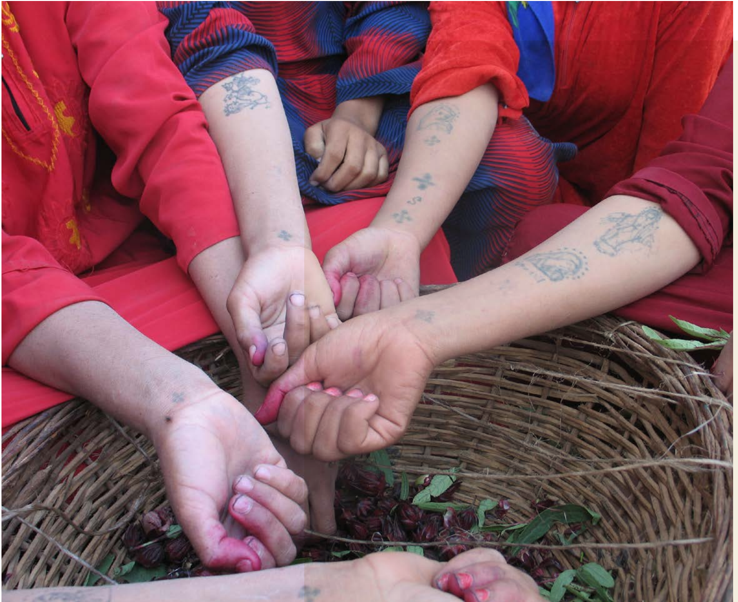
Koptiske kristne i Egypt tatoverer korset på håndleddet som tydelig symbol på sin tro.