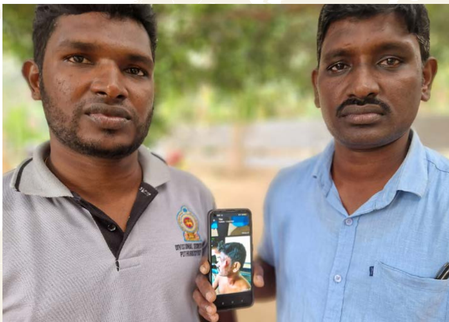
Naboene vil helst ha denne kristne familien og kirken deres bort. Ofre og overgripere er fra tamilminoriteten.