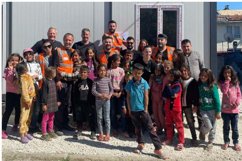
Team fra First Hope Association ser smil i barneansikter.

De baker tusenvis av brød hver eneste dag og har satt opp 7000 telt til mennesker som mistet alt under jordskjelvene som rammet Tyrkia og Syria.