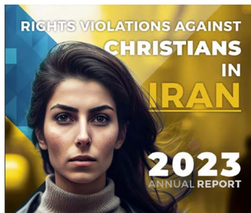
Årlig rapport viser økning i brudd på kristnes trosfrihet i Iran.

De små minoritetene av armenske og assyriske kristne anerkjennes, men de må holde sine gudstjenester på sine egne etniske språk og i egne kirkebygg. I 2022 ble to armenske kristne dømt til 10 år i fengsel for å ha holdt gudstjenester for konvertitter i sine hjem. ■