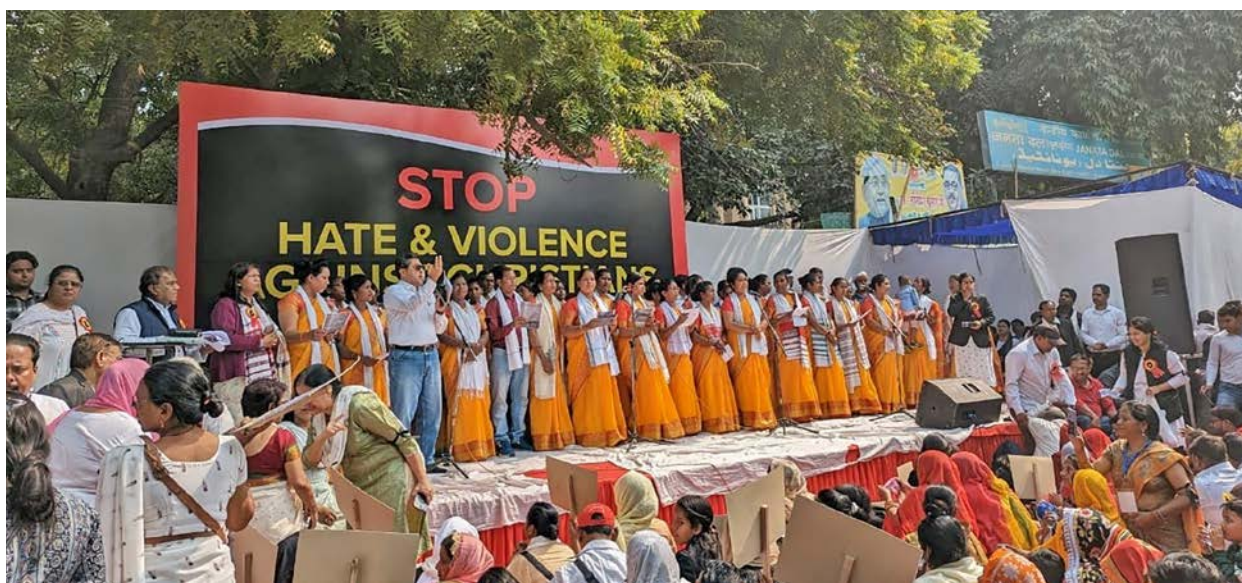
Den 19. februar samla 22000 indiske kristne seg til protest mot vald og hat.