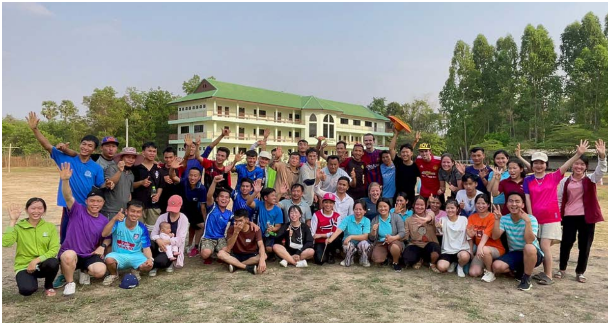
Felles glede blant studenter og gjester fra Norge.