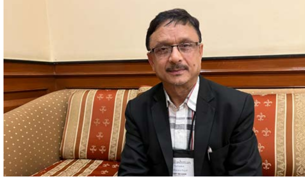
Kailashman Sashankar vil ikkje ha ein religiøs stat, uansett fleirtal i folket.

Nepal har fått fleire hindunasjonalistiske, ekstreme organisasjonar. Slike organisasjonar – som den kjende og frykta RSS – har kome over den opne grensa frå India. Desse skapar aukande uro for angrep på kristne og andre minoritetar.