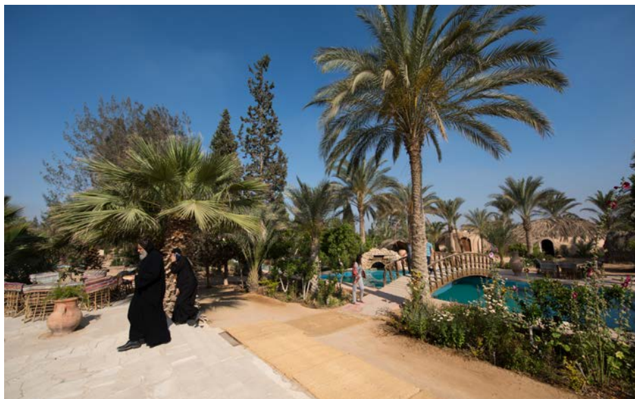
På Anafora er ørken gjort til hage, og solceller skaffar så langt tiandeparten av elektrisiteten.