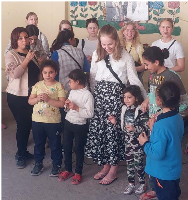
Gruppen av kristenruss på besøk hos Stefanusbarna.

Utover påskeuken fikk gruppen av Kristenruss oppleve mye forskjellig. De besøkte flere kirker og ble kjent med kristne fra forskjellige land, noen fra Sudan og andre fra Den arabiske halvøy. Selvfølgelig var det også tid til å være