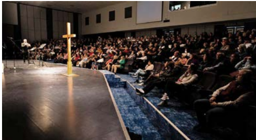
En av de tre påskekudstjenestene som Antalya-kirken fikk holde utenfor egne lokaler.

■ Helt siden det første av en serie jordskjelv la tyrkiske og syriske byer i grus 6. februar i år, har Stefanusalliansens partnere i begge land kjempet for de overlevende.