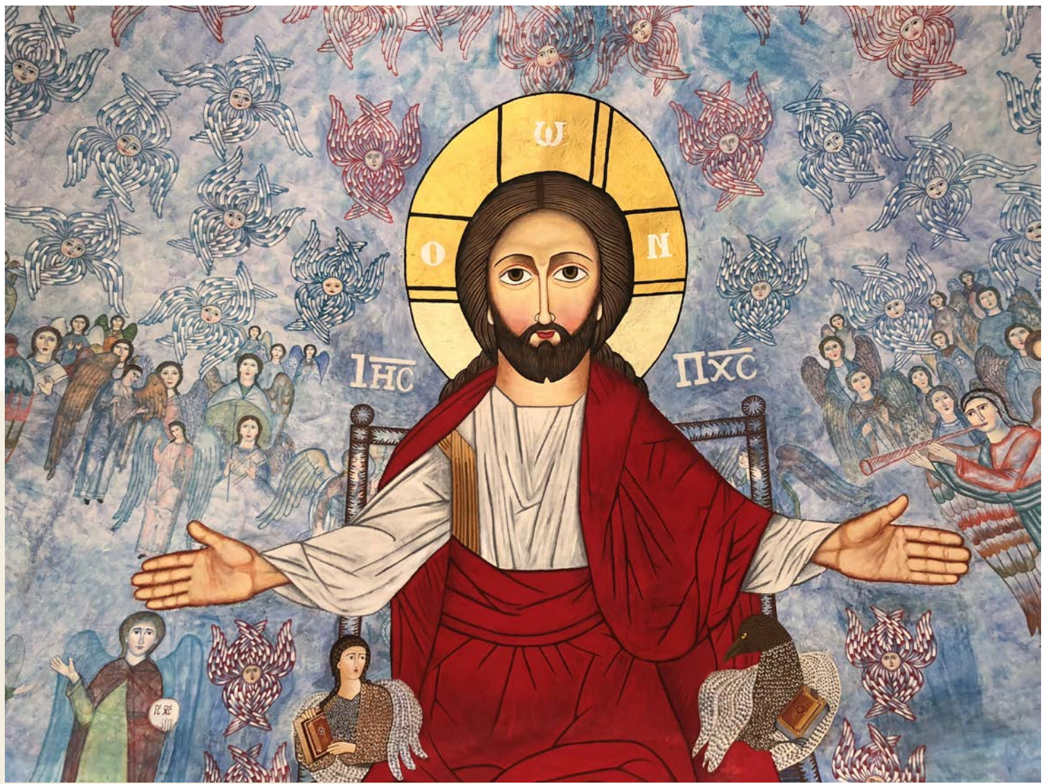
Ikonomaleri i taket på en av kirkene på retreat- og utdanningscenteret Anafora i Egypt.

trampet på og glemt. Der er det, mitt rike. Slik er min makt, jeg vil få det som jeg vil.