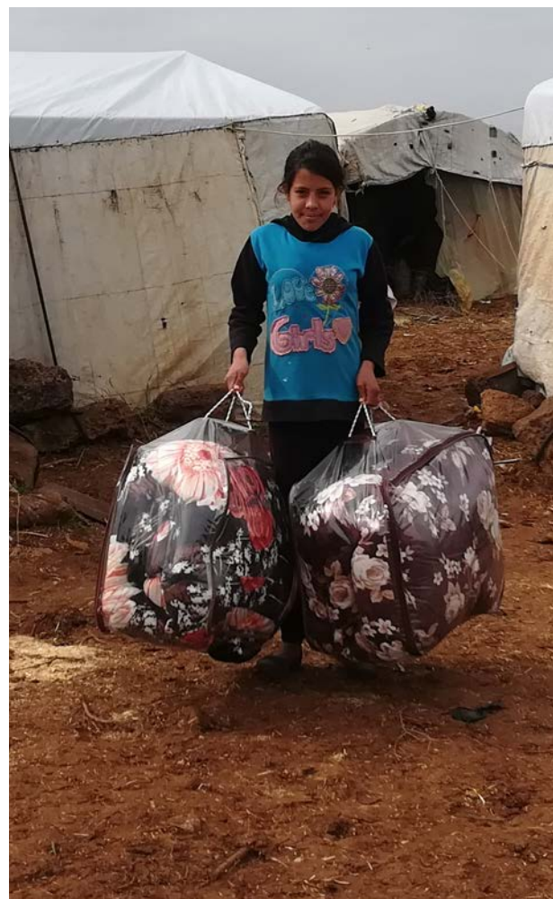
En syrisk jente i en leir for flyktninger fra borgerkrigen.