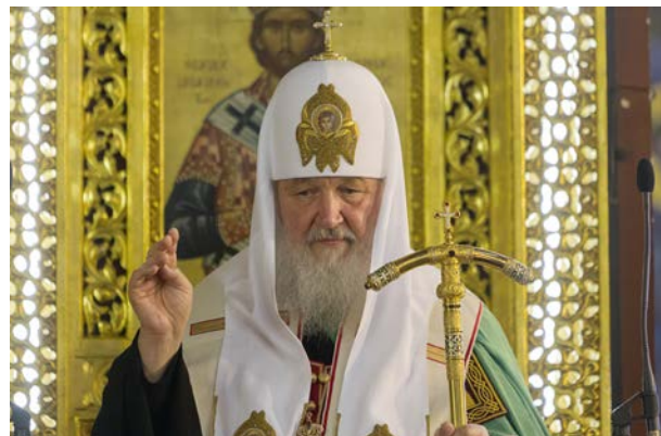
Patriark Kirill forsvarer krigen i Ukraina.