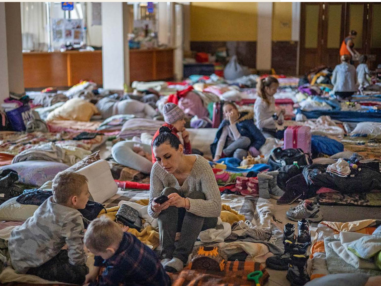
En mor på flukt fra krigen trøster sine barn på togstasjonen i Lviv.

Du, som har vist oss et ansikt som speiles i splinter og skår. Å, sårede Gud, strekk ut hånden, skap under der sår møter sår! Kyrie eleison!