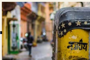
Pastor overfalt og drept i sitt eget hjem.