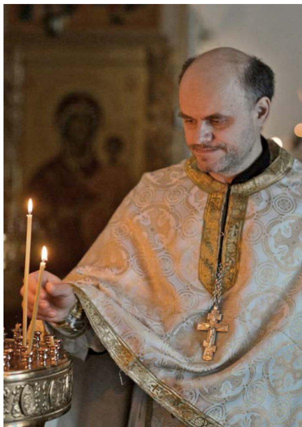
Han minnet om budet «Du skal ikke drepe».