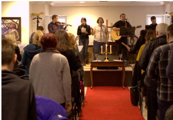
Nye kjem til tru i dei protestantiske kyrkjene i Tyrkia, sjølv om dei er under press.

Stefanusalliansen støttar Den protestantiske alliansen i Tyrkia og utgjevinga av denne rapporten. På nettsida vår kan ein lesa ei lengre sak og finna rapporten. www.stefanus.no