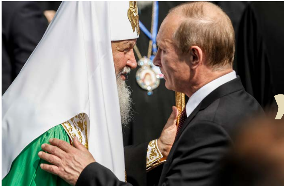
Patriark Kirill og president Putin i tett allianse.

Det er harmoni mellom makta til dei væpna styrkane og den åndelege makta til kyrkja.