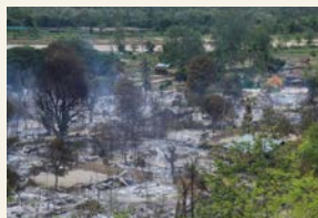
Nok en landsby brent ned av Myanmar militære.