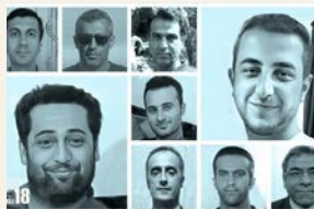
Nå er de ni frikjent.