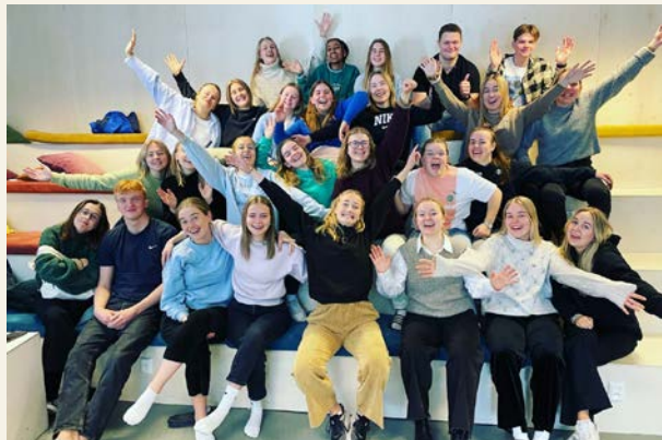
Disippelklassen på Hedmarktoppen ble engasjert i møte med Stefanusalliansen.

– Slike tilbakemeldinger oppmuntrer oss i Stefanusalliansen, sier Daniel Hop-Hansen.