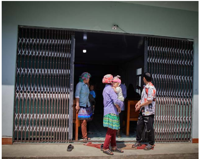
På vei til gudstjeneste.

De 13 familiene i Coc Cang har en drøm, og drømmen er nabolandsbyen. ■