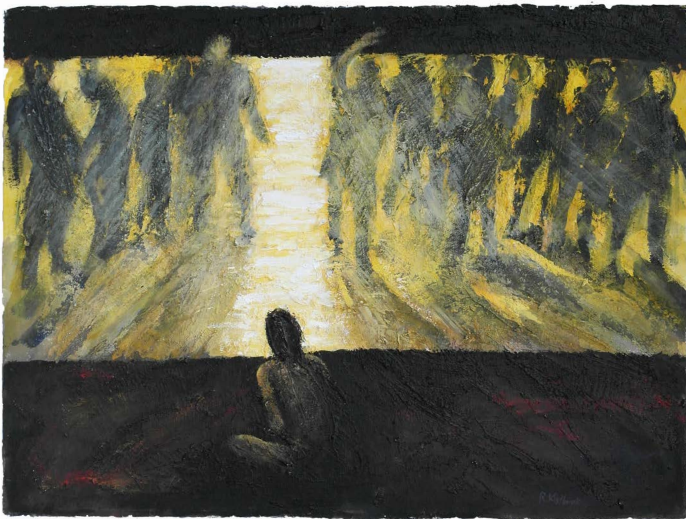
Måleri av biletkunstnaren Reidar Kolbrek.