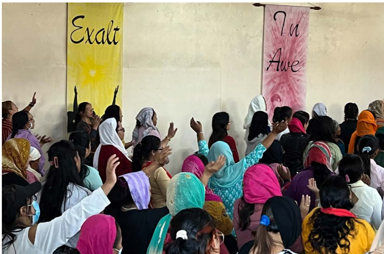
Det store fleirtalet på gudstenesta i The Lords Assembly i Kathmandu er kvinner.