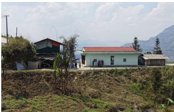
Den hvitmaltede kirken er bygget av menighetens folk.

” Kirken i Coc Cang er ny og hvitmalt, solid og enkel. Den er et felles løft.