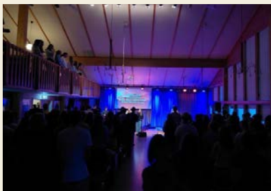
Elevene på Framnes tok godt imot Stefanusalliansen.

Framnes kristne videregående skole er en av flere skoler som ønsker at elevene deres skal bli informert om og engasjert i kampen for trosfrihet. De inviterte Stefanusalliansen på besøk for å få høre historier og ha en samling med et ekstra fokus på de forfulgte.