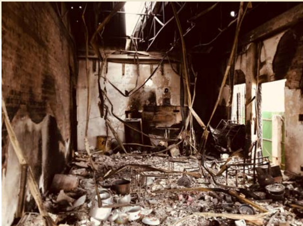
Ei vandalisert og brent meitei-kyrkje i Imphal i Manipur.