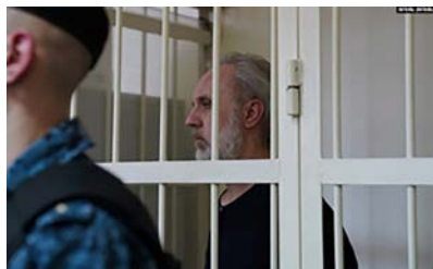
Fader Ioann: Tre års fengsel.