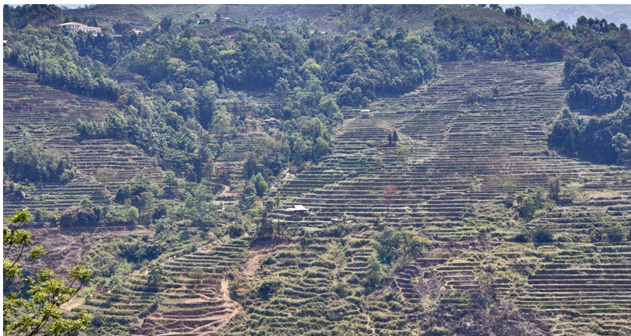
Landsbyene klorer seg fast i dalsidene.