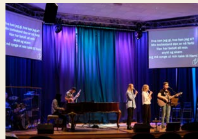
Ungdommen i YA tok godt imot Stefanusalliansen.

Den 15. september ble Øystein fra Stefanusalliansen invitert på besøk for å dele historier fra Egypt og å rette oppmerksomheten mot den forfulgte kirke.