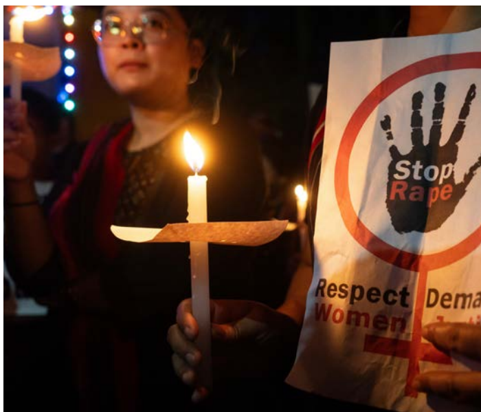
Hundrevis av jenter og kvinner er utsette for grufulle overgrep i Manipur. Her protesterer kuki-kvinner som har flykta til nabostaten Assam, mot valden.

– Kristne i den verdsvide kyrkja må visa både kuki- og meitei-kristne at dei ikkje er gløymde. Å vita at kristne i andre land ber for dei, oppmuntrar dei fordrivne og styrkjer dei i trua. ■