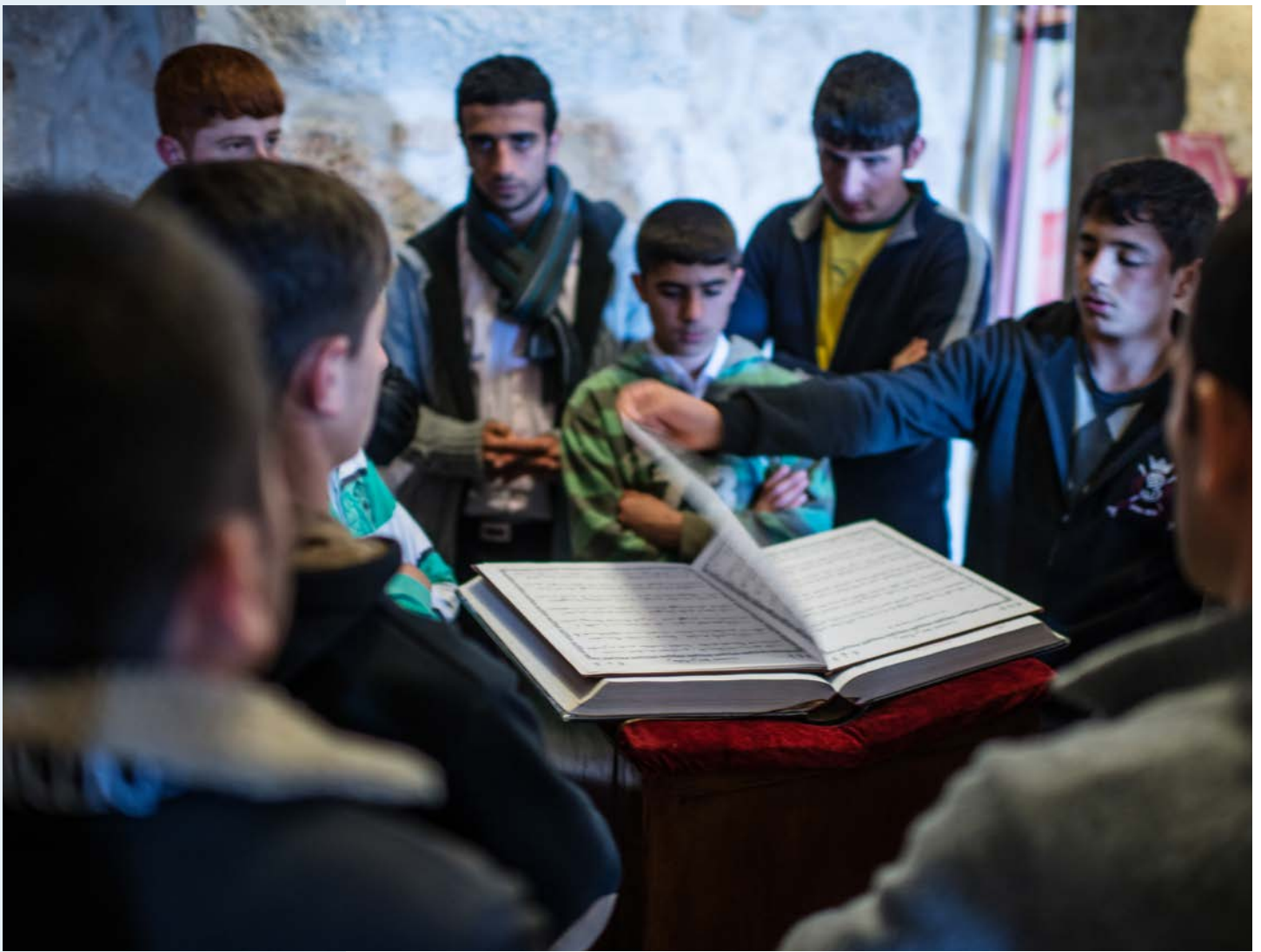
Unge leser Bibelen i en syrisk-ortodoks menighet i Tur Abdin i Tyrkia.