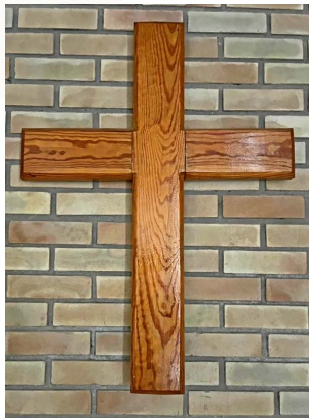
Et kors på veggen i en kirke nord i Tadsjikistan.

TEKST OG FOTO: JOHANNES MORKEN, TADSIKISTAN