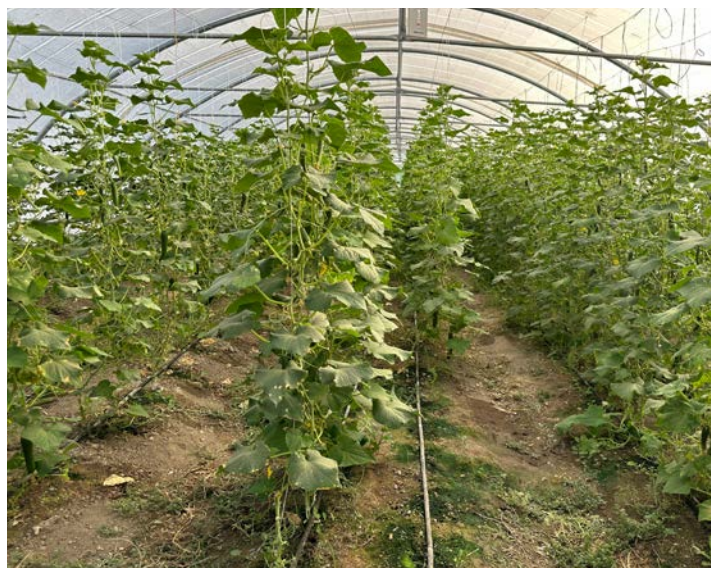
Drivhus gir bønder mulighet til kontrollert vanning.