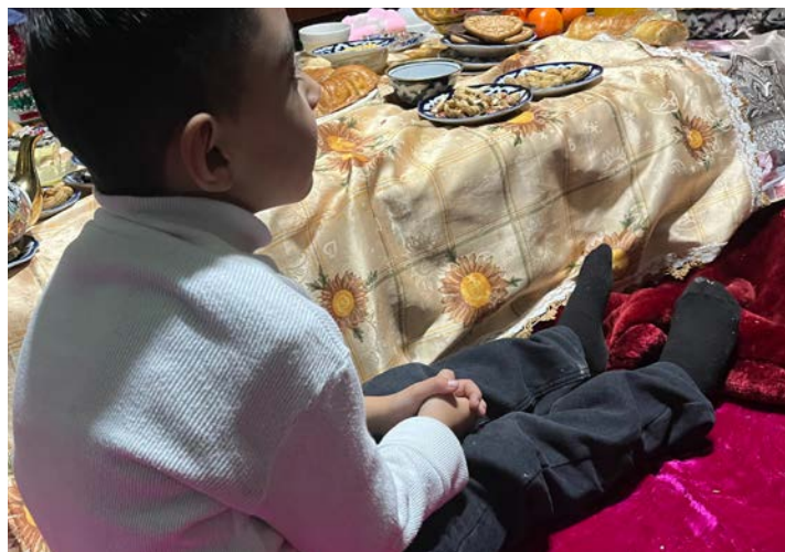
I husfelleskapet er også barn med, sjølv om heller ikkje det er lov.