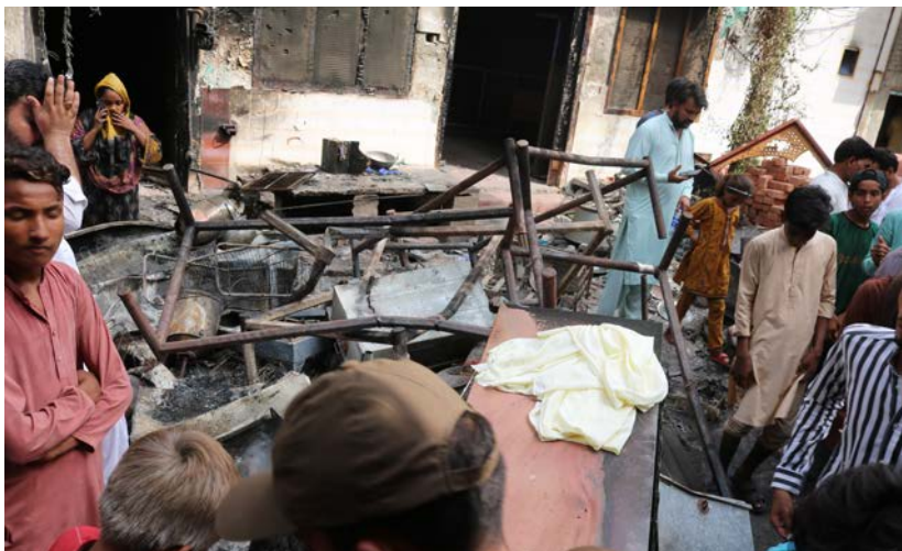
Slik så det ut i Jaranwala etter mobbens herjinger den 16. august 2023.

” Vi arbeider opp mot myndighetene for å gjøre dem i stand til å hindre at slike tragedier skjer igjen.