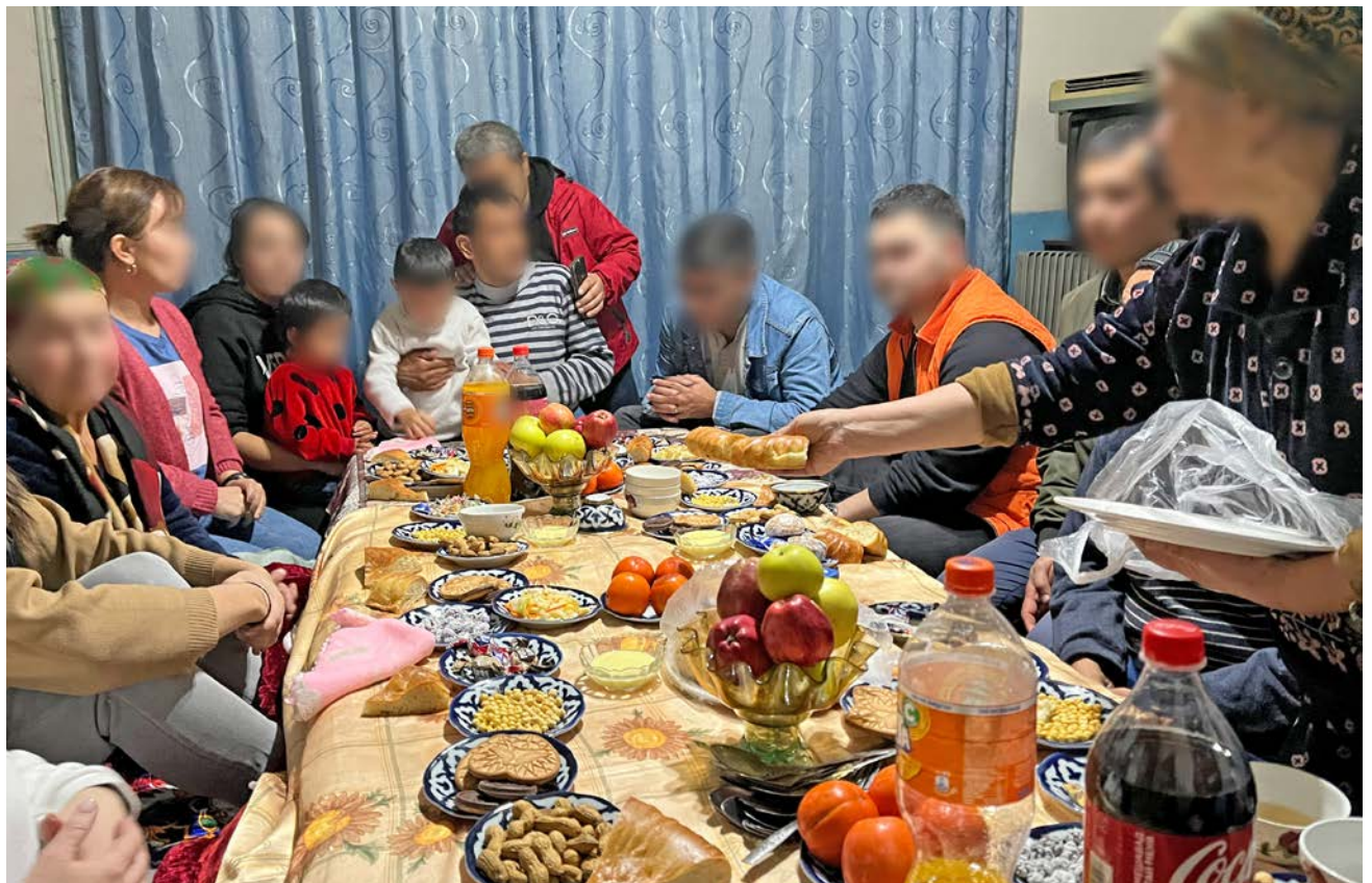
Kvinner og menn er samla rundt eit rikeleg dekt matbord.

Dei deler trushistorier. Ei kvinne fortel om kampen for å klara omsorga då mannen