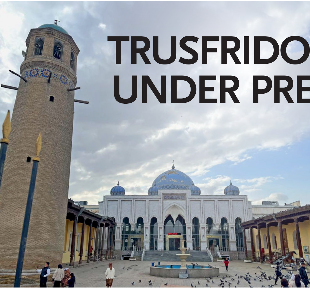
Ein gamal moské i ein by nord i Tadsjikistan.

Kristen trusfridom i Tadsjikistan blir ramma av regjeringas kamp mot radikal islam.