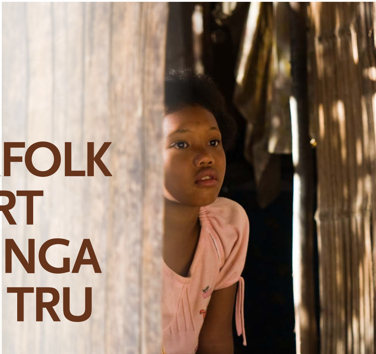
Eit barn frå batek-stamma i Malaysia.

Ho er advokat som står opp for urfolk som med tvang er blitt konverterte til islam. Siti Kasim trur at ei bombe under bilen hennar var meint som ein trussel og ei åtvaring.