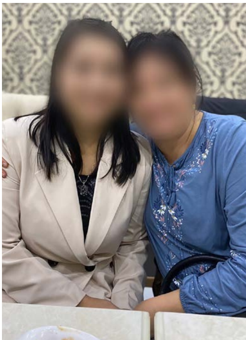
«Larisa» (21), som måtte flykte for livet, sammen med Ludmila som hjelper henne og mannen. Navnene er ikke deres virkelige.

Det unge ekteparet kom seg i sikkerhet før mobben kom for å steine dem. Nå får de hjelp mot traumer.