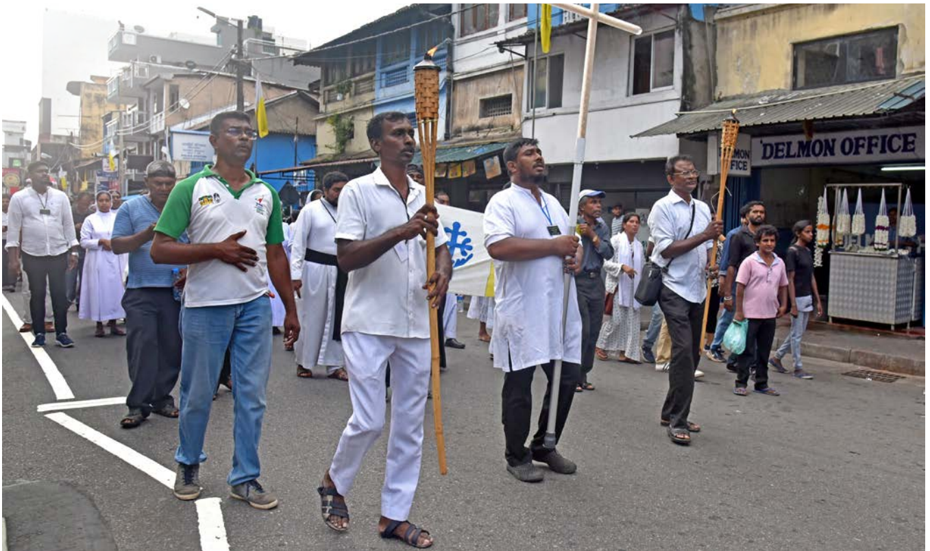
Kristne i minne-seremoni ved en av de rammede kirkene, St. Anthony i Colombo, 21. april 2023 – på fireårsdagen for terroren påskedag 2019.