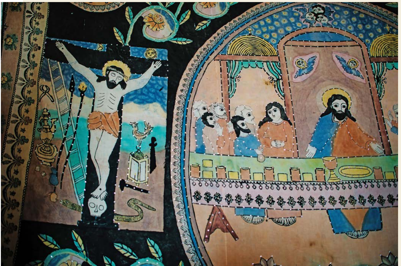
Fra en syrisk-ortodoks kirke i Tur Abdin, sørøst i Tyrkia.