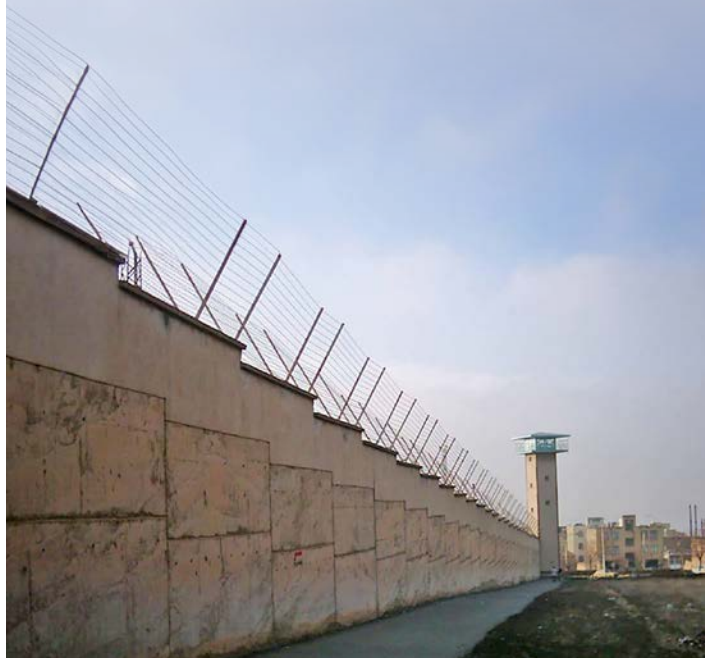
I Rajaj Shar-fengselet i Karaj i Iran har fleire konvertittar vore bura inne.

Ayatollah-regimet i Iran arresterer kristne som deler ut biblar. Dei overvakar, bankar opp og trugar. Arresterte konvertittar vert tvinga gjennom islam-undervisning.