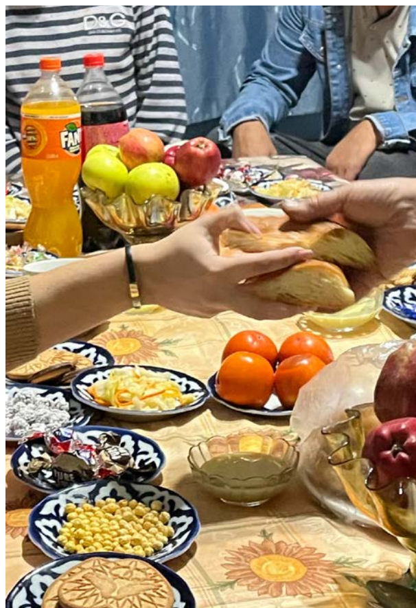
Brødet ble sendt rundt i husfelleskapet i Sentral-Asia.

” Vi er også del av den verdensvide kirken, som deler hverandres glede og smerte.