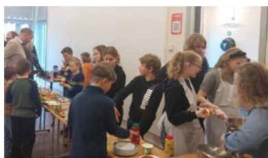
Barna hadde ansvaret for serveringen på misjonssøndagen i Skåre menighet.

Totalt ble det samlet inn ca. 32 000 kroner.