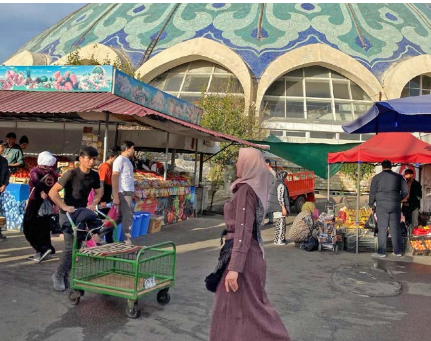
I gatelivet i Usbekistan er det flere enn før som kler seg i typisk muslimsk drakt.

Pastoren skjulte lenge politiets overgrep og avhør for kona. Så fikk de sammen hjelp på tilfluktstedet «Josefs hus». Nå åpner de sin egen dør for unge kristne.