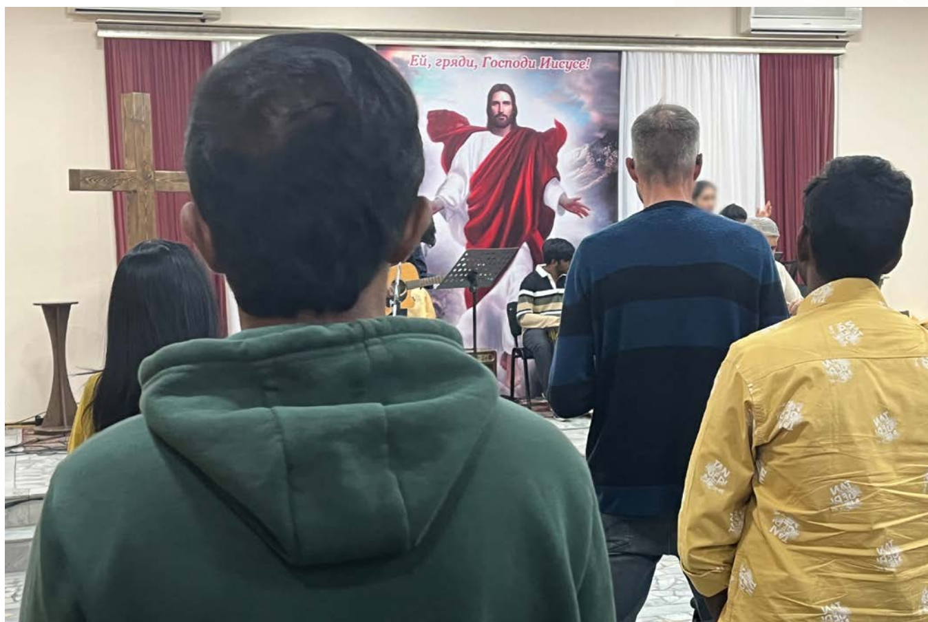
I denne kyrkja i hovudstaden Tasjkent er det gudstenester på russisk, usbekisk og engelsk.