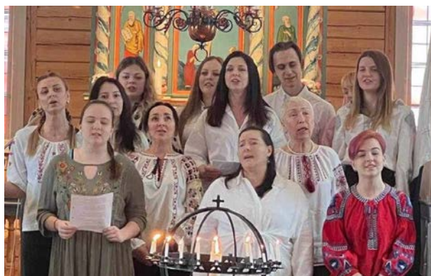
Sand kyrkje i Suldal kommune hadde internasjonal gudstjeneste 11. februar med musikk fra hele verden og ofring til Stefanusalliansen.