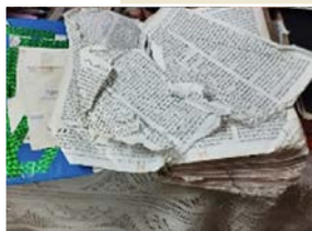
Øydelagde biblar, ein knust kross og fysiske skadar på menneske – fire uttrykk for vald mot kristne i India i 2023.

Valdsbølgja i delstaten Manipur i fjor er ikkje med i statistikken. Ei av årsakene er, ifølgje generalsekretær