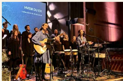
«Gåten om korset» ble fremført i Kulturkirken Jakob i Oslo 10. mars. Duoen Garness var sammen med koret Mosaic.