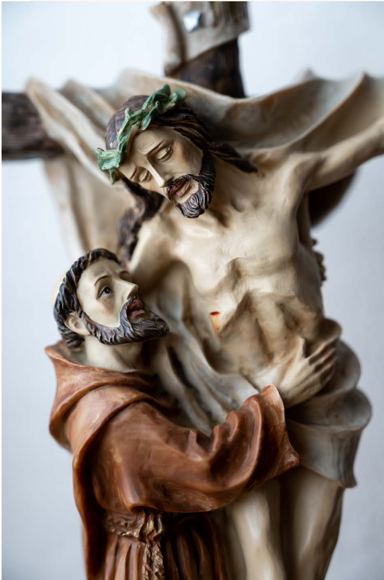
En skulptur der Frans av Assisi omfavner Kristus.