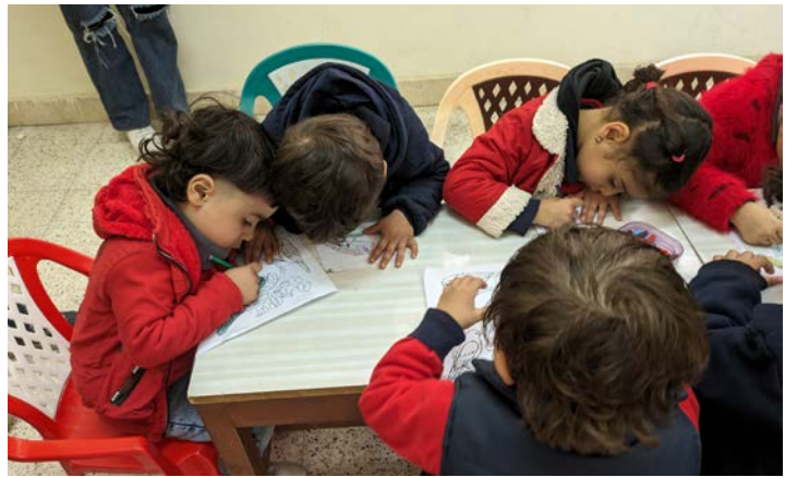
Barna i Kairos «søppelby» er levende eksempler på at hjelpen nytter.