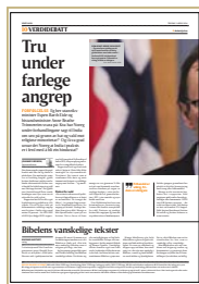
Kronikk i Vårt Land om utviklinga i India. Faksimile, 2.4.2024