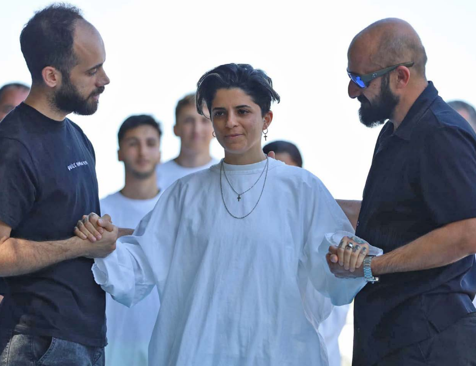
Nye truande blir døyppte i ein av to dåpsseremoniar i 2023.