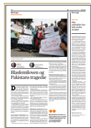
Innlegg i Aftenposten om Pakistan, blasfemi og vald. Faksimile, 24.8.2023