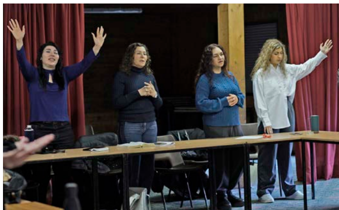
Lovsang under en Pars-konferanse i 2023.

– Mange av mennene hadde traumer fra krigshandlinger, de aller fleste hadde opplevd at fedre, brødre eller nære venner var drept eller skadet i borgerkrig. Enkelte av dem hadde traumer fra forfølgelse, sier pastor Ron.