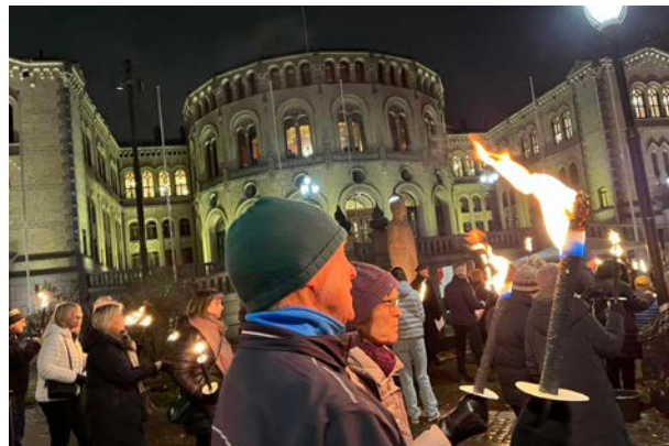
Fakkeltog i Oslo gikk til Eidsvolls plass foran Stortinget.

Sammen med Åpne Dører ble det i 2023 arrangert fakkeltog i 22 byer og tettsteder. Mottoet var å støtte dem som blir utestengt for sin tro: Kidnappet, arrestert, fengslet, dødsdømt, tvangskonvertert, tvangsgiftet, voldtatt, mobbet, banket opp, fratatt jobben, nektet skolegang, utelatt fra pensum, stempelt som forræder, kastet ut hjemmefra, fordrevet, fått sitt gudshus stengt, utsatt for razziaer i sine hjem.