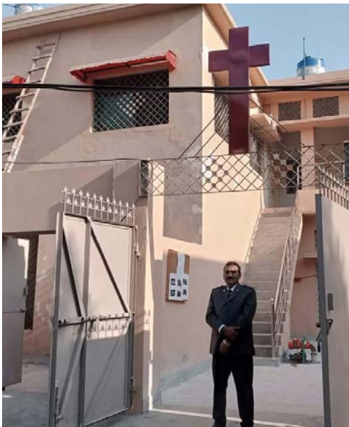
Kirken til Frelsesarmeen i Jaranwala i gjenoppbygget stand.

Katastrofen rammet kristne nabolag i Jaranwala nær Faisalabad i august 2023: En rasende mobb brente og ødela kirker og hjem etter at de – uten bevis – hadde beskyldt to kristne brødre for å ha skjendet en utgave av Koranen.