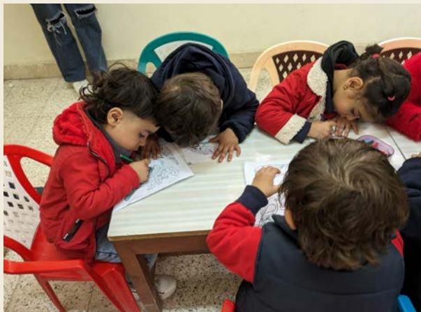
Barna i Kairos «søppelby» er levende eksempler på at det nytter.