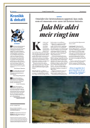
Kronikk i Klassekampen om kristen flukt frå Midtøsten. Faksimile, 23.12.2023