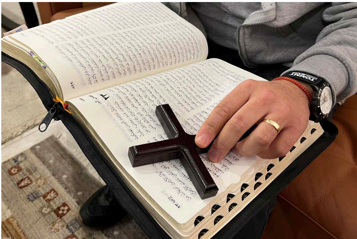
Konvertitten Yousef finn kraft i Bibelen og i bøn.