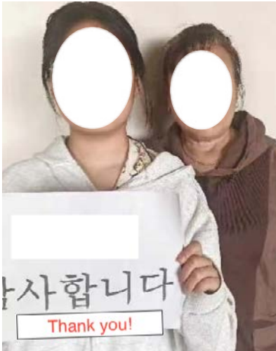
En bestemor og hennes barnebarn takker for redningsaksjonen.

flyktninger. Kinesiske kirker spiller en nøkkelrolle for å sikre trygge steder for flyktninger som har kommet seg ut av Nord-Korea. Flere koreansk-kinesiske kirker som har beskyttet flyktninger, ble tvunget til å stenge i 2023, sier Peters.