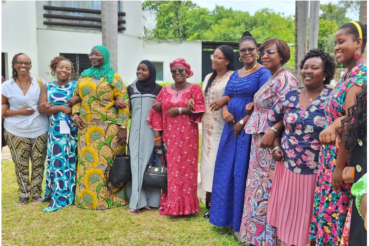
Engasjerte kvinner for alles rett til trosfrihet, her på en PROCMURA-samling i Nairobi i Kenya.