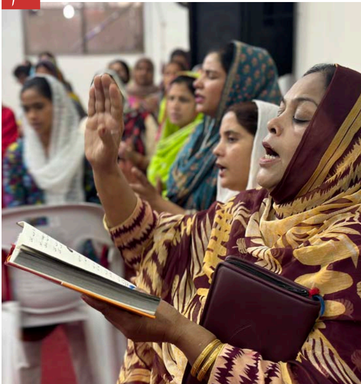
Kristne kvinner i bydelen Johannabad i Lahore i Pakistan under ein gudsteneste.