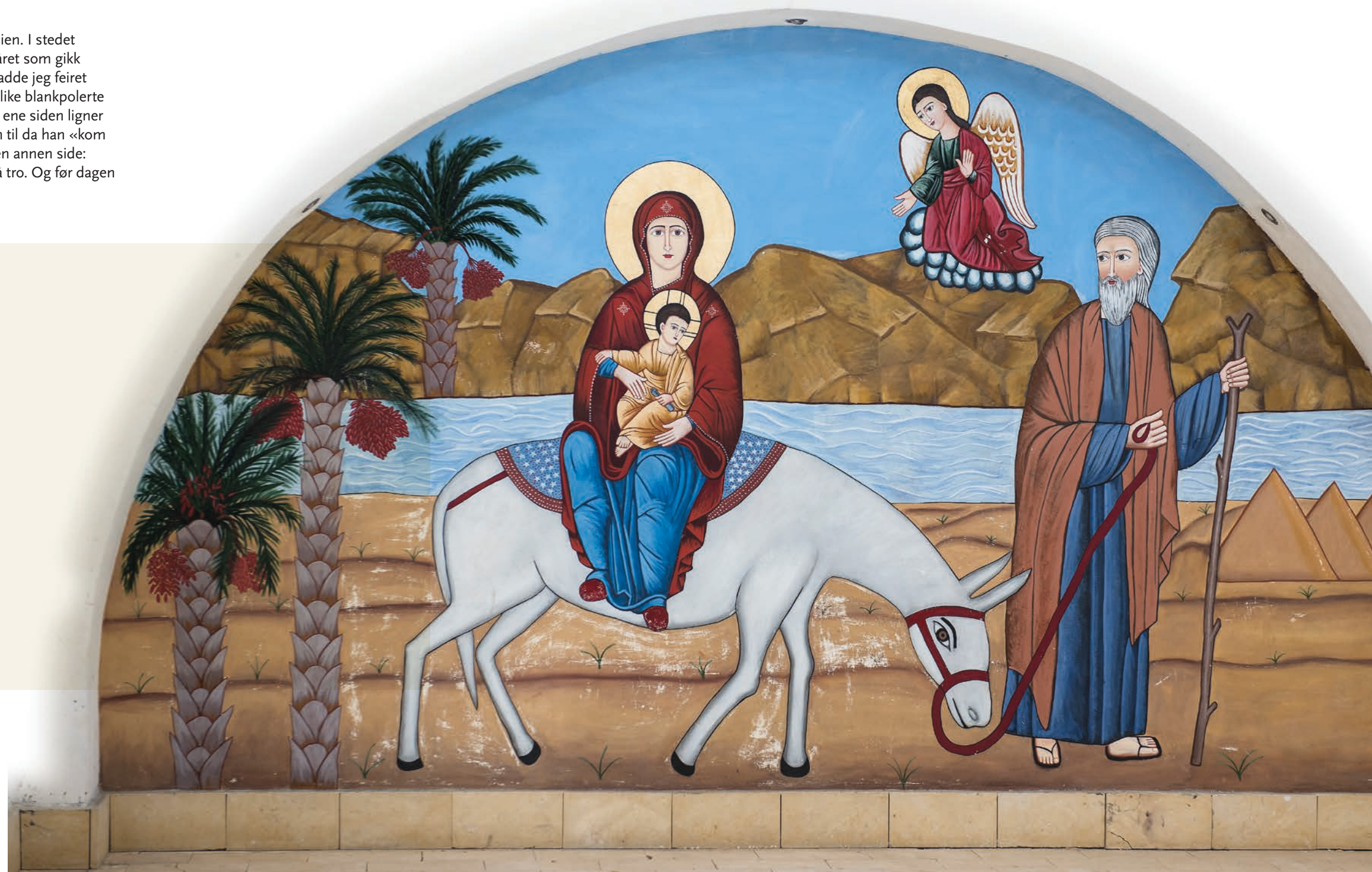
Ikone fra Anafora, retreatstedet biskop Thomas har bygget opp i Egypt.

” Til jordens minste, til verdens skygger kom Gud alene og banket på.