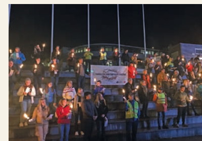
Omtrent 100 deltok i fakkeltog i Arendal.