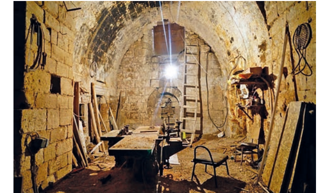
Mor Yuhanon-kirken – blir den solgt?