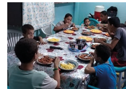
Det blir flere hjem for gutter og jenter. Her et hjem for gutter.