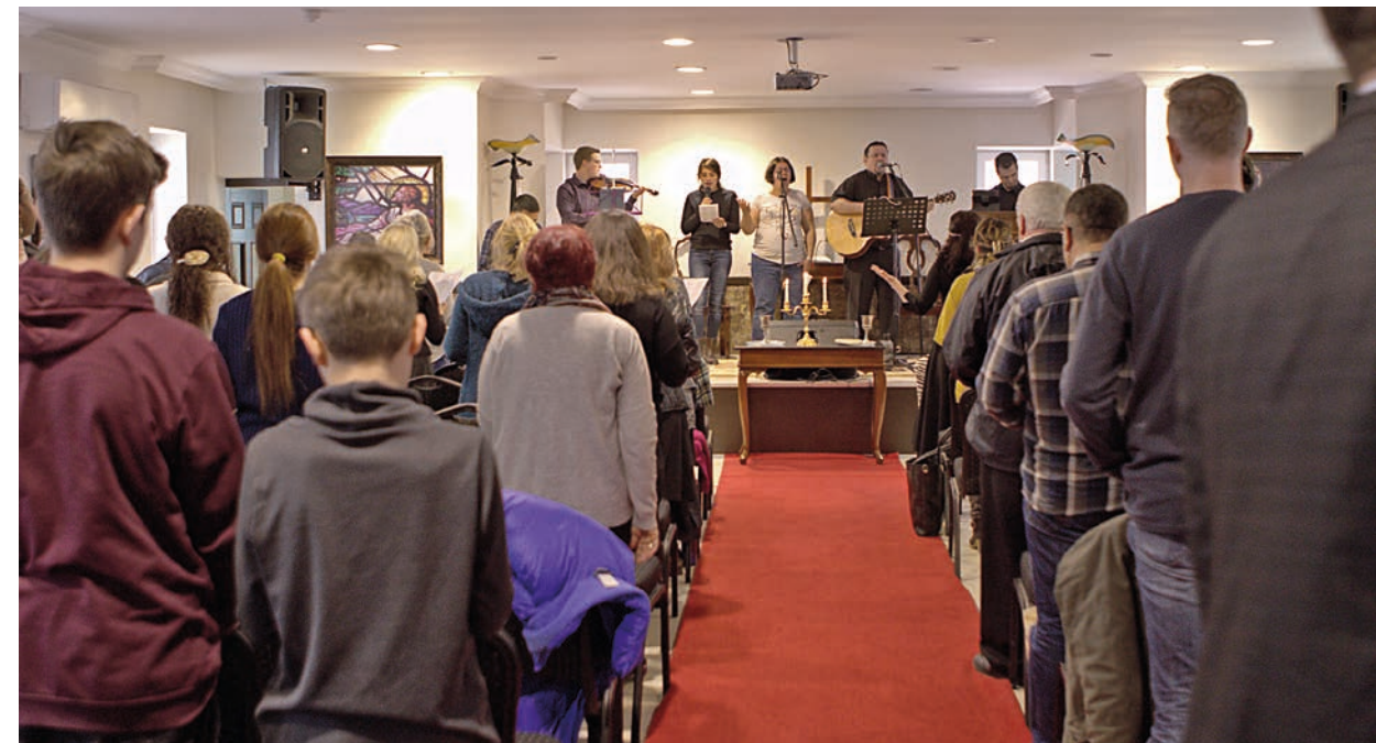
Menigheten i Antalya, som Stefanusalliansen støtter, har mistet to utenlandske kristne.