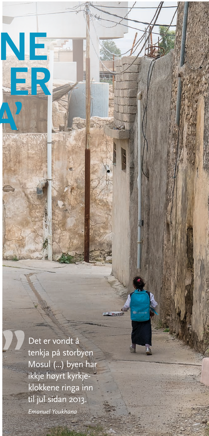
Ei lita jente i den kristne byen Tel Skuf i Nord-Irak på veg til skulen. Har ho ei framtid i Irak?