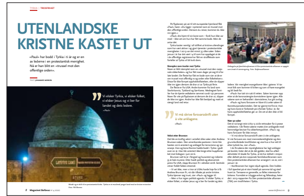
Faksimile: Magasinet Stefanus 4-2020