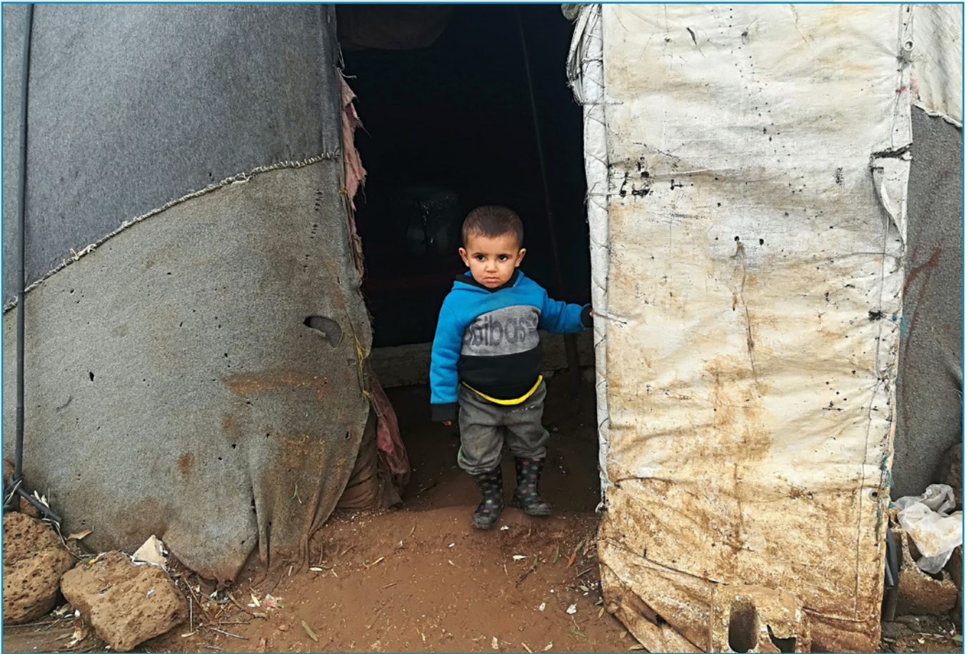
«Hvor flyktningleirer sprenges er du hos dem som lenges imot et hjem et sted hvor gresset dufter fred.»