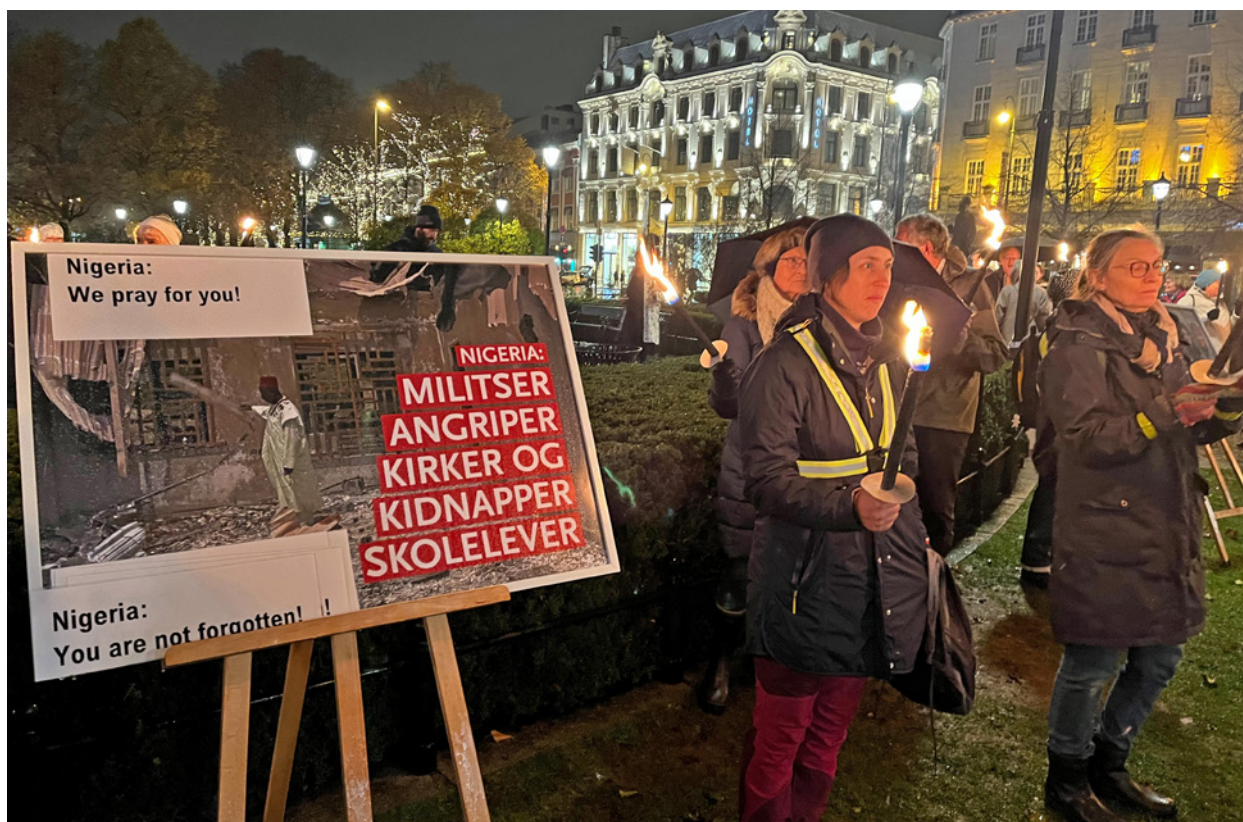
Drap og kidnappingar øydelegg Nigeria. Biletet er frå fakkeltoget i Oslo i 2023.