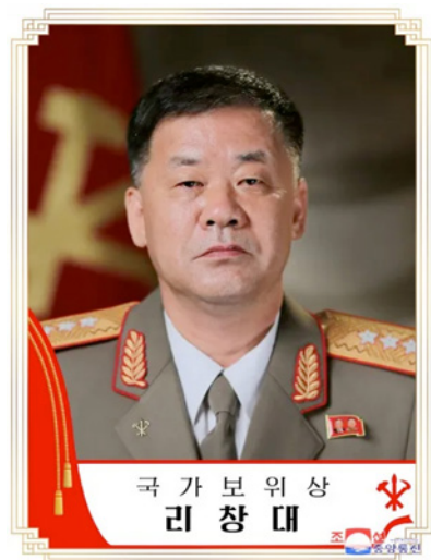
Ri Chang Dae, minister for statssikkerhet.

Folk fra Nord-Korea møter kristen tro under besøk i Kina, dit mange reiser for å skaffe varer til å selge i Nord-Korea. Det skjer også ofte at flyktninger fra Nord-Korea møter koreansk-kinesiske undergrunnskirker i Kina. Det er redningen for flyktninger. Men flyktninger som blir tatt, sendes nådeløst tilbake til Nord-Korea og havner i ett av MSS-sentrene. Der venter det dem en gruffull skjebne.