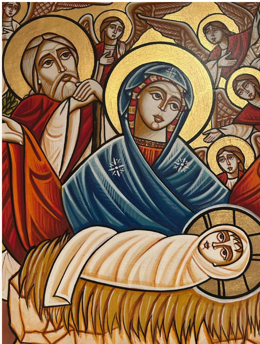
Ikon malt av Armia El Katcha, Egypt