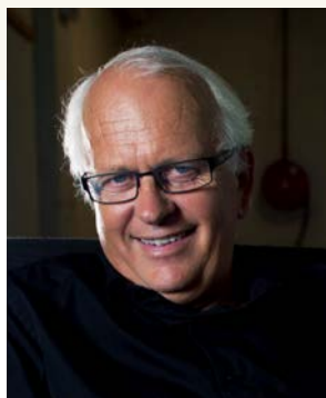
Eyvind Skeie er prest, salmedikter og forfatter