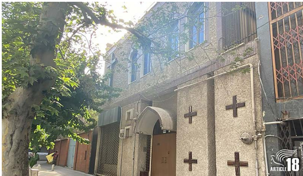
Assemblies of God-kyrkja i Teheran var den største som brukte persisk språk. Ho var registrert og godkjent som kyrkje med armensk språk, men opna seg for konvertittar frå islamsk bakgrunn.