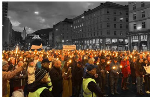
Fakkeltog for forfulgte i Bergen.