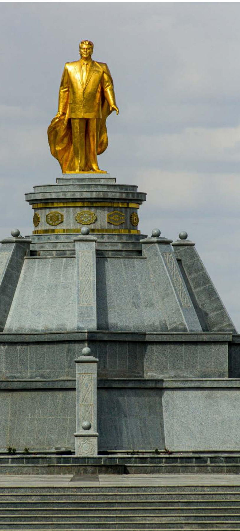
I Asjkhabad ruver gullstatuen av Saparmurat Nijazov, diktator fra 1991 til sin død i 2006.

Saken fikk stor oppmerksomhet utenfor landet.