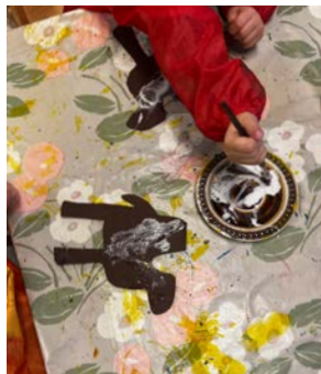
Barna lager en kamel som ble brukt for å pynte i barnehagen.

Den 29. oktober var det Egypt-fest i barnehagen. – Dette er en dag alle barna gledet seg til. Da kunne de ta med besteforeldre, tanter og onkler, foreldre og søsken til fest i barnehagen. Vi solgte mat, lodd og hadde basar, og barna underholdt med sang. Det ble en skikkelig festkveld, med stappfull barnehage. Foreldre og næringsliv hadde bidratt med kaker, boller og gevinster. Det er ikke noe å si på engasjementet verken hos foreldre eller ansatte.