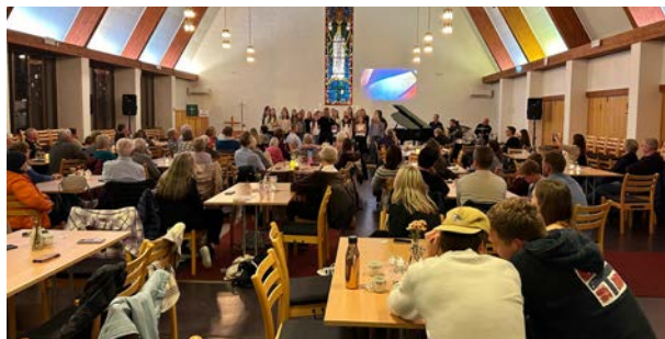
Heile 120 kom på fellesskapskveld i Hjelme kyrkje.