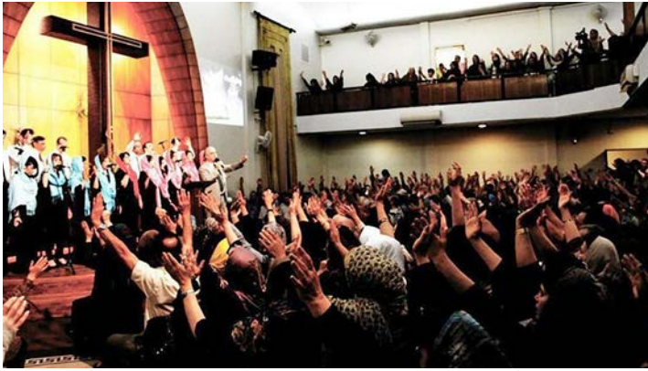
Assemblies of God-kyrkja i Teheran var fullsett tre gonger i jula 2012, månader før ho var stengt.

Eit par år – som i 2009 – droppa dei julefeiringa fordi juledag fall saman med ein viktig martyrdag for sjia-muslimane. Kyrkja ville ikkje risikera politibesøk.