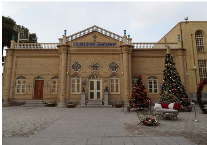
Den armenske Vank-kyrkja i Isfahan vest i Iran er som andre godkjende kyrkjer, pynta til jul. Men kristne i hemmelege huskyrkjer lever med frykt.