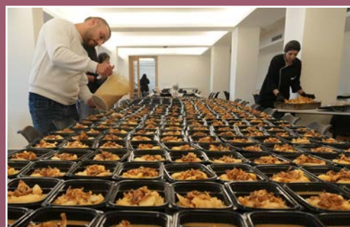
De som flykter fra krigen, får mat hos Arab Baptist Theological Seminary.