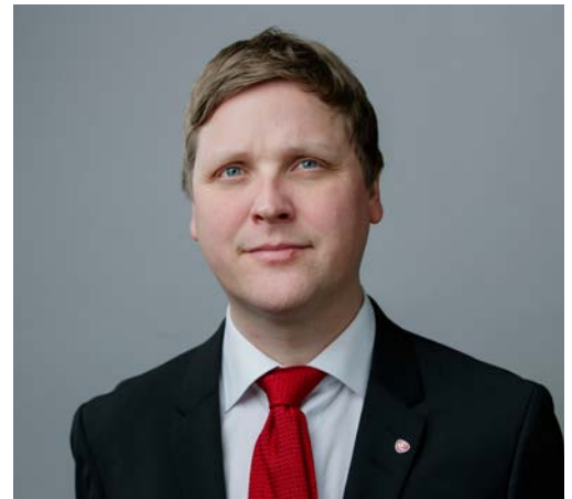
Utviklingsminister Åsmund Aukrust snakka, ifølgje UDs offentlige rapport, ikkje om menneskerettar i Vietnam.

Helt på tampen av 2025 vart Bdap framstilt på statleg vietnamesisk TV med ei «tilståing» av at han var med på åtak mot to politistasjonar i Dak Lak i Vietnam i juni 2023. Det var angrep Bdap tok avstand frå då dei skjedde. Den 30. januar i år publiserte ein TV-kanal driven av det vietnamesiske tryggingdepartementet, ei