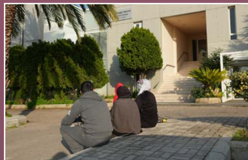
Mennesker som er drevet på flukt, søker beskyttelse hos Arab Baptist Theological Seminary.