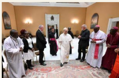
Pave Leo roste arbeidet til Procmura, som er Stefanusalliansens partner.

Paven roste arbeidet til Procmura. Han sa at deres felles vitnesbyrd viser hvordan religioner kan samarbeide for å fremme fred og det felles beste.