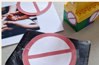
I skattekista var det satt forbudsskilt på en bibel, en kirke og et kristent fellesskap.