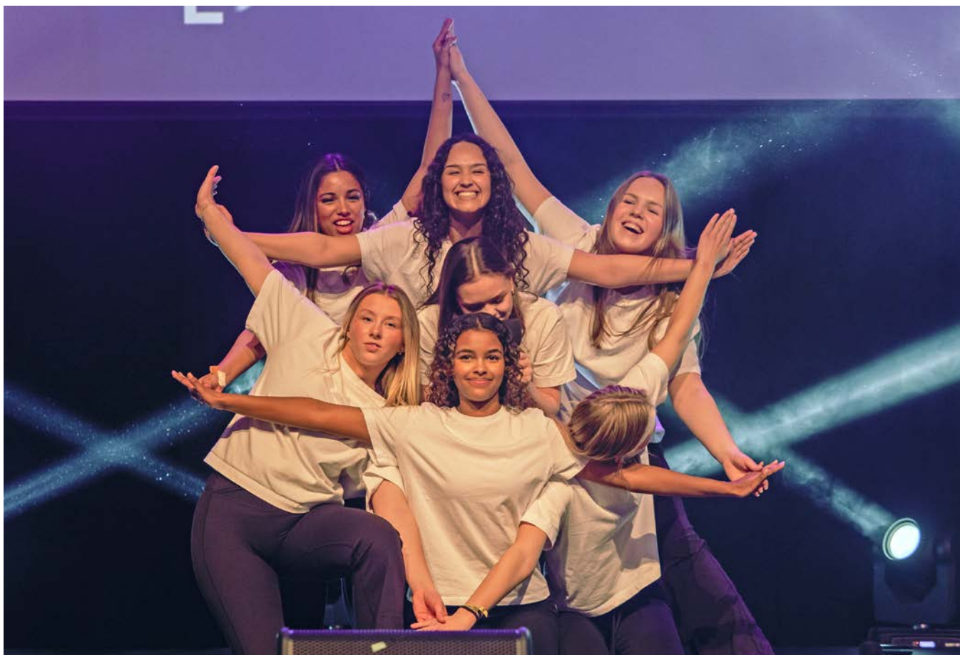
Talentiade er ett av de kreative tiltakene for å samle inn penger til Nord-Koreas forfulgte.