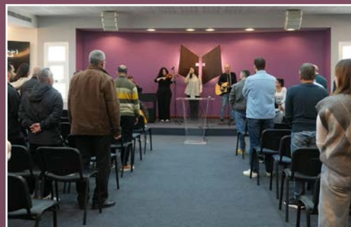
I kapellet samles flyktninger og stab i bønn.