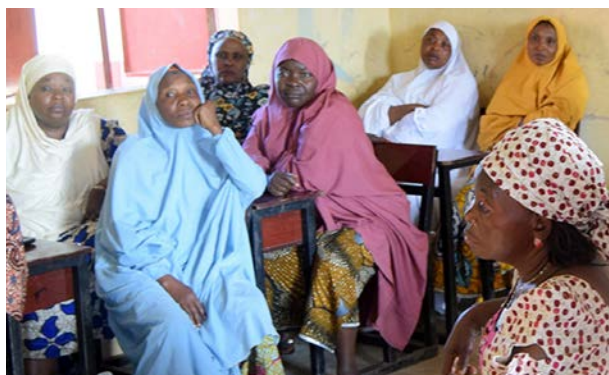
- Kvinner i den globale kirken er ofte blant de mest handlekraftige aktørene i arbeidet for fred og trosfrihet, skriver artikkelforfatterne.

Men dersom vi kun beskriver dem som ofre, gjør vi både dem og oss selv en bjørnetjeneste. For sannheten