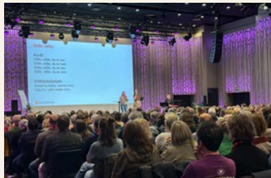
Over 500 kirkelig ansatte var samlet under Stiftsdagene i Bjørgvin.

Mer enn 500 kirkelig ansatte var 9. og 10. mars samlet i Bergen til Stiftsdager i Bjørgvin bispedømme. Stefanusalliansen hadde stand. Det er en god arena for å møte kjente og nye fjes, for å pleie relasjoner og skape nye. Det er inspirerende og oppløftende å høre om menigheters engasjement for misjonsprosjektene og å møte deltakere som har god erfaring med å bruke Stefanusalliansens trosopplæringsmateriell. Slike storsamlinger gir oss gode muligheter til å synliggjøre vårt arbeid både med «Søndag for de forfulgte» og misjonsprosjekt. Menighetene kan gjennom Stefanusalliansen velge blant prosjekter i fire ulike land: Undergrunnskirker i Iran, Stefanusbarna og Anafora i Egypt, menigheten i Antalya i Tyrkia og blasfemiofre i Pakistan.