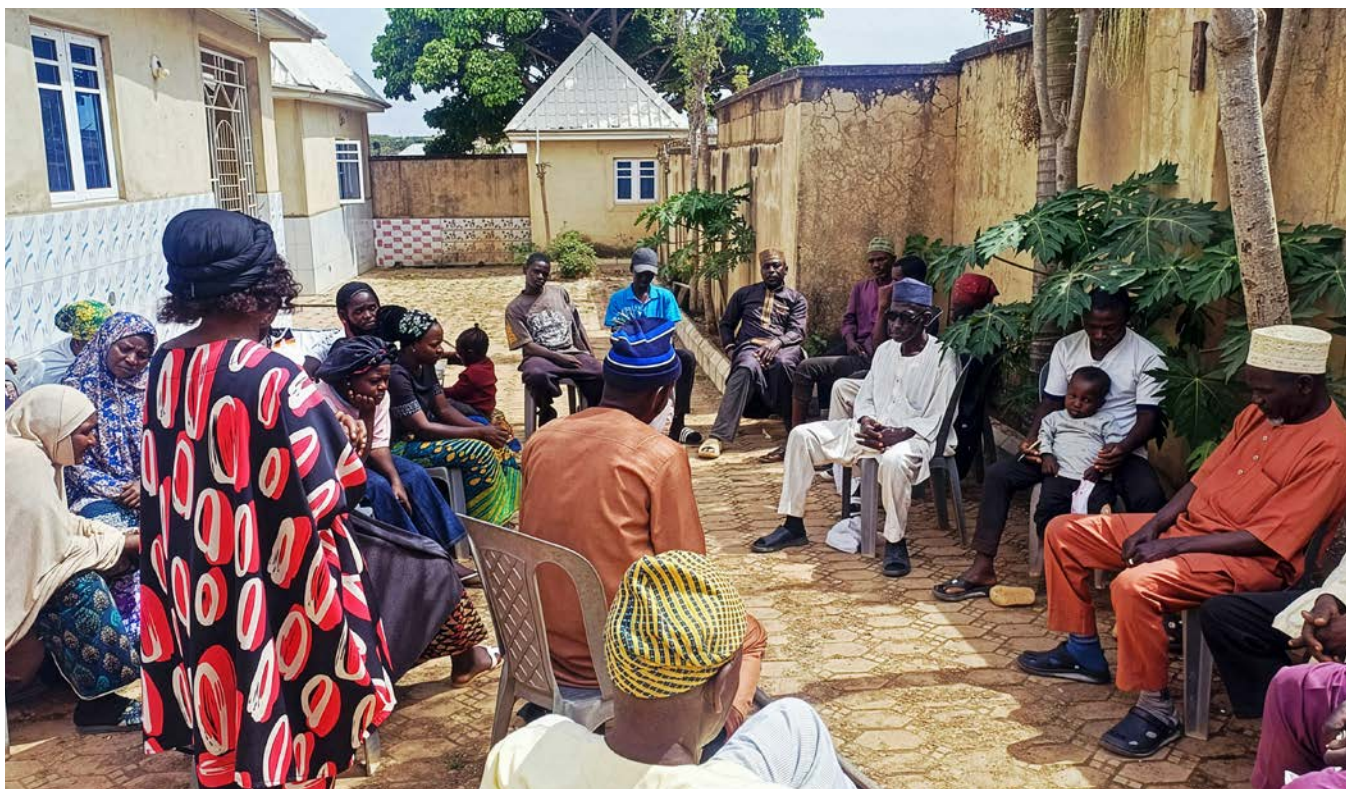
Kvinner tar aktive skritt i lokalt fredsarbeid i landsbyer.