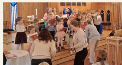
Barn og voksne i Sula menighet er sammen for Egypt.

Også i Ørskog sokn som har menighetsavtale med vekt på Tyrkia, får konfirmantene undervisning om arbeidet.