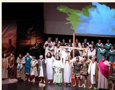
Antalya-kirken hadde påskespill for 600 mennesker, pluss menighetens egne.

Hver jul og påske arrangerer Antalya-kirken store samlinger i lokaler utenfor de tre kirkestedene. Etter at menigheten i fjor fikk beskjed om at de ikke lenger får bruke byens kulturhus, leier kirken nå et privat konsertlokale. I påsken kom 600, i tillegg til menighetens egne. Alle får tilbud om et gratis nytestamente.