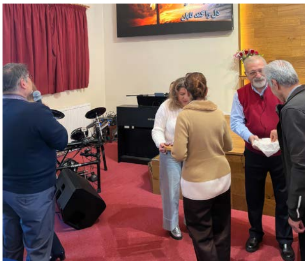
Nattverd i Iranian Christian Fellowship i London.

grunn for konvertittar, som altså berre har undergrunnskyrkjer å samlast i.