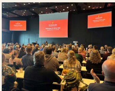
Kirkelige ansatte i Sør-Hålogaland samlet til fagdager i Bodø.