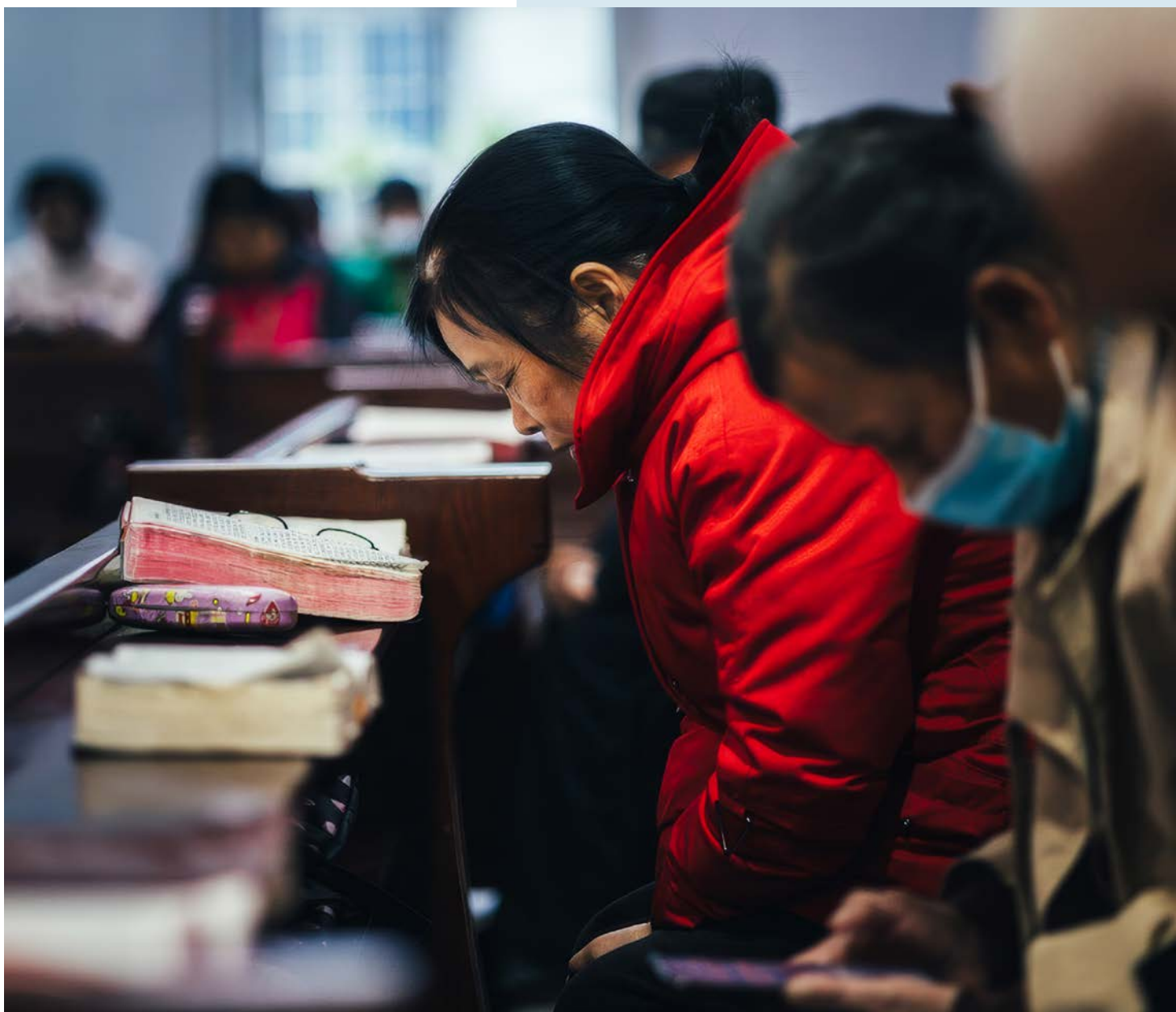
Kristne i Kina kan sin bibel, de trenger vår forbønn.