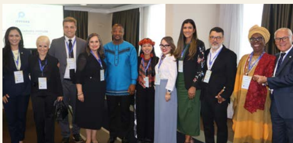
Parlamentarikere og arrangører under første dag av akademiet i Brasil.

Parlamentarikerne utarbeidet handlingsplaner og signerte São Paulo-erklæringen, som forplikter dem til arbeid etter akademiet. Sekretariatet vil følge dem opp når de skal iverksette planene som har som mål å styrke, endre eller innføre lovgivning for bedre å beskytte tros- og livssynsfriheten.